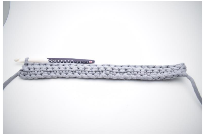
6. Gentag rækken ud.