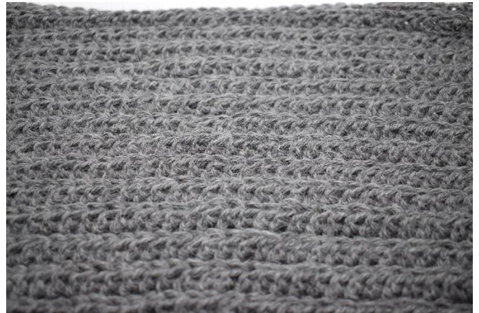
6. Gentag fremgangsmåden som række 2 i alt 27 gange.