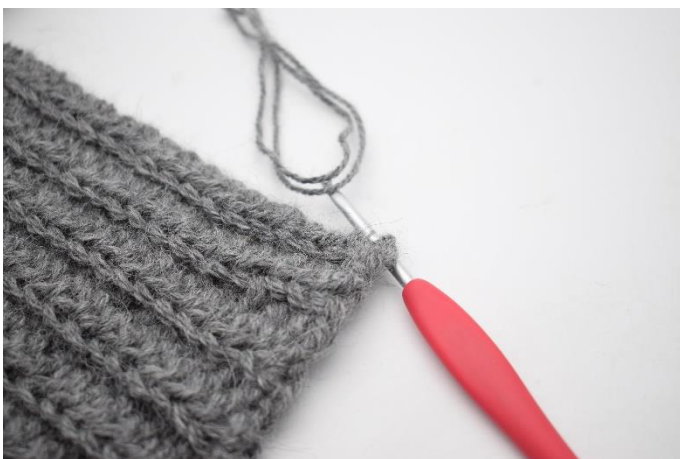
3. Indsæt en mindre hæklenål i en maske langs kanten.