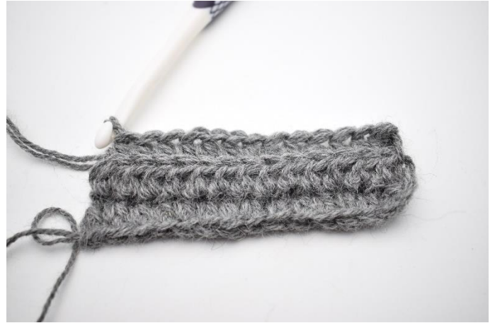
4. Gentag rækken ud. Sidste hstm hækles igennem begge maskelænker.