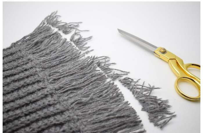
8. Klip ca. 1 cm af så de er lige lange.