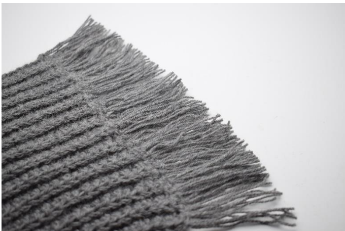
9. Gentag dette i modsatte ende af dit halstørklæde.