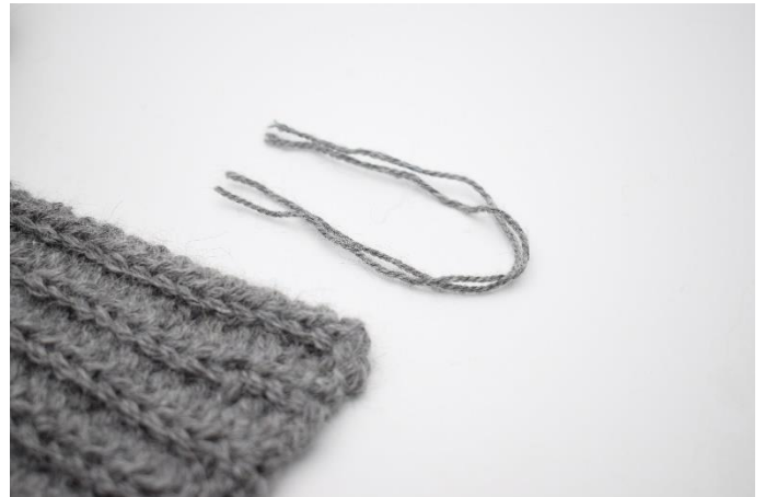
2. Fold stykket på midten.