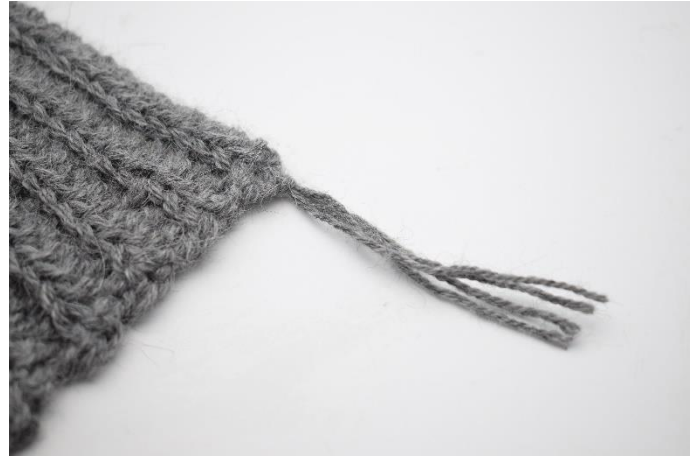
6. Stram let til.