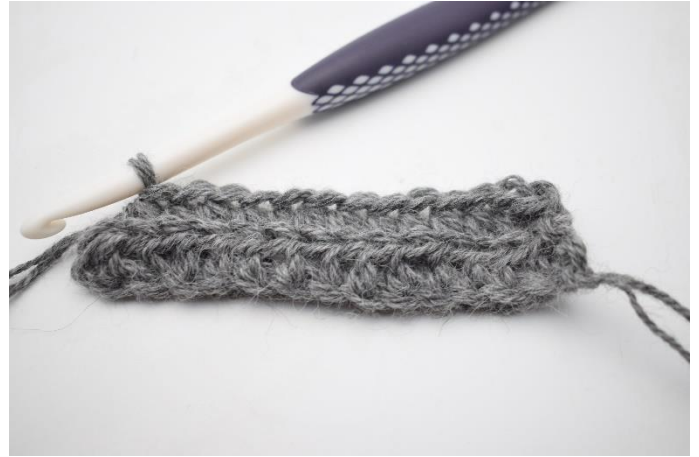
4. Hækl hstm i bml rækken ud. I sidste m kan man med fordel hækle igennem begge lænker for at undgå huller i kanten.