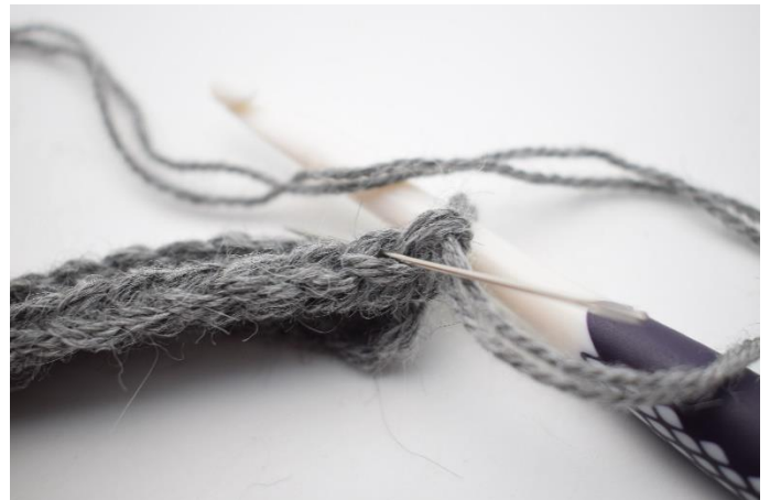
2. Hækl hstm i bml. Nålen markerer her den lænke din hstm skal hækles i.