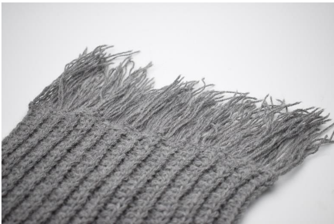
7. Gentag hele vejen hen.