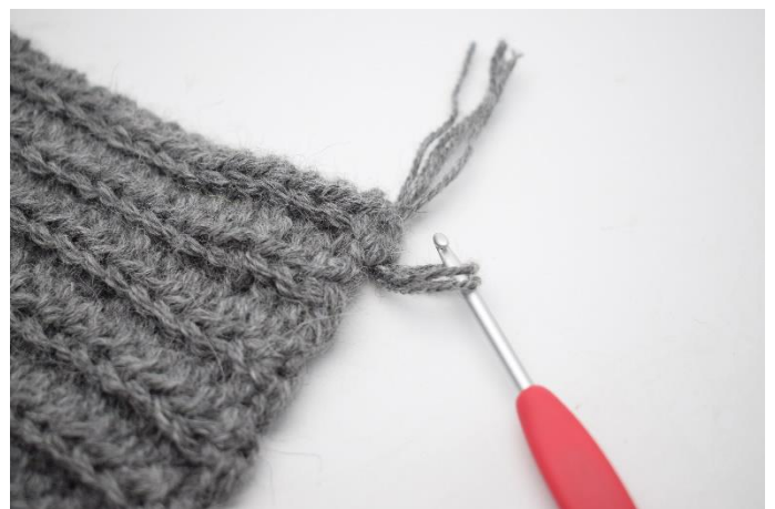
4. Træk nu stykket igennem masken med hæklenålen som vist på billedet her så det danner en løkke.