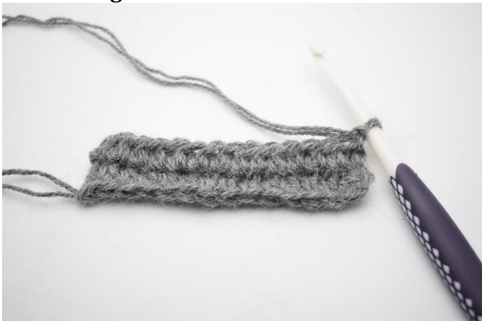
1. Gentag fremgangsmåden som række 2. Vend med 1 lm.