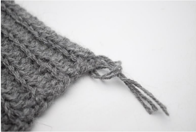
5. Træk nu garn-enderne igennem løkken.