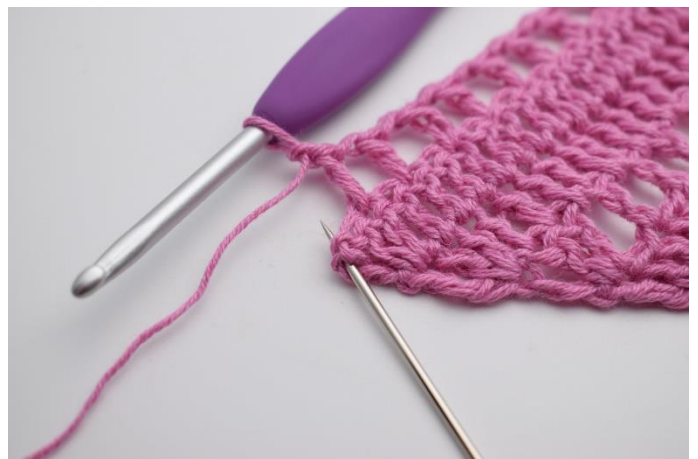
10. Lav 1 lm, spring 1 m over, og hækl 2 stgm og 1 dbstgm i sidste stgm.