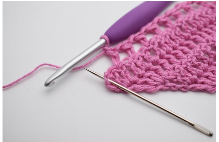
10. Lav 1 lm, spring 1 m over, og hækl 2 stgm og 1 dbstgm i sidste stgm.