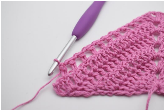
9. Gentag "til" i alt 9 gange.