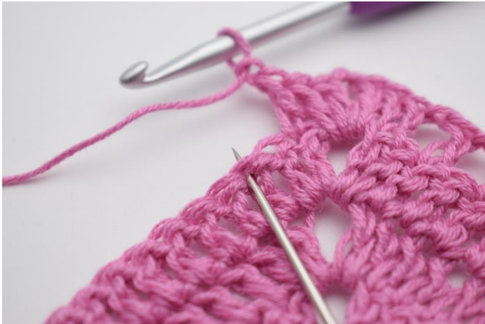
7. "Lav 1 lm, spring 1 m over, hækl 1 stgm i næste m".