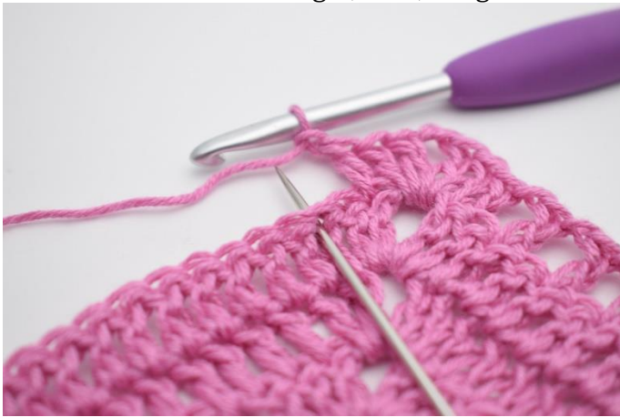
7. "Lav 1 lm, spring 1 m over, hækl 1 stgm i næste m".