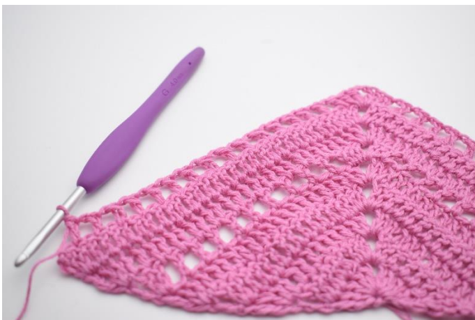
9. Gentag "til" i alt 15 gange.