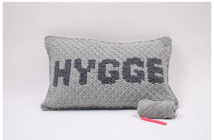
12. Klip garnet og hæft ender.

Har du spørgsmål til opskriften er du velkommen til at skrive til tine@hobbii.dk