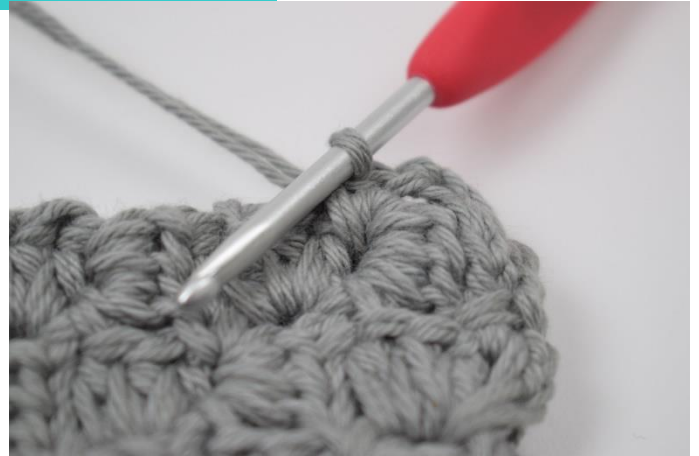
8. Hækl 1 fm imellem de næste 2 "firkanter".