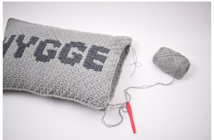
10. Kom puden i inden den lukkes helt til.