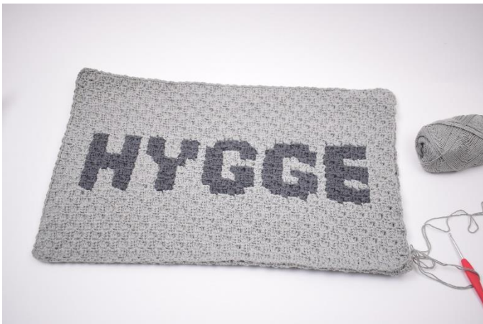
9. Gentag dette rundt om puden.