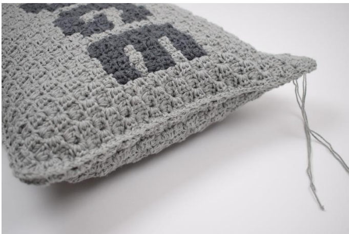
11. Fortsæt til du er hele vejen rundt. Afslut med 1 km.