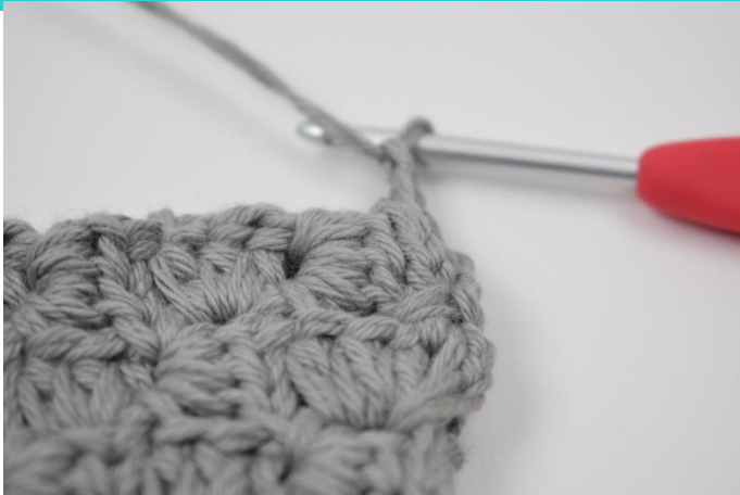
7. Lav 2 lm.