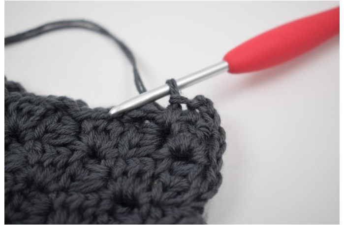
8. Hækl 1 fm imellem de næste 2 "firkanter".