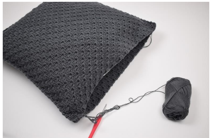
10. Kom puden i inden den lukkes helt til.