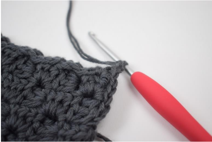
7. Lav 2 lm.