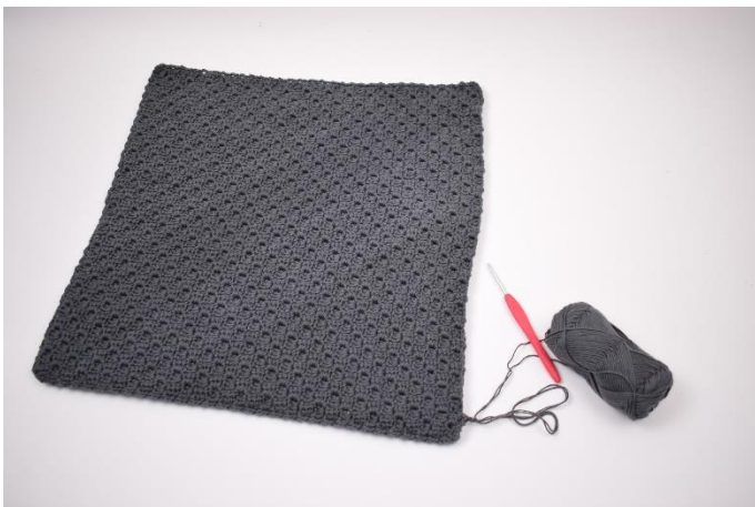
9. Gentag dette rundt om puden.