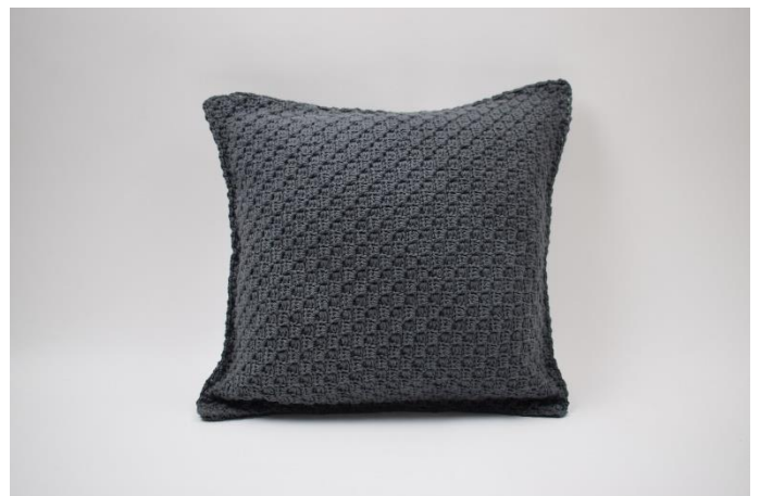
12. Klip garnet og hæft ender.