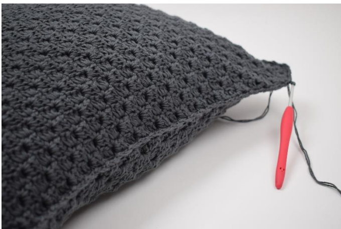
11. Fortsæt til du er hele vejen rundt. Afslut med 1 km.