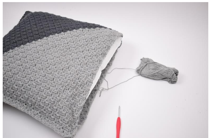
10. Kom puden i inden den lukkes helt til.