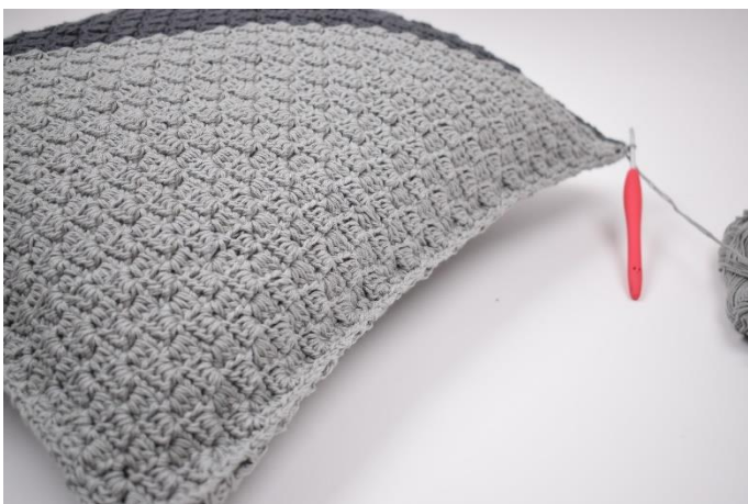
11. Fortsæt til du er hele vejen rundt. Afslut med 1 km.