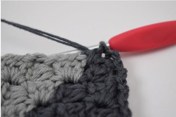
7. Gentag dette rundt om puden til du kommer til det næste hjørne hvor fv. A og B mødes. Her skiftes til fv. B.