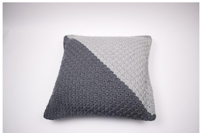
12. Klip garnet og hæft ender.