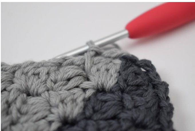
9. Fortsæt rundt om puden med fv. A.