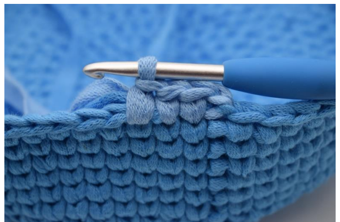
18. Hækl nu videre med fv. 2 og skift til fv.3 som beskrevet i opskriften.