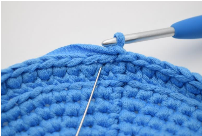
13. Hækl igen ks omgangen rundt. Nålen markerer det første "v" der skal hækles i.