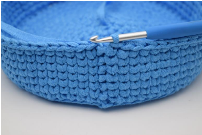
15. Gentag omgangene ks i fv. 1 som beskrevet i opskriften.