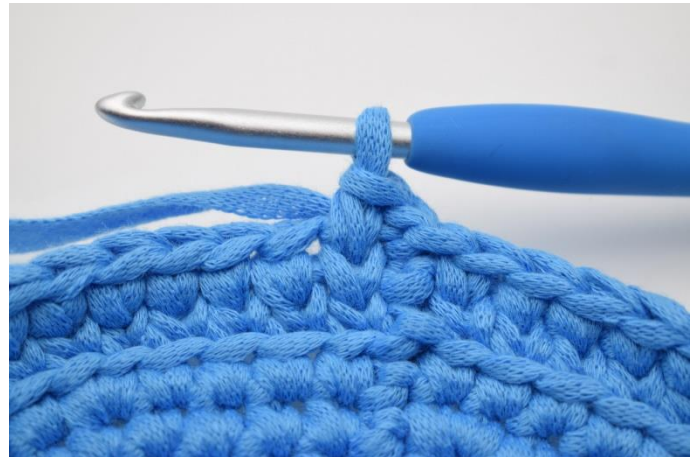
14. Sådan. Hækl ks omgangen rundt og afslut med 1 km.