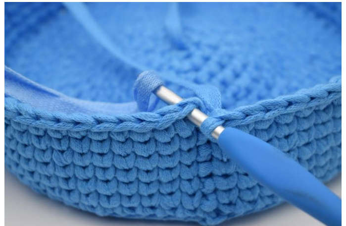
16. Skift til fv. 2 i sidste gennemtræk når du afslutter sidste omgang i fv. 1.