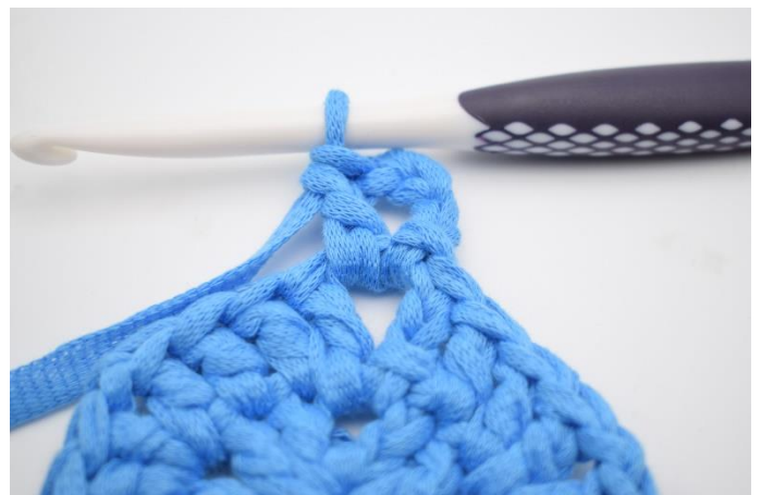
2. Lav 4 lm (erstatte 1 stgm og 1lm) Hækl 1 stfm ned i lm-mellemrummet.