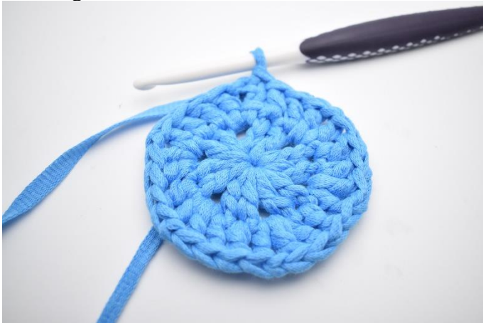
7. " I næste lm-mellemrum hækles 1 stgm, 1 lm, 1 stgm. Hækl 1 stgm i næste 2 m "Gentag "til" rundt, og afslut med 1 km i 3.lm fra omgangens begyndelse. (24)