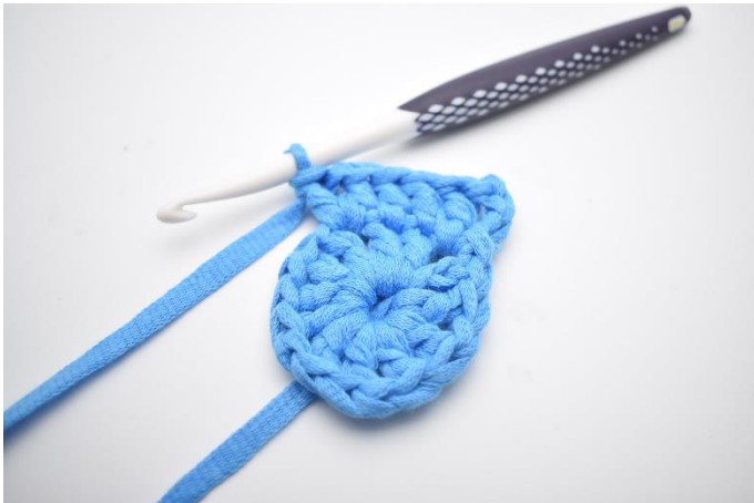
5. I næste lm-mellemrum hækles " 1 stgm, 1 lm, 1 stgm".