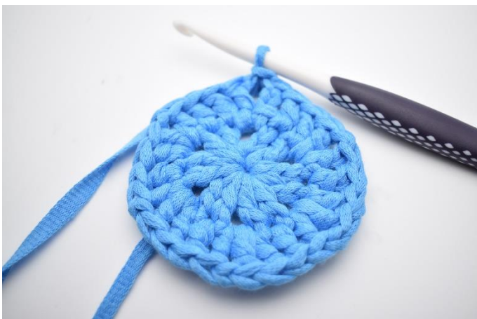
1. Lav 1 km hen til lm-mellemrum.