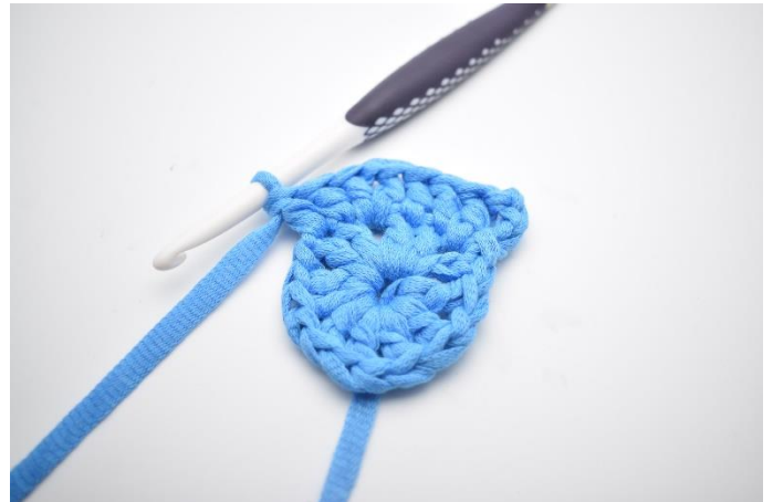
6. Hækl 1 stgm i de næste 2 m