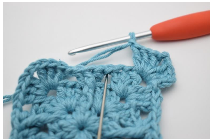
4. I næste lm-mellemrum hækles 1 stgm, 1 frdbstgm omkring den midterste m i stgm-gruppen fra omgang 2, 1 stgm og 1 lm.