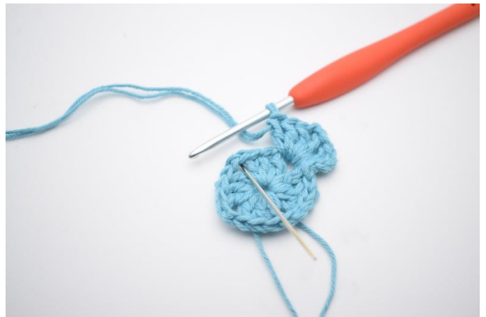
4. Hækl " 3 stgm, 2 lm, 3 stgm og 1 lm i næste lm-bue".