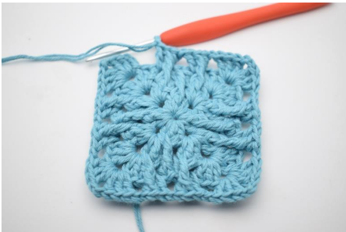
7. Hækl "3 stgm, 2 lm, 3 stgm og 1 lm i næste lm-bue. I de næste 2 lm-mellemrum hækles 1 stgm, 1 fr-dbstgm omkring den midterste m i stgm-gruppen fra omgang 2, 1 stgm og 1 lm". Gentag "til" i alt 3 gange.