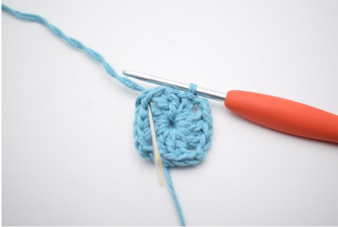
1. Lav km hen til lm-buen.