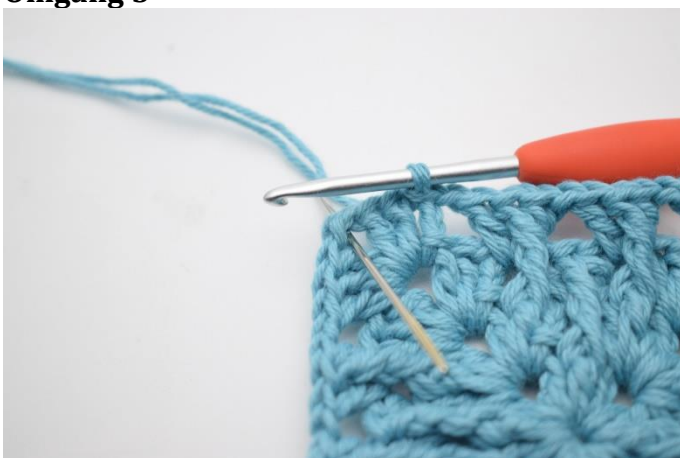
1. Lav km hen til lm-buen.