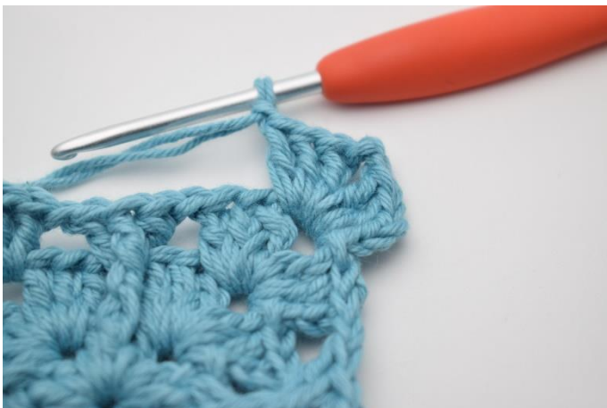
3. Lav 3 lm, hæk 2 stgm, 2 lm, 3 stgm og 1 lm i lm-buen.