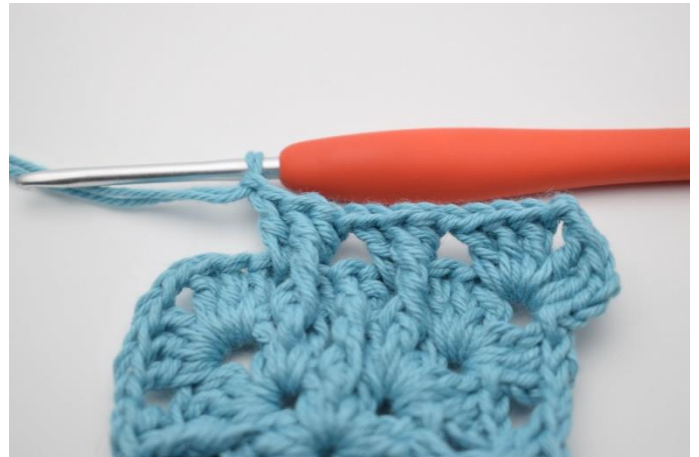
6. Gentag i næste lm-mellemrum.