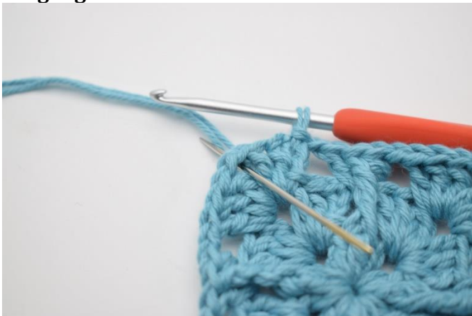
1. Lav 1 km hen til 1 lm-buen.