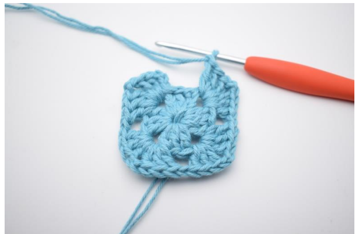
6. Gentag "til" i alt 3 gange.