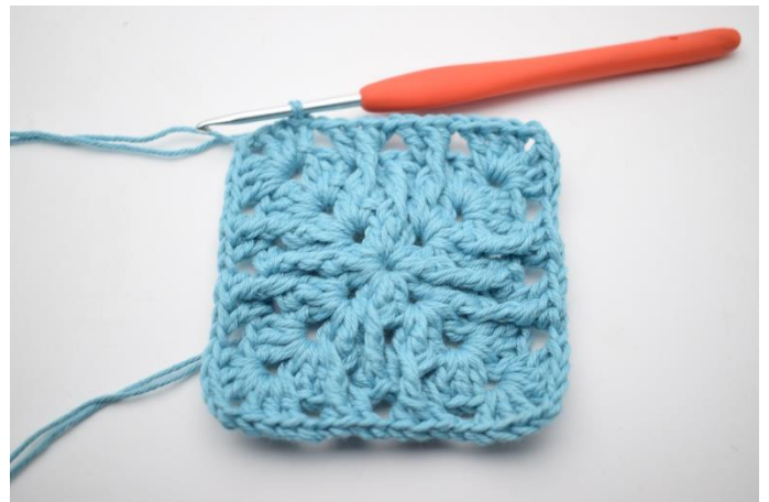
8. Afslut med 1 km.