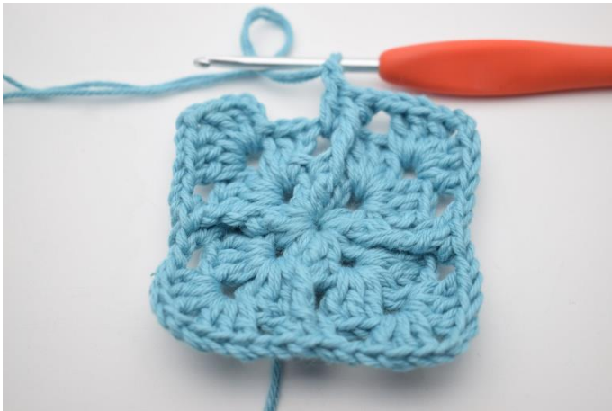
11. Gentag "til" i alt 3 gange.