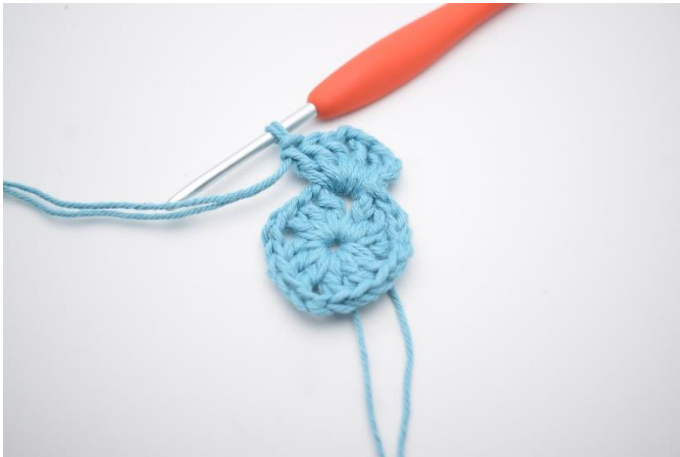
3. Lav 3 lm, hækl 2 stgm, 2 lm, 3 stgm og 1 lm i lm-buen.