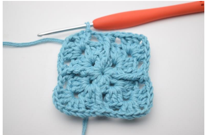
12. Afslut med 1 km.