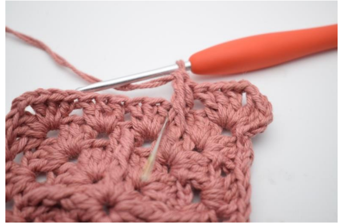
8. Hækl 1 stgm mere i samme mellemrum.