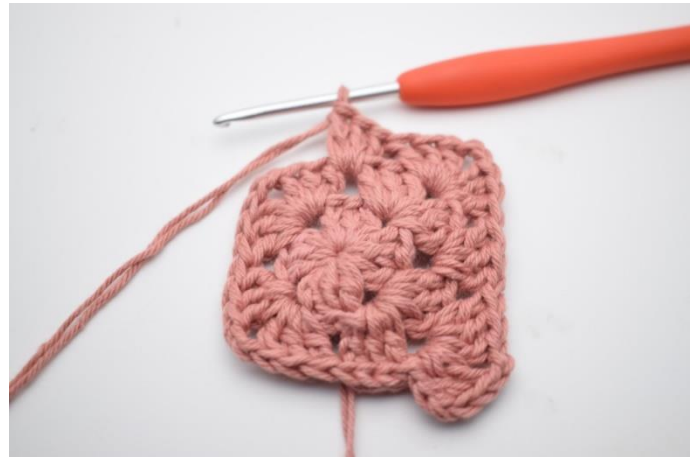
6. Hækl "3 stgm, 2 lm og 3 stgm i næste lm-bue. Hækl 3 stgm i næste mellemrum".