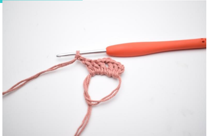
4. Hækl "3 stgm og 2 lm,".