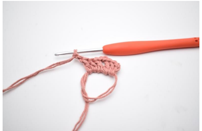
4. Hækl "3 stgm og 2 lm,".