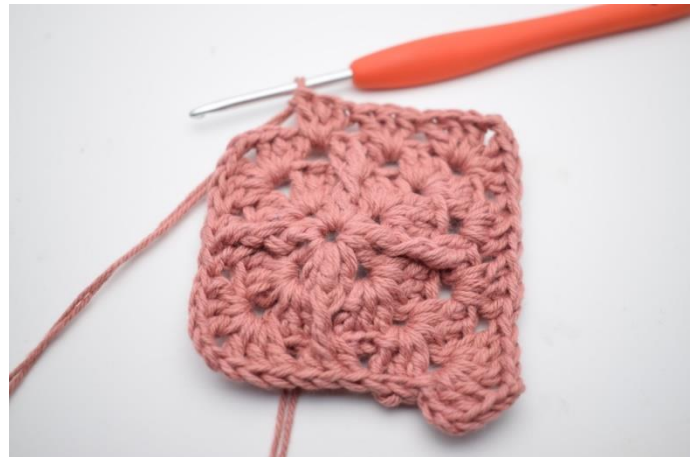
8. Hækl "3 stgm, 2 lm og 3 stgm i næste lm-bue. I de næste 2 mellemrum hækles 3 stgm i samme mellemrum".