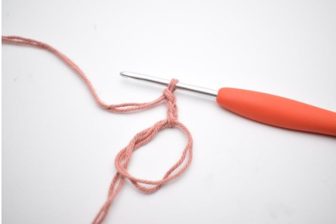
1. Lav en mr. Lav 3 lm,