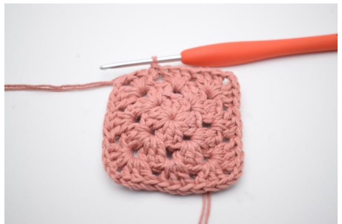
8. Afslut med 1 km.