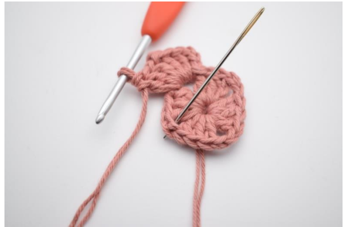
4. Hækl "3 stgm, 2 lm og 3 stgm i næste lm-bue".