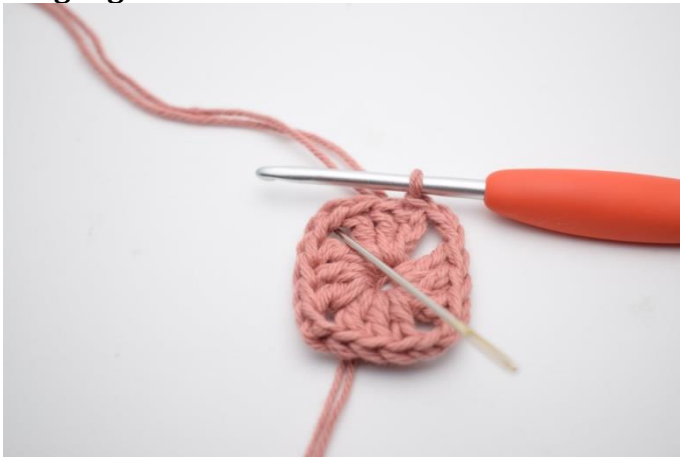
1. Lav km hen til lm-buen.