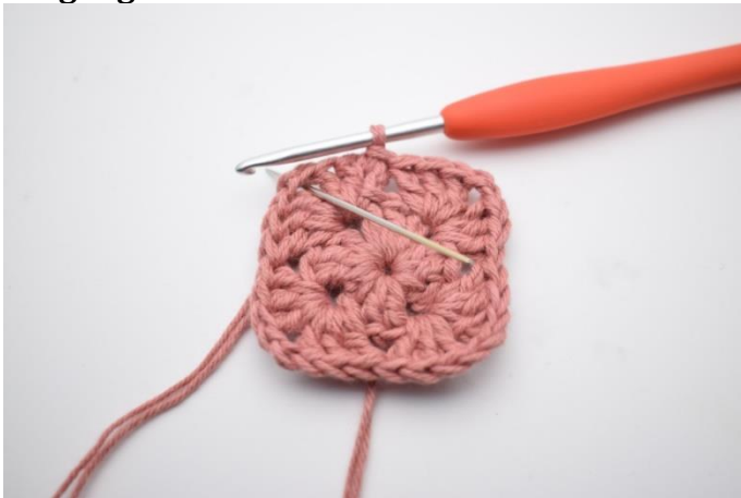
1. Lav km hen til lm-buen.