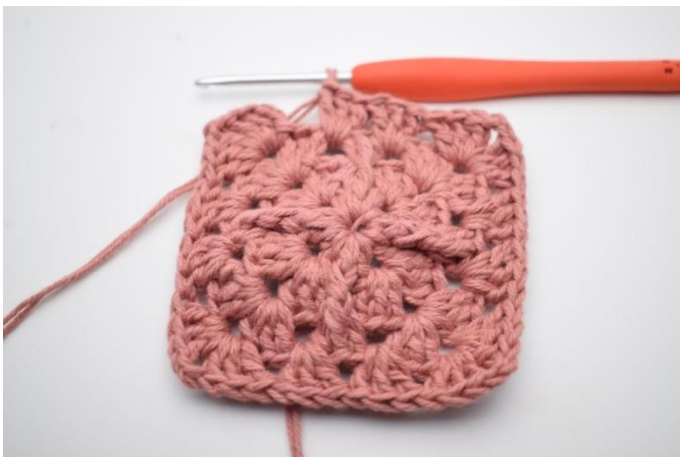
9. Gentag "til" i alt 3 gange.