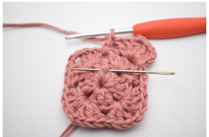
6. Nu skal der hækles 1 fr-dbstgm. Det er en alm. Dbstgm men som hækles forfra omkring stgm-stolpen i den midterste stgm fra omgang 1. Nålen her markerer den stolpe din fr-dbstgm skal hækles omkring.