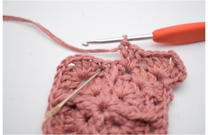
6. Hækl 3 stgm i næste mellemrum.