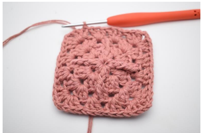
10. Afslut med 1 km.