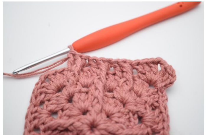
12. Gentag i det efterfølgende mellemrum.