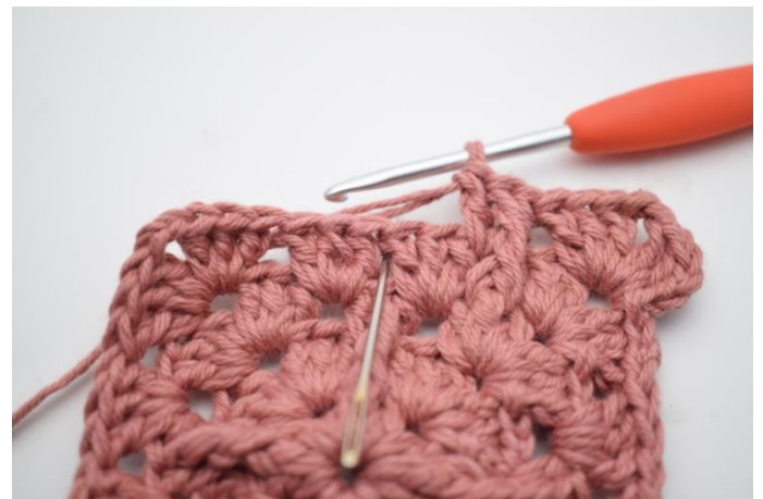
10. Gentag dette i næste mellemrum.