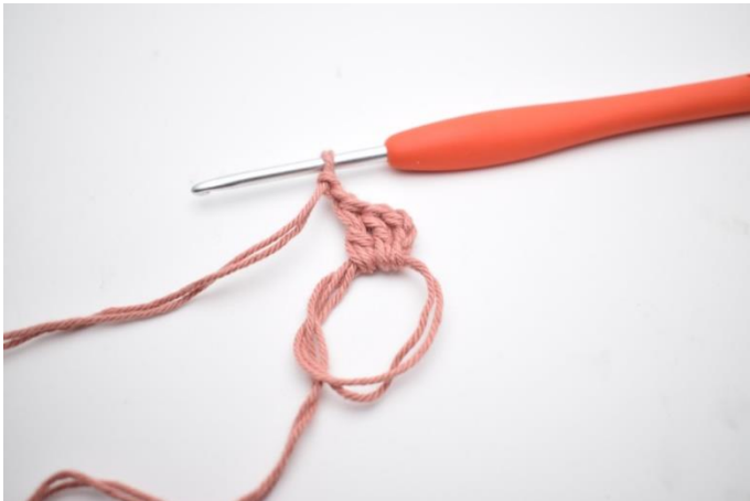
3. og lav 2 lm.