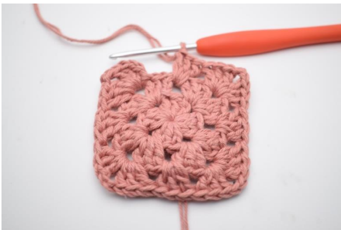
7. Gentag "til" i alt 3 gange.