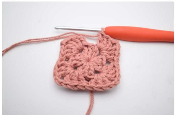
6. Gentag "til" i alt 3 gange.