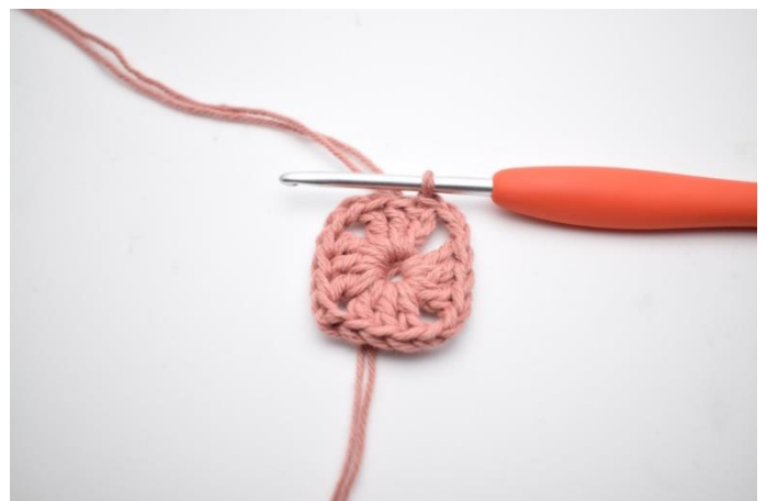
6. Afslut med 1 km.