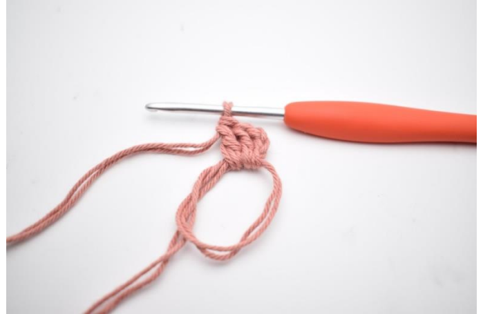
2. hækl 2 stgm,