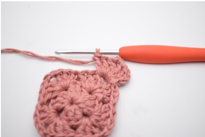
3. Lav 3 lm, hækl 2 stgm, 2 lm og 3 stgm i lm-buen.