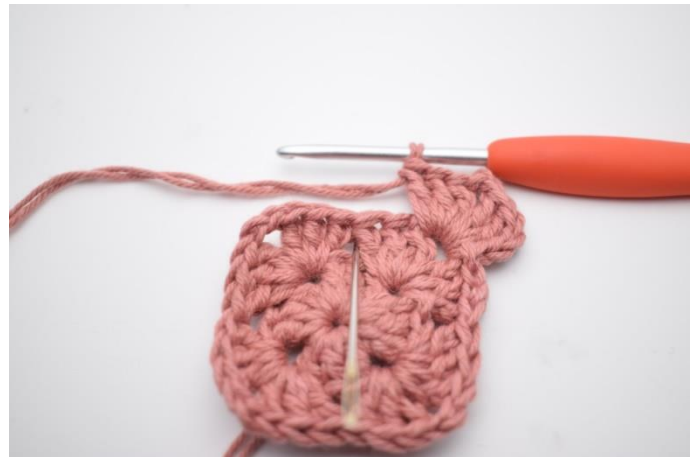
4. I næste mellemrum hækles 1 stgm, 1 fr-dbstgm omkring den midterste m i stgm-gruppen fra omgang 1, og 1 stgm.