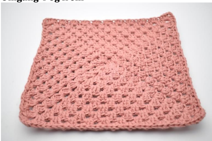
1. Gentag fremgangsmåden som beskrevet i opskriften. Vær opmærksom på at sidste omgang er hæklet i hstm i stedet for stgm.