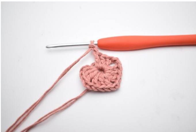
5. Gentag "til" i alt 3 gange.