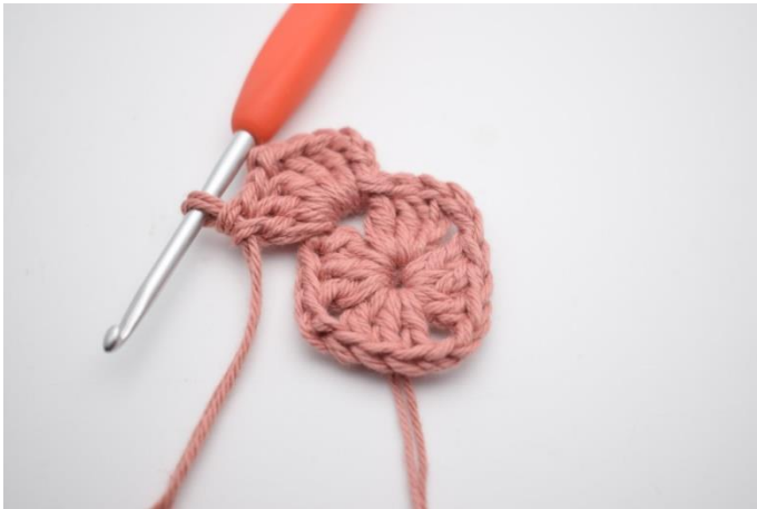
3. Lav 3 lm, hækl 2 stgm, 2 lm og 3 stgm i lm-buen.