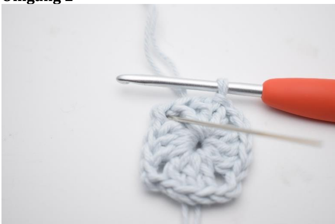
1. Lav km hen til lm-buen.