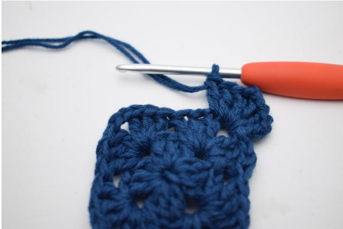
3. Lav 3 lm, hækl 2 stgm, 2 lm og 3 stgm i lm-buen.