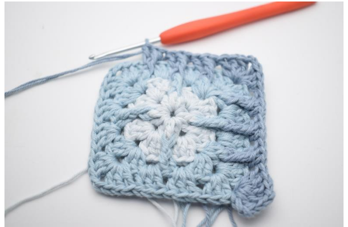
12. Hækl "3 stgm, 2 lm og 3 stgm i næste lm-bue. I de næste 3 mellemrum hækles 1 stgm, 1 frdbstgm omkring den midterste m i stgm-gruppen fra omgang 3 og 1 stgm".