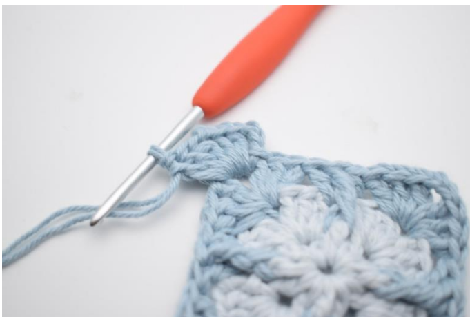
3. Lav 3 lm, hæk 2 stgm, 2 lm og 3 stgm i lm-buen.