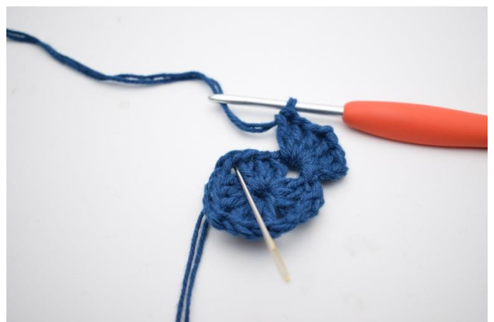
4. Hækl "3 stgm, 2 lm og 3 stgm i næste lm-bue".