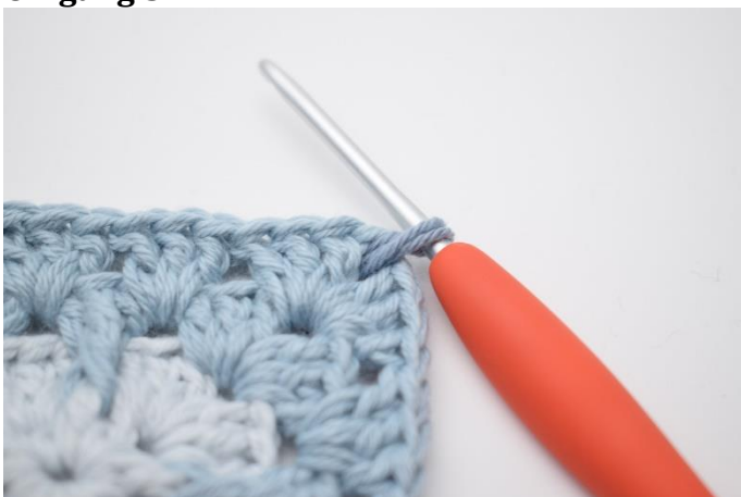
1. Indsæt farve C i en lm-bue.