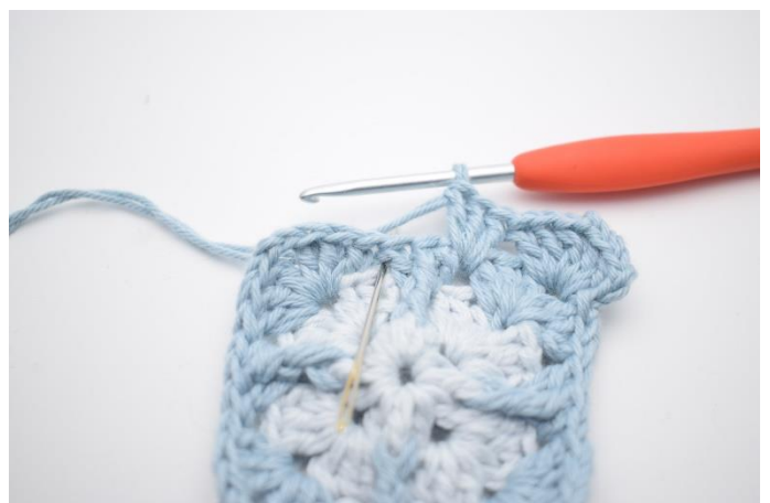
6. Hæk 3 stgm i næste mellemrum.