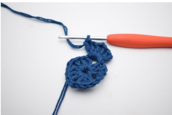
3. Lav 3 lm, hækl 2 stgm, 2 lm og 3 stgm i lm-buen.