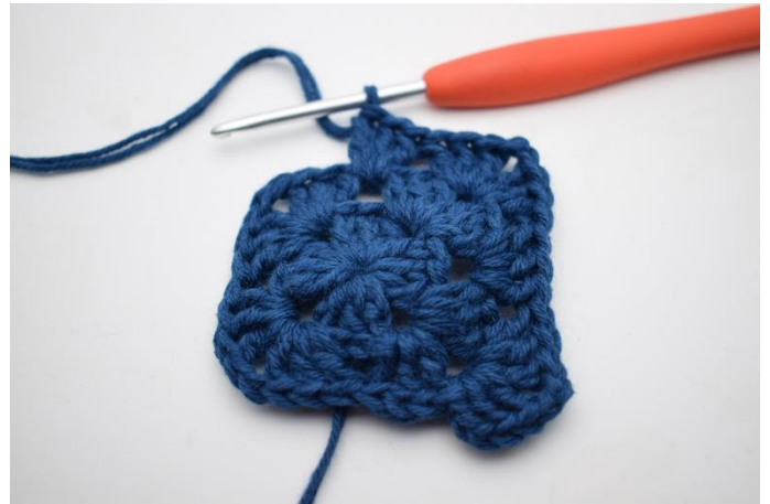
6. Hækl "3 stgm, 2 lm og 3 stgm i næste lm-bue. Hækl 3 stgm i næste mellemrum".