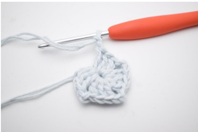
5. Gentag "til" i alt 3 gange.