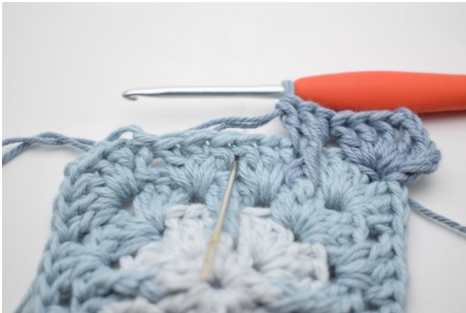
9. Gentag dette i næste mellemrum.