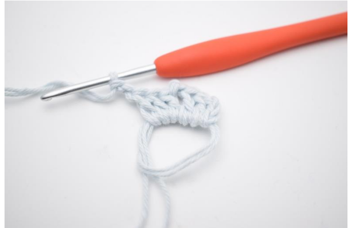
4. Hækl "3 stgm og 2 lm,".