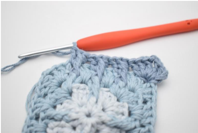
11. Gentag i det efterfølgende mellemrum.