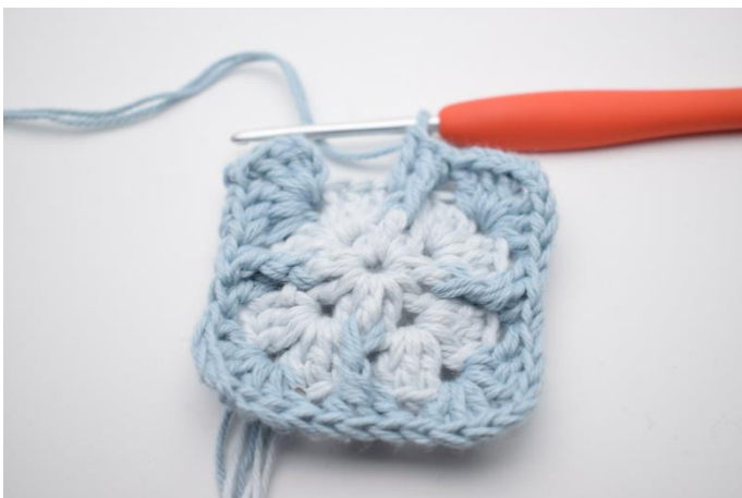
11. Gentag "til" i alt 3 gange.