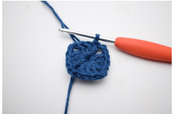
6. Afslut med 1 km.