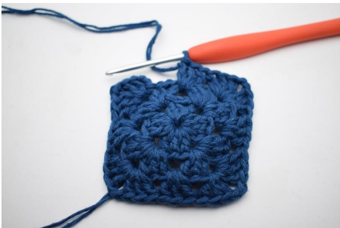
7. Gentag "til" i alt 3 gange.