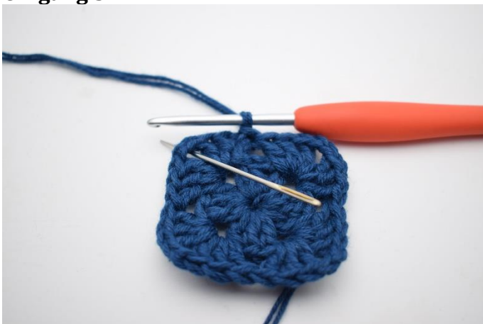
1. Lav km hen til lm-buen.