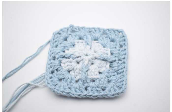
10. Afslut med 1 km. Klip garnet.