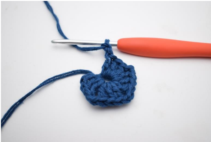
5. Gentag "til" i alt 3 gange.