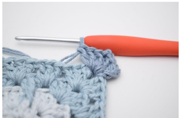
2. Lav 3 lm, hækl 2 stgm, 2 lm og 3 stgm i lm-buen.