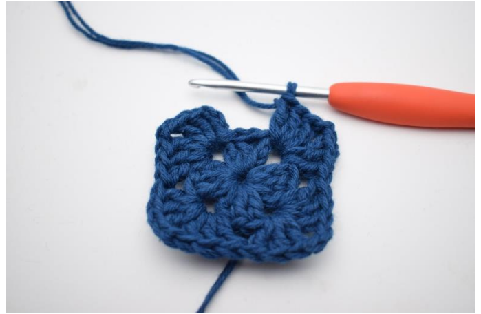
6. Gentag "til" i alt 3 gange.