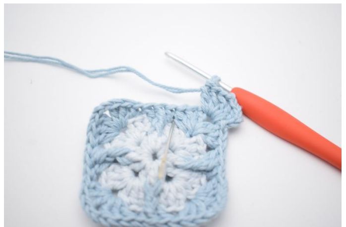
4. I næste mellemrum hækles 3 stgm.