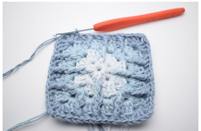
14. Afslut med 1 km.