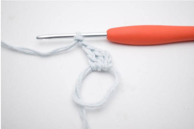
3. og lav 2 lm.