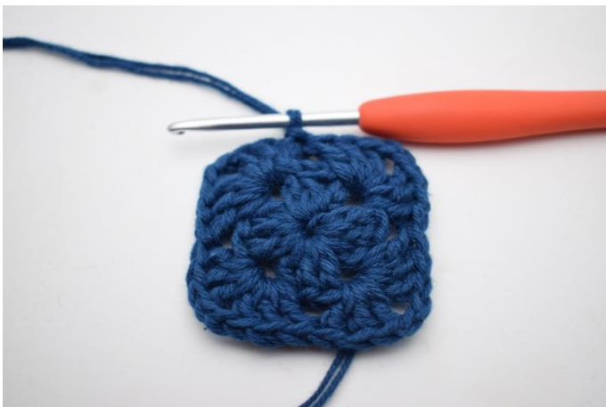
7. Afslut med 1 km.