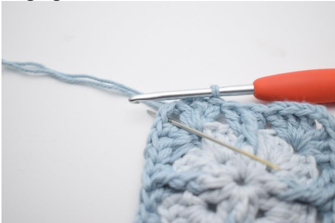
1. Lav km hen til lm-buen.