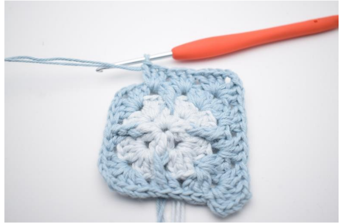
8. Hækl "3 stgm, 2 lm og 3 stgm i næste lm-bue. I de næste 2 mellemrum hækles 3 stgm i samme mellemrum".