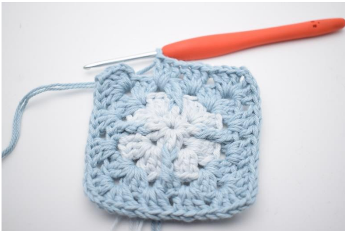
9. Gentag "til" i alt 3 gange.