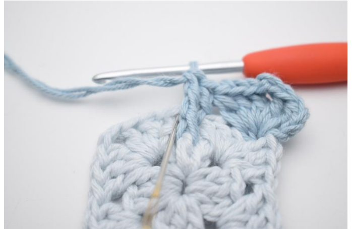
8. Hækl 1 stgm mere i samme mellemrum.