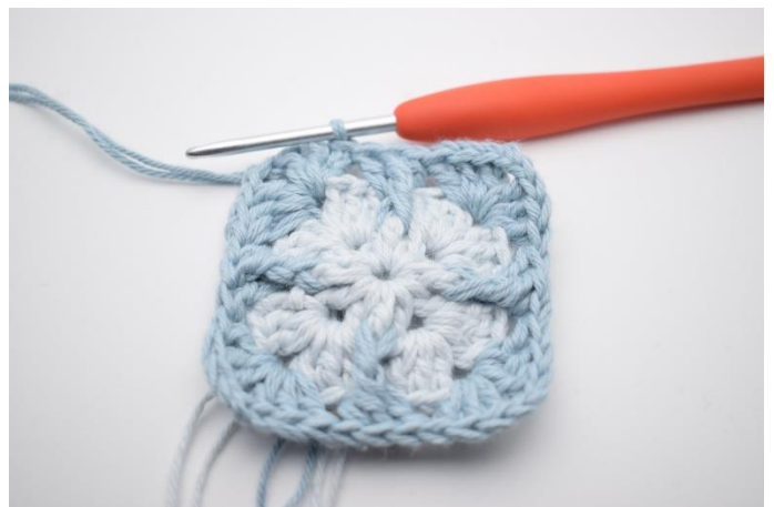
12. Afslut med 1 km.