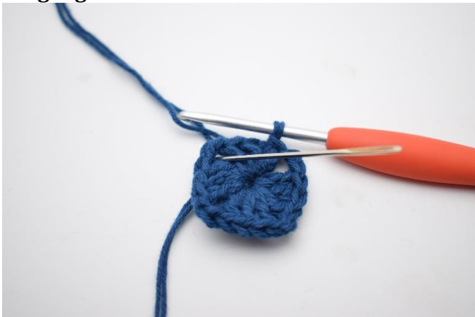
1. Lav km hen til lm-buen.