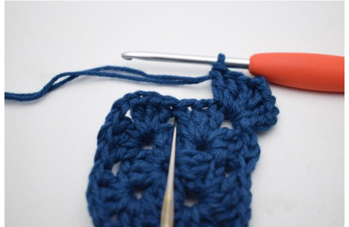
4. Hækl 3 stgm i næste mellemrum.