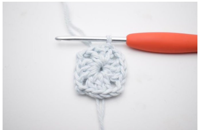
6. Afslut med 1 km.