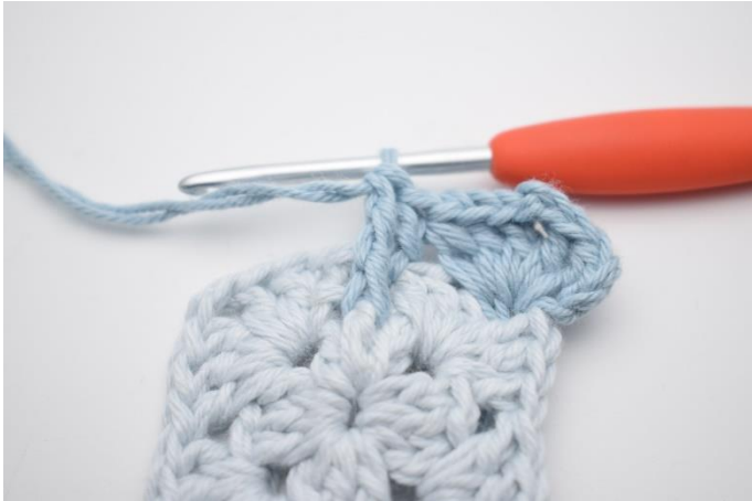
7. Hækl m færdig som en alm- dbstgm. Der er nu hæklet 1 fr-dbstgm.