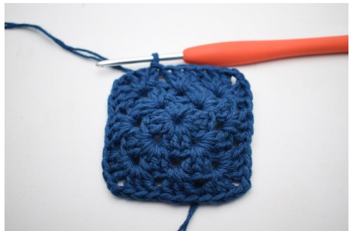
8. Afslut med 1 km.