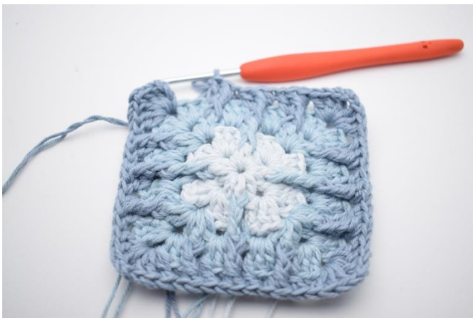
13. Gentag "til" i alt 3 gange.