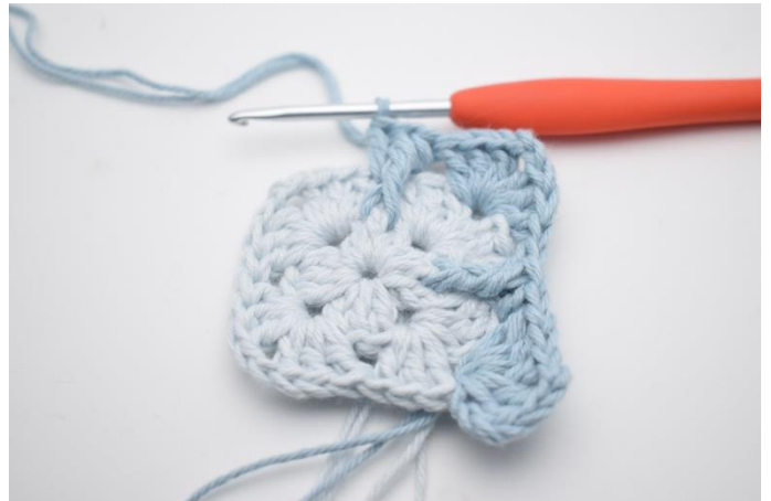
10. Hækl "3 stgm, 2 lm og 3 stgm i næste lm-bue. I næste mellemrum hækles 1 stgm, 1 fr-dbstgm omkring den midterste m i stgm-gruppen fra omgang 1 og 1 stgm".