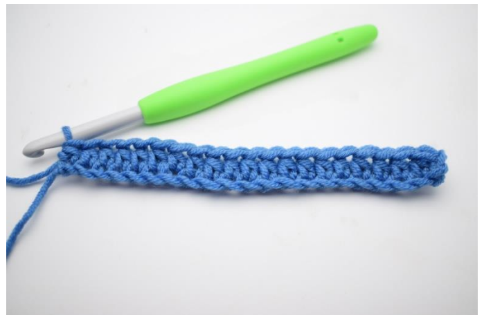
4. Hækl hstm rækken ud.