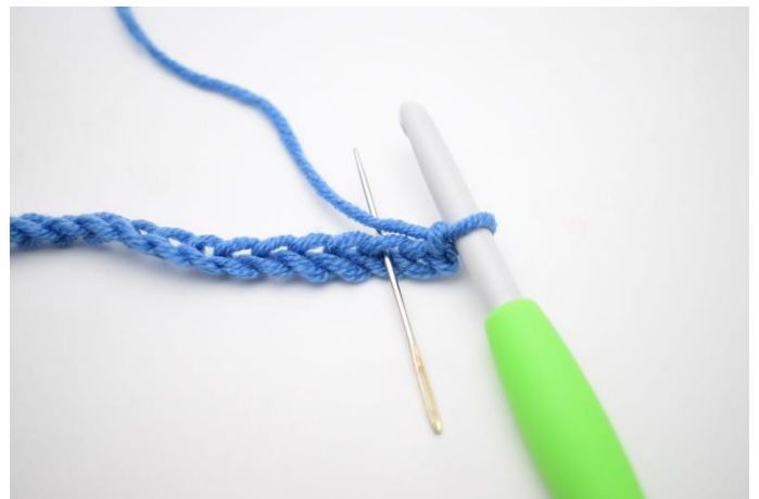
2. I 3. lm fra nålen hækles 1 hstm.