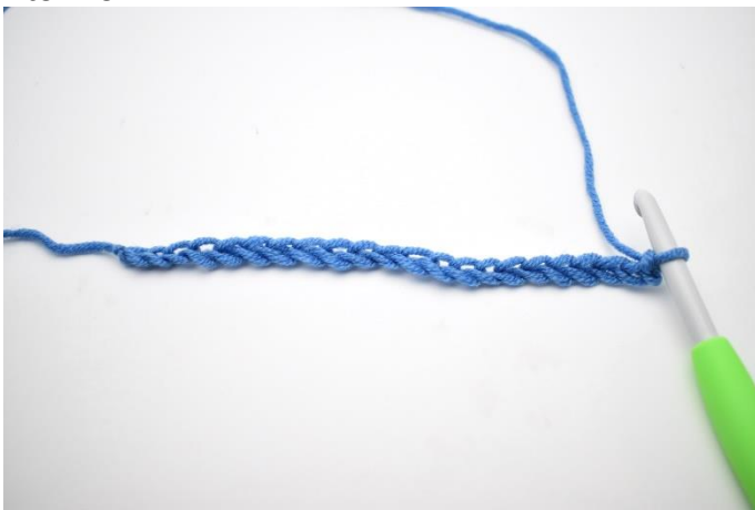
1. Start med at slå dine luftmasker op.