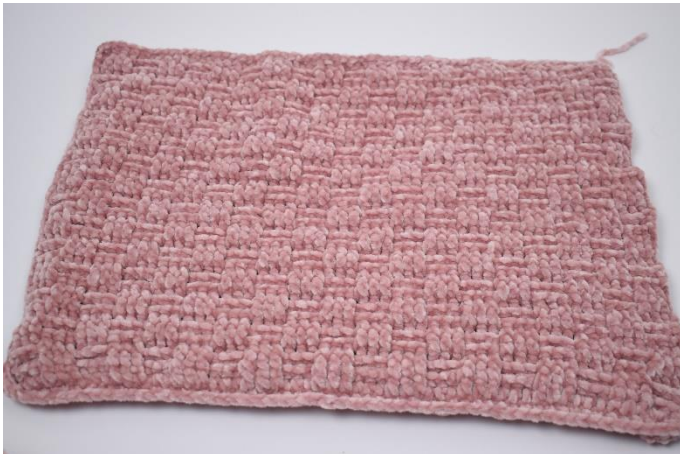
5. Hækl fm rundt om alle sider.