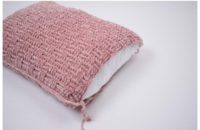
6. Kom puden i inden der lukkes helt til.