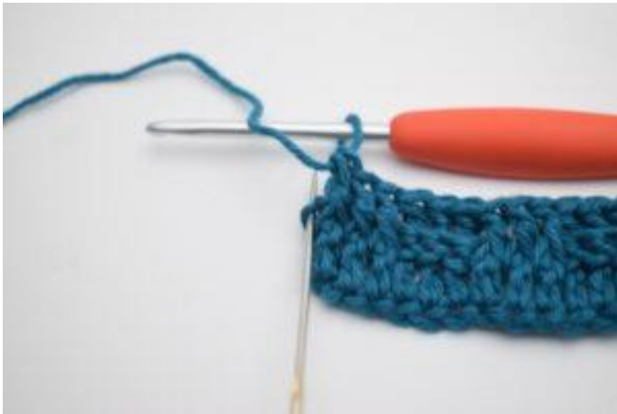
11. I sidste m hækles 1 alm. stgm.