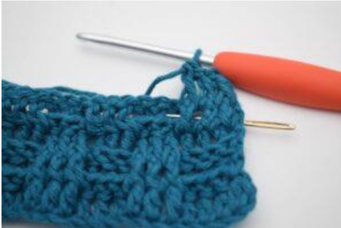
5. Hækl 1 brstgm omkring næste stgm-stolpe.