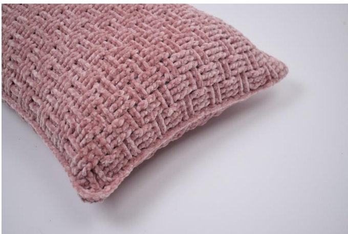
7. Klip garnet og hæft ender.