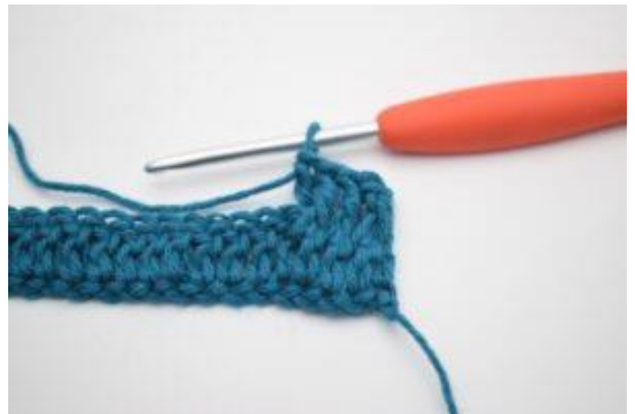
6. Sådan. Der er nu hæklet 1 brstgm.