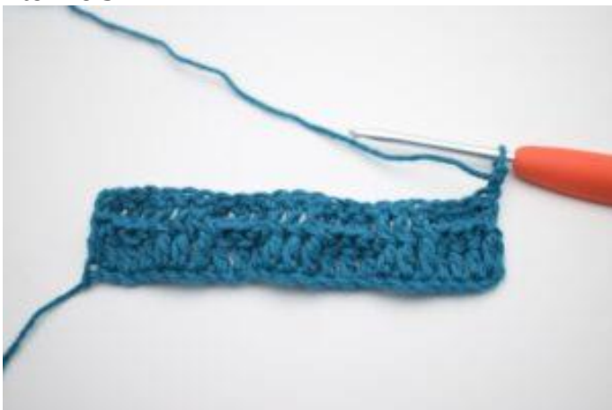
1. Vend med 2 lm.