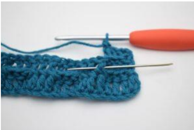
5. Hækl 1 frstgm omkring næste stgm-stolpe.