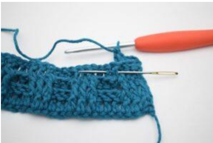
5. Hækl 1 frstgm omkring næste stgm-stolpe.