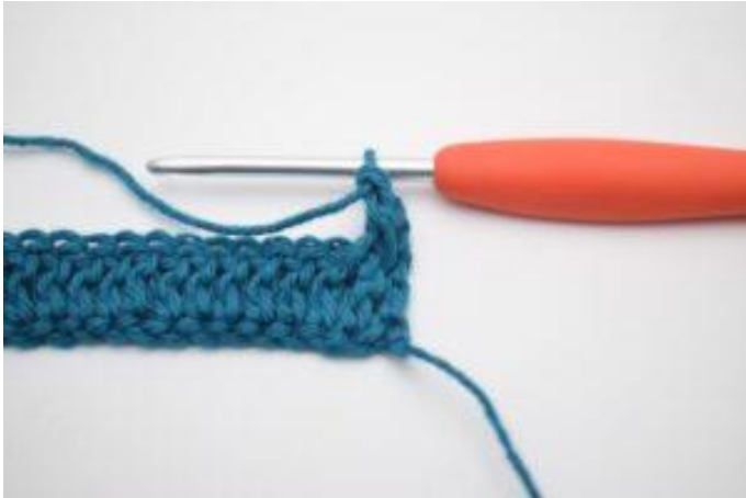
3. Sådan. Der er nu hæklet 1 frstgm.