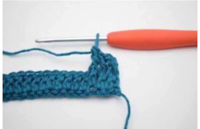
4. Hækl 1 frstgm omkring de næste 2 stgm-stolper.