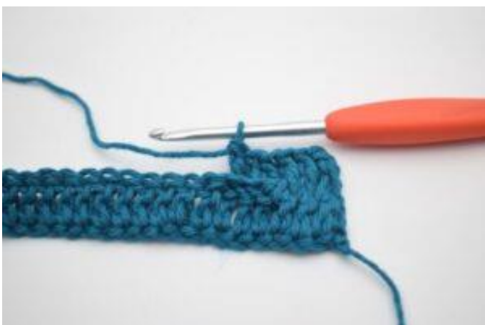
7. Hækl 1 brstgm omkring de næste 2 stgm-stolper.