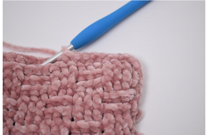
4. Hækl videre med fm.