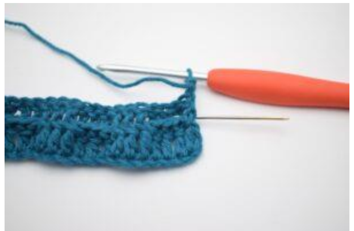
2. Hækl 1 brstgm omkring første stgm-stolpe.