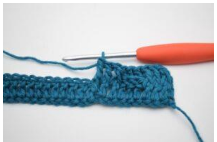
8. Hækl 1 frstgm omkring de næste 3 stgm-stolper.