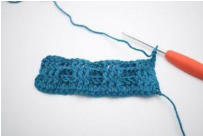
1. Vend med 2 lm.