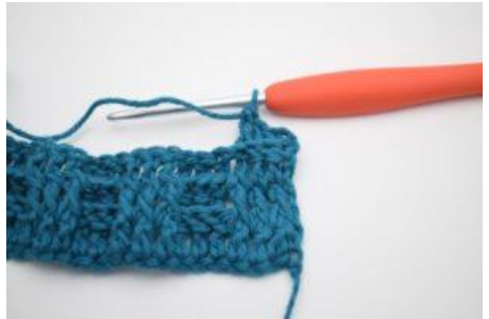
4. Hækl 1 frstgm omkring de næste 2 stgm-stolper.