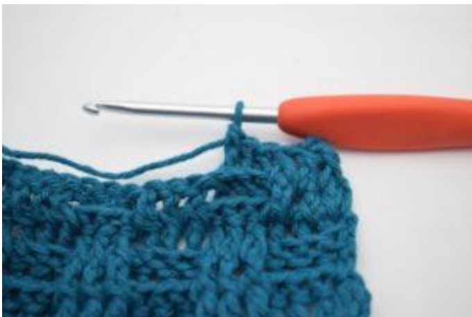
7. Hækl 1 brstgm omkring de næste 2 stgm-stolper.