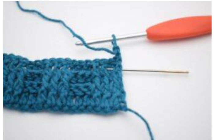
2. Hækl 1 brstgm omkring første stgm-stolpe.