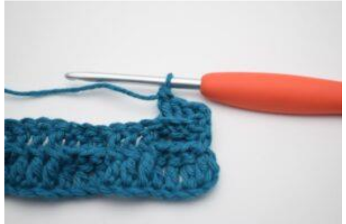
4. Hækl 1 brstgm omkring næste næste 2 stgm-stolper.