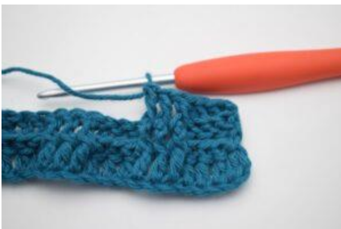
7. Hækl 1 frstgm omkring de næste 2 stgm-stolper.