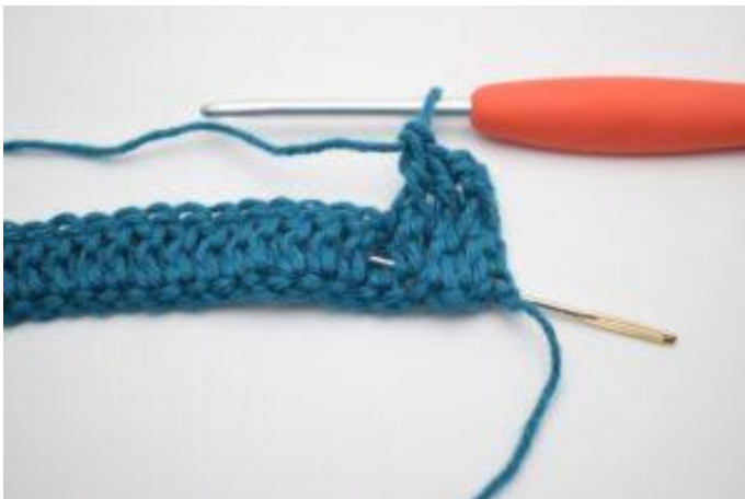
5. Hækl 1 brstgm. En brstgm er en stgm der hækles bagom stgm-stolpen fra forrige række. Nålen her markerer den stgm-stolpe din brstgm skal hækles omkring.