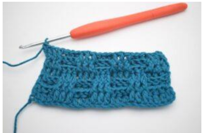
8. Gentag skiftevis 3 frstgm og 3 brstgm rækken ud. Rækken slutter med 3 frstgm. Hækl 1 alm. stgm i sidste m. Gentag række 2-5 som beskrevet i opskriften.

Har du spørgsmål til opskriften er du velkommen til at skrive til tine@hobbii.dk