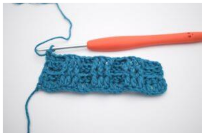
8. Gentag skiftevis med 3 brstgm og 3 frstgm rækken ud. Rækken slutter med 3 brstgm. I sidste m hækles 1 alm. stgm.