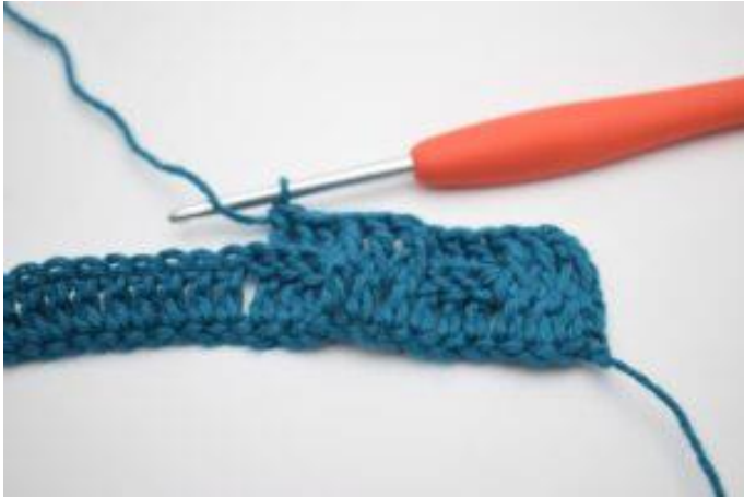
9. Hækl 1 brstgm omkring de næste 3 stgm-stolper.