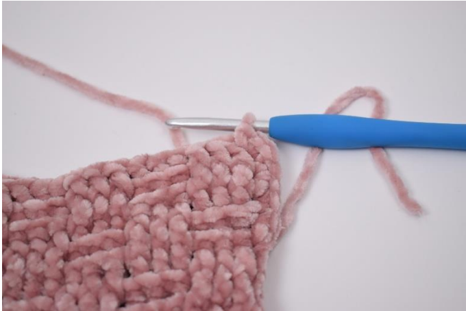
3. Hækl fm frem til hjørnet. I hjørnet hækles 3 fm.