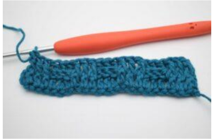
10. Gentag med skiftevis 3 frstgm og 3 brstgm rækken ud. Rækken ender med 3 frstgm.