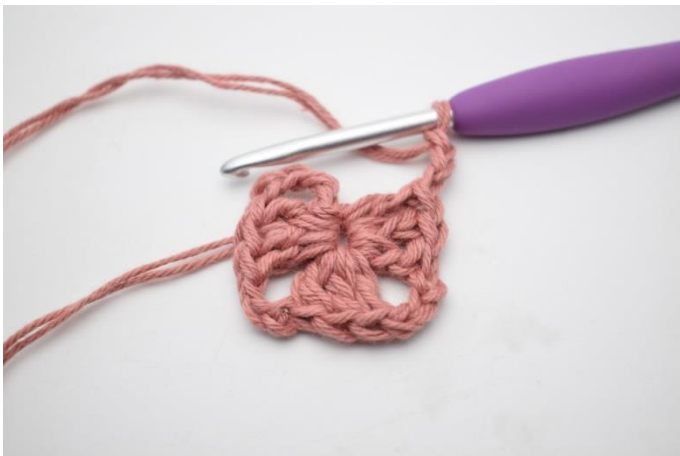
3. Gentag "til" i alt 3 gange.