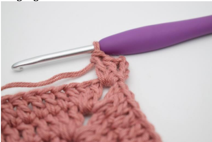
1. Lav 1 km i lm-buen. Lav 4 lm. Hækl 2 stgm i lm-buen.