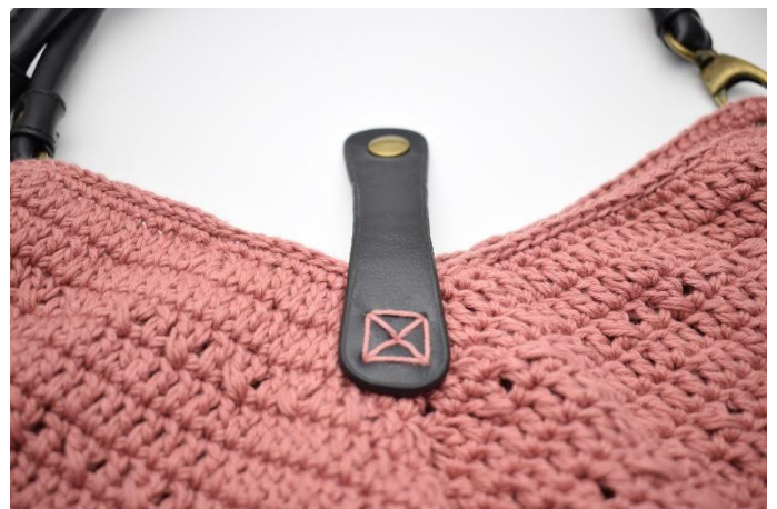
Sy "flappen fast på den ene side på midten.