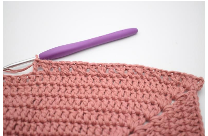
8. "Spring 1 m over og hækl 1 stgm. Hækl 1 stgm i m der er blevet sprunget over. Hækl 1 stgm i næste m". Gentag "til" 8 gange.