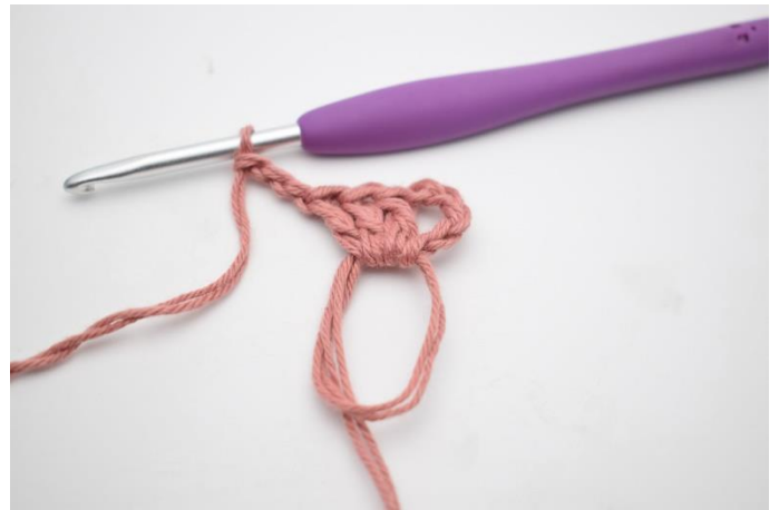
2. Hæk "3 stgm og 3 lm".