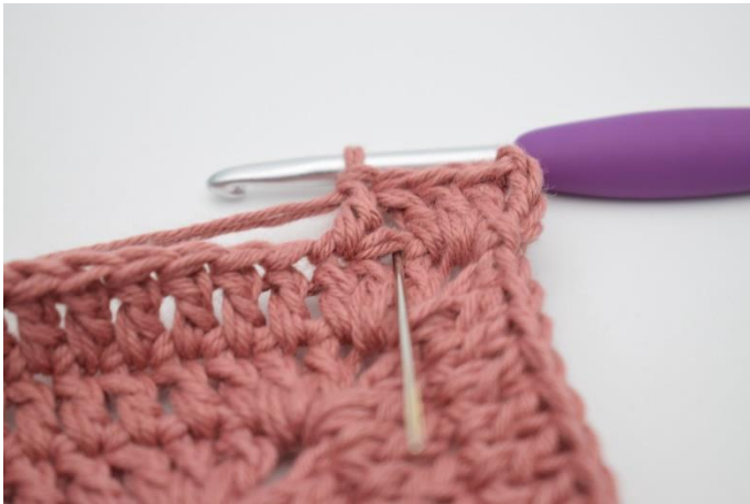
5. Hækl 1 stgm i m der netop er blevet sprunget over.