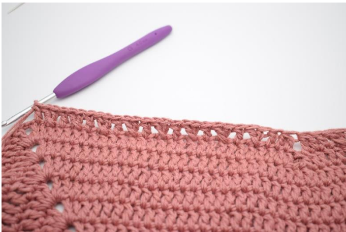
15."Spring 1 m over og hækl 1 stgm. Hækl 1 stgm i m der er blevet sprunget over. Hækl 1 stgm i næste m". Gentag "til" 8 gange.