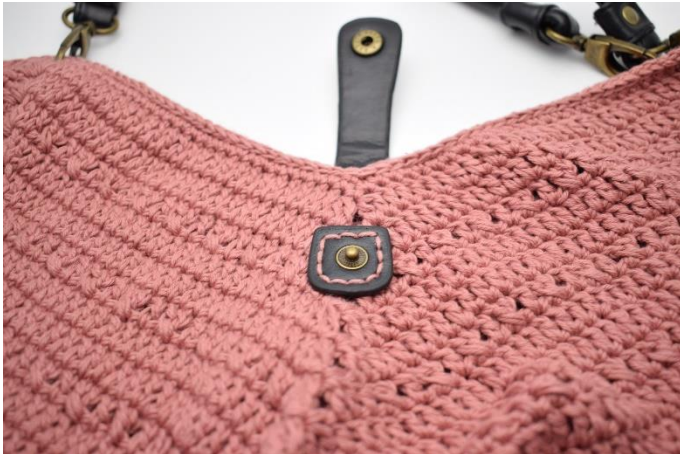
Sy den anden del af flappen fast på forsiden.