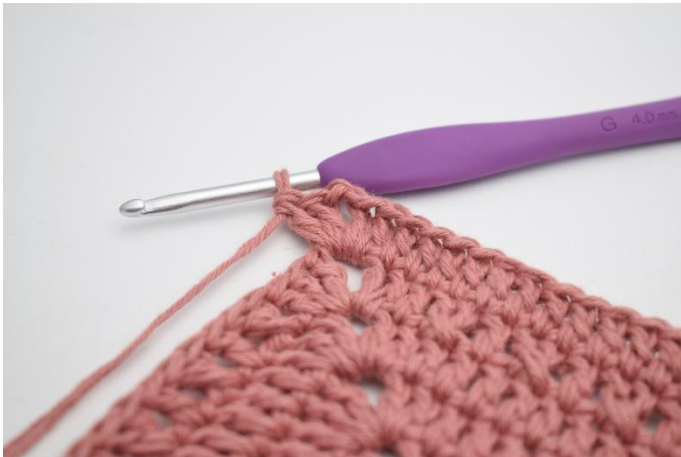
7. Hækl 2 stgm, 2 lm og 2 stgm i næste lm-bue.