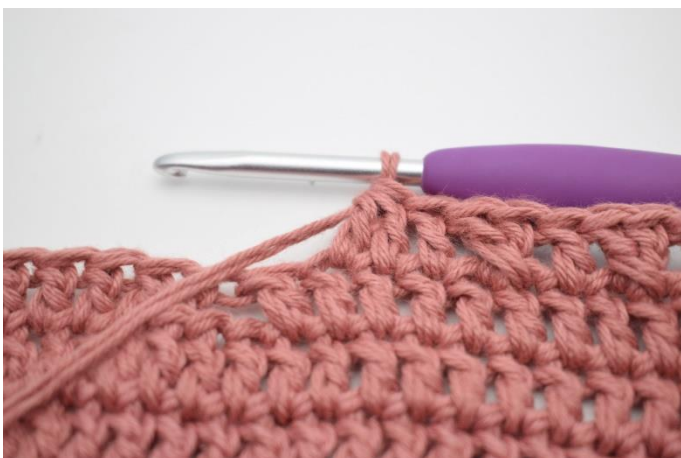
9. Hækl 2 stgm sm.