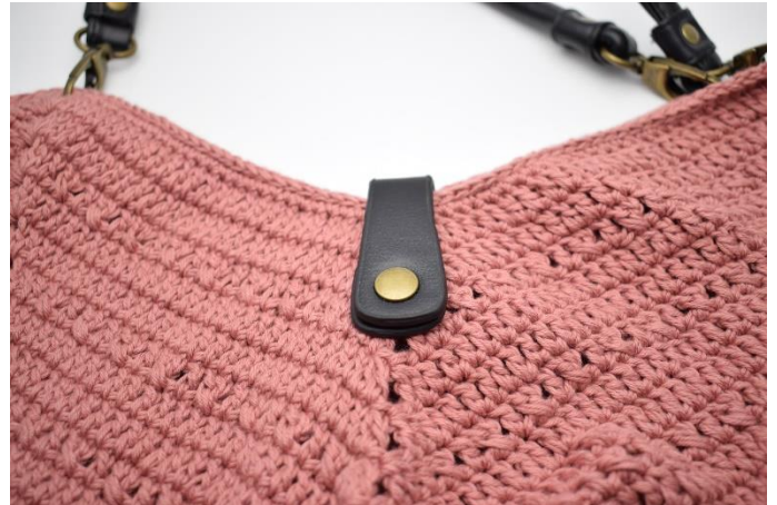
Tasken kan nu lukkes med knappen.