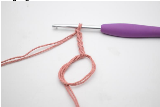
1. Lav en mr. Lav 5 lm.