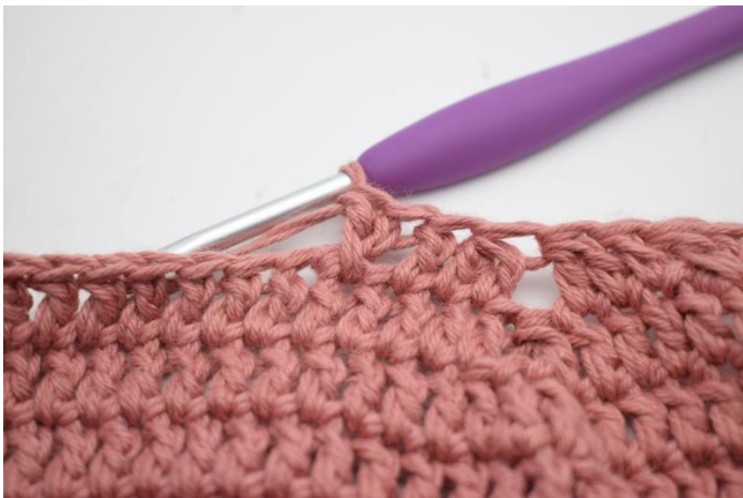
13. Spring 1 m over og hækl 1 stgm. Hækl 1 stgm i m der er blevet sprunget over.