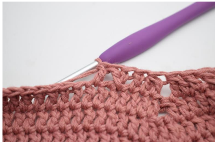
14. Hækl 1 stgm i næste m.