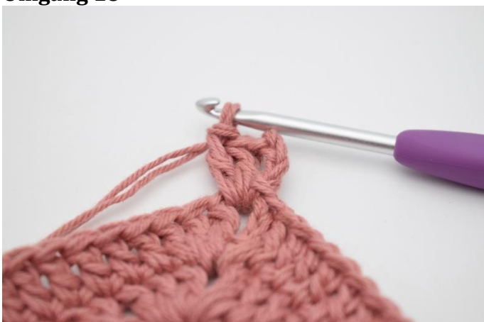
1. Lav 1 km i lm-buen. Lav 4 lm. Hækl 2 stgm i lm-buen.