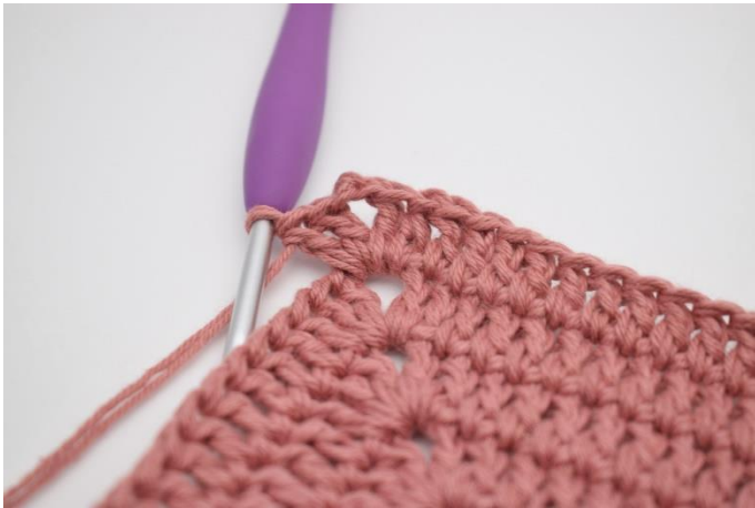
5. Hækl 2 stgm, 2 lm og 2 stgm i næste lm-bue”.