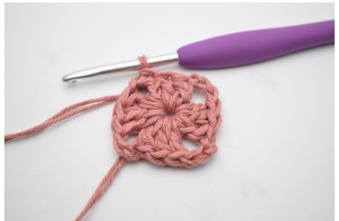
4. Hæk 2 stgm. Afslut med 1 km i 3. lm fra omgangens start.