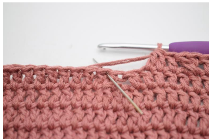
10. Spring 2 m over.