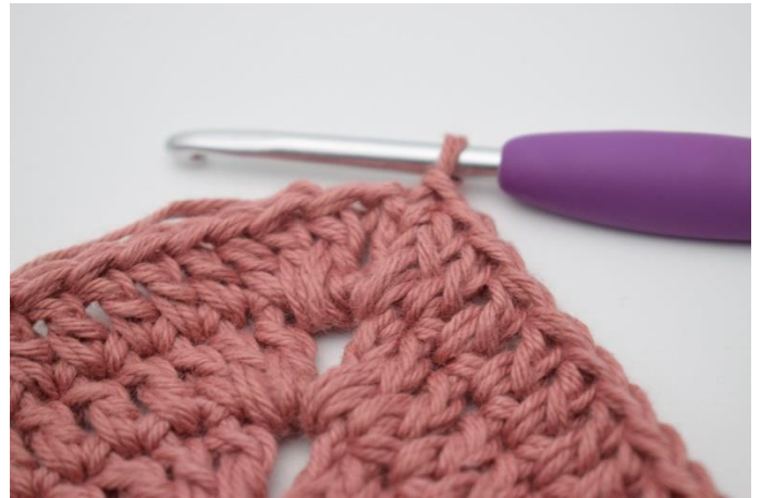
6. Gentag på alle 4 sider. Hækl 1 stgm i lm-buen fra omgangens start. Afslut med 1 km i 3. lm.