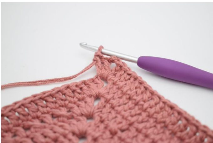
7. Hækl 2 stgm, 2 lm og 2 stgm i næste lm-bue.