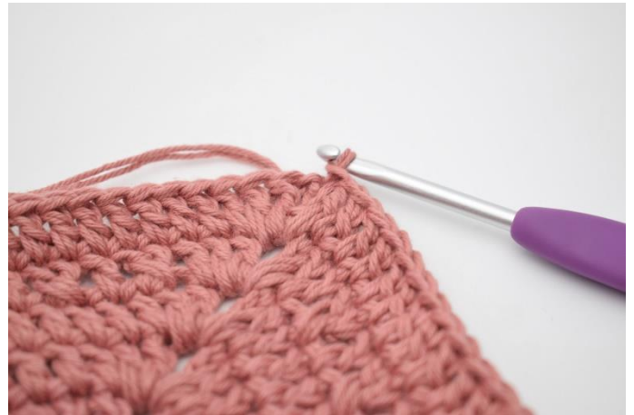
8. Gentag på alle 4 sider. Hækl 1 stgm i lm-buen fra omgangens start. Afslut med 1 km i 3. lm.