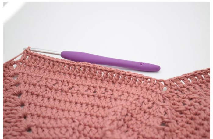
6. Hækl 1 stgm i de næste 25 m.