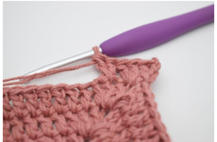
6. Sådan. Der er nu dannet et "kryds".