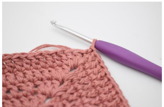
8. Gentag på alle 4 sider. Hækl 1 stgm i lm-buen fra omgangens start. Afslut med 1 km i 3. lm.