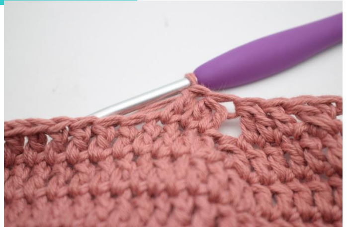
12. Hækl 1 stgm i næste m.