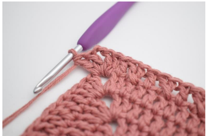
16. Hækl 2 stgm, 2 lm og 2 stgm i næste lm-bue)