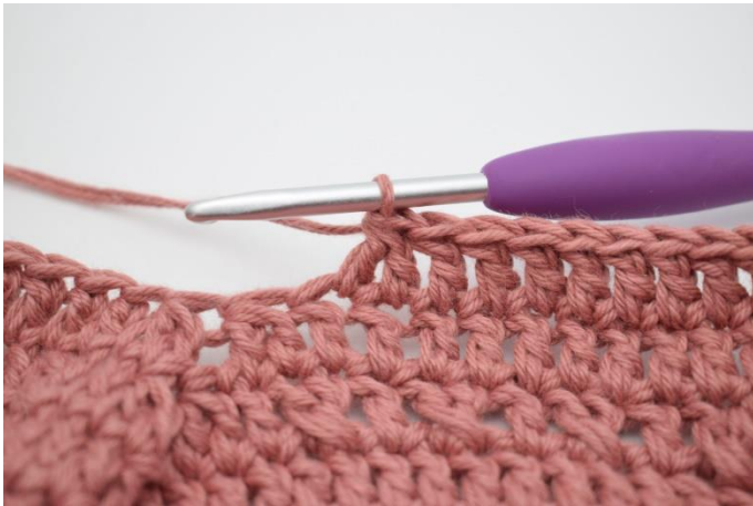
3. Hækl 2 stgm sm.