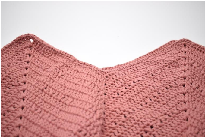
Klip garnet og hæft ender. Din taske er nu klar til at få monteret tilbehør.