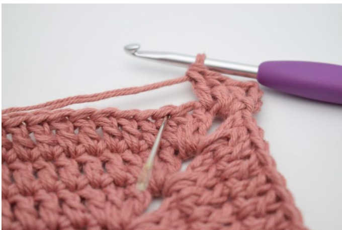
3. Spring 1 m over og hækl 1 stgm i næste m.