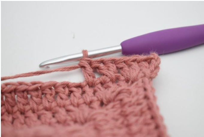
7. Hækl 1 stgm i næste m.