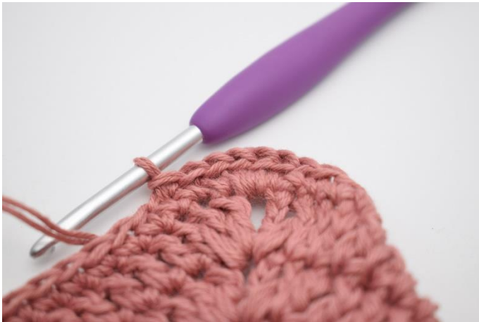
3. Hækl km omgangen rundt.