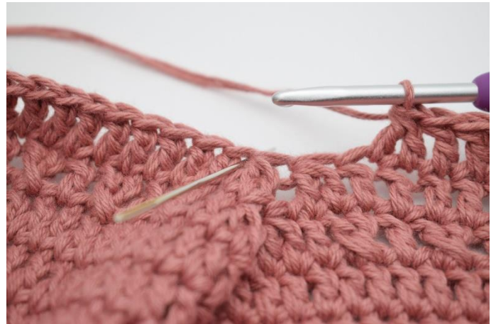
4. Spring 2 m over og hækl 2 stgm sm.