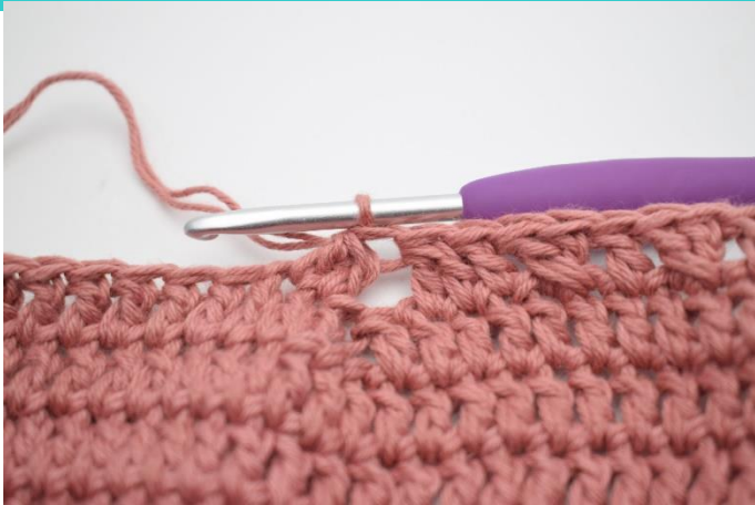
11. Hækl 2 stgm sm.