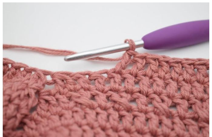
2. Hækl 1 stgm i de næste 25 m.