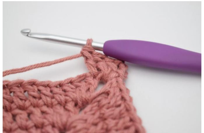
2. Hækl 1 stgm i første m.