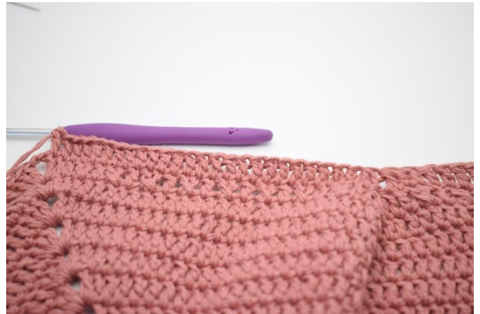
6. Hækl 1 stgm i de næste 25 m.