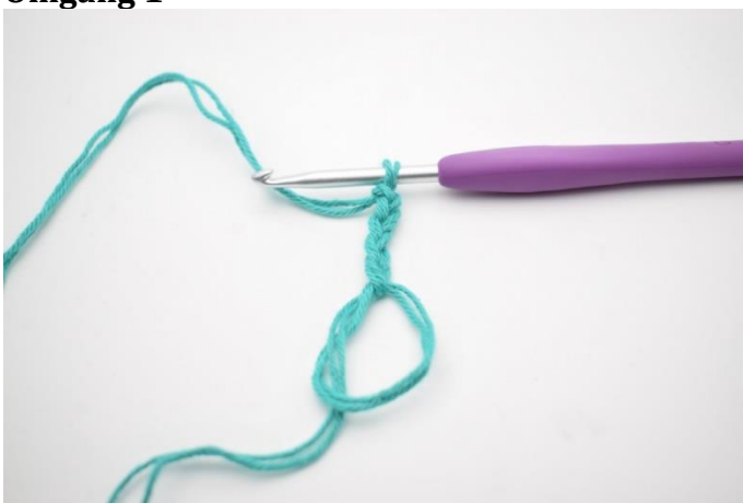
1. Med farve A. Lav en mr. Lav 5 lm.