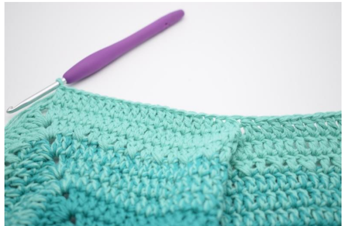
6. Hækl 1 stgm i de næste 19 m.