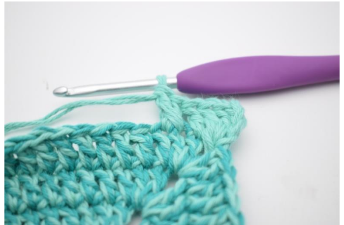
6. Sådan. Der er nu dannet et "kryds".