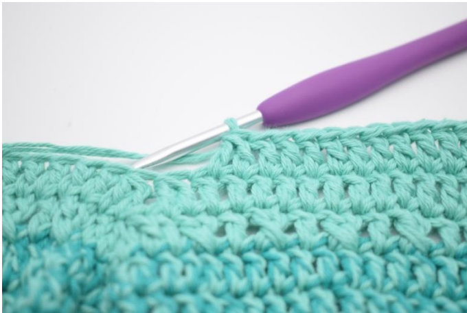
3. Hækl 2 stgm sm.