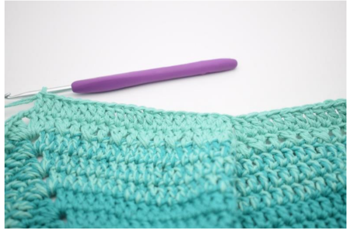
6. Hækl 1 stgm i de næste 19 m.