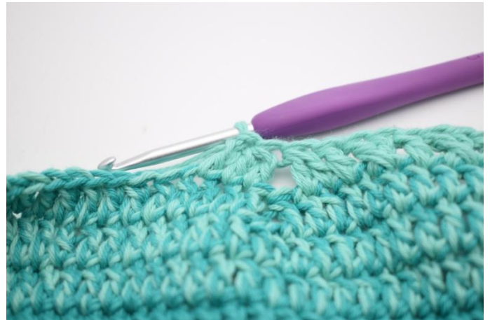
12. Hækl 1 stgm i næste m.