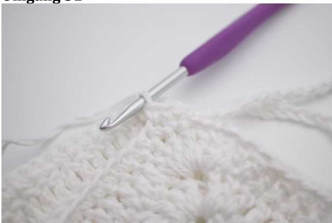
1. Lav 1 lm.