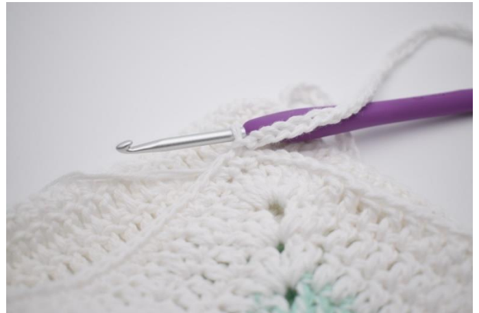
8. Afslut med 1 km i lm fra omgangens start.