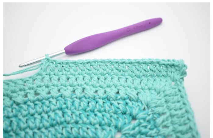
2. Hækl 1 stgm i de næste 19 m.