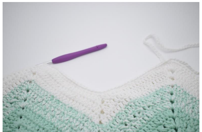
6. Hækl fm i de næste 46 m.