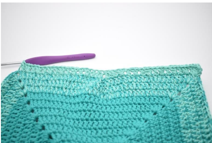
15."Spring 1 m over og hækl 1 stgm. Hækl 1 stgm i m der er blevet sprunget over. Hækl 1 stgm i næste m". Gentag "til" 6 gange.