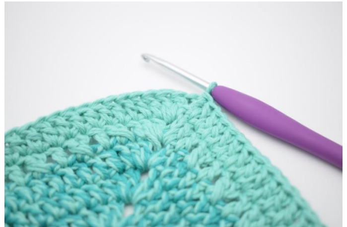
8. Gentag på alle 4 sider. Hækl 1 stgm i lm-buen fra omgangens start. Afslut med 1 km i 3. lm.