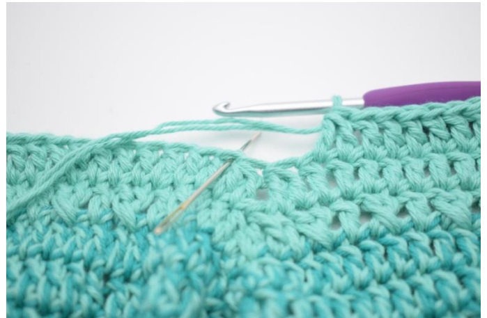
4. Spring 2 m over og hækl 2 stgm sm.