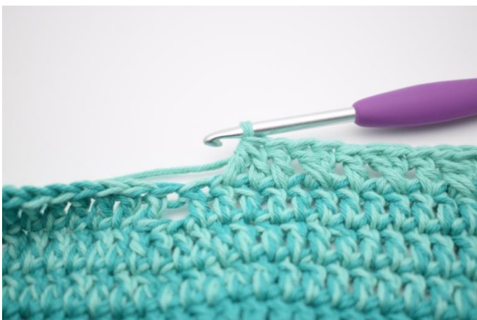
9. Hækl 2 stgm sm.