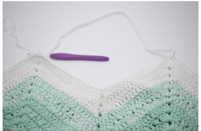
4. Lav 70 lm og spring over til næste "spids". I den 4. stgm af de 6 stgm i lm-buen hækles 1 fm.