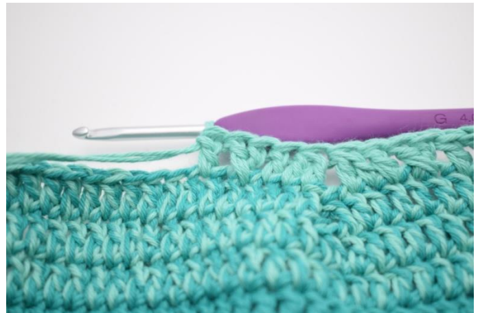
14. Hækl 1 stgm i næste m.