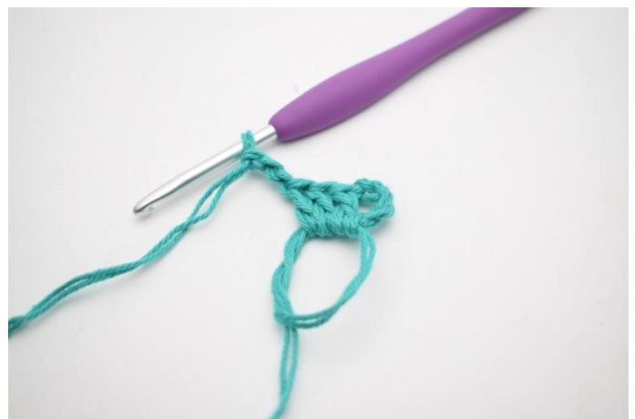
2. Hækl "3 stgm og 3 lm".