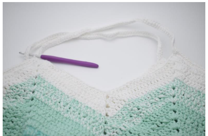
2. Hækl fm i alle masker og luftmasker omgangen rundt. Afslut med 1 km.