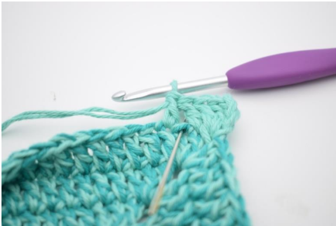
5. Hækl 1 stgm i m der netop er blevet sprunget over.