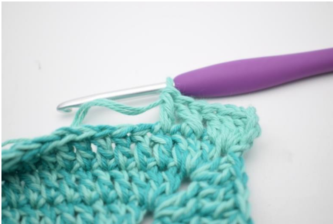
7. Hækl 1 stgm i næste m.