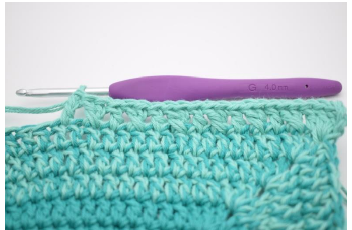
8. "Spring 1 m over og hækl 1 stgm. Hækl 1 stgm i m der er blevet sprunget over. Hækl 1 stgm i næste m". Gentag "til" 6 gange.