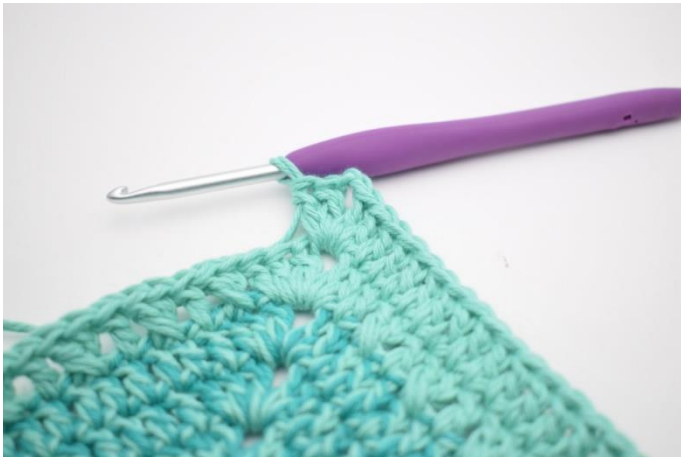
7. Hækl 2 stgm, 2 lm og 2 stgm i næste lm-bue.