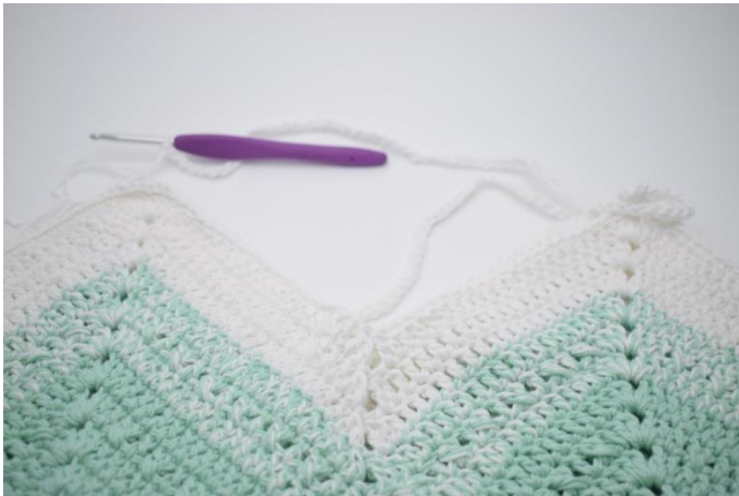
7. Lav 70 lm og spring over til næste "spids".