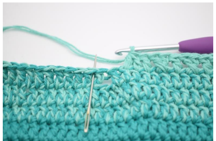
10. Spring 2 m over.