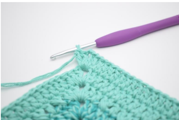
7. Hækl 2 stgm, 2 lm og 2 stgm i næste lm-bue.