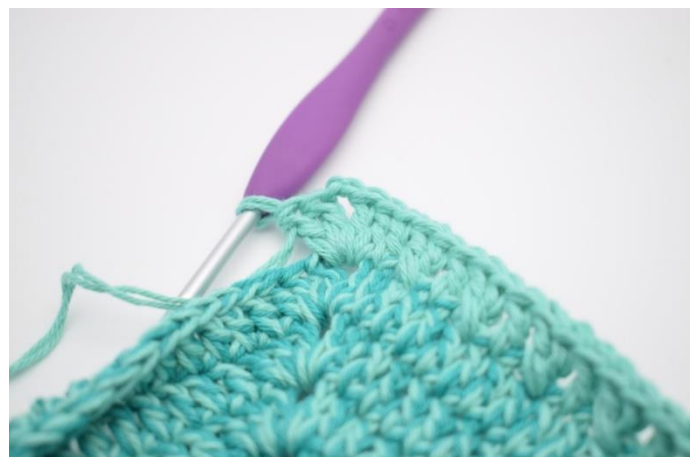
16. Hækl 2 stgm, 2 lm og 2 stgm i næste lm-bue)