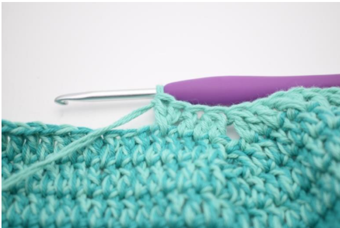
13. Spring 1 m over og hækl 1 stgm. Hækl 1 stgm i m der er blevet sprunget over.