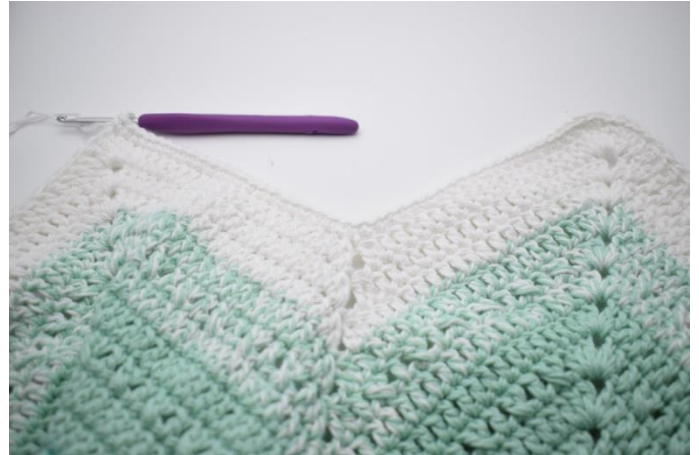
2. Lav 1 lm. Hækl fm i de næste 47 m.