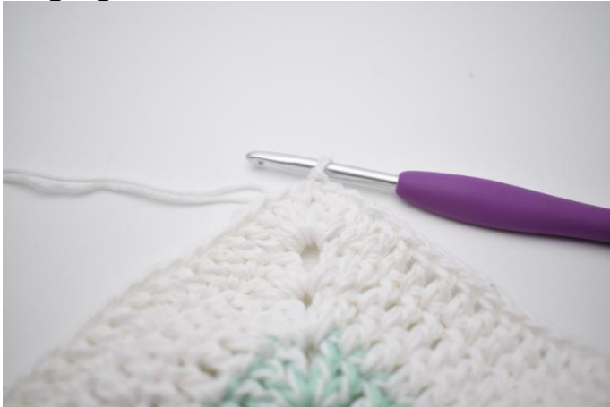
1. Lav km i de 3 næste m.