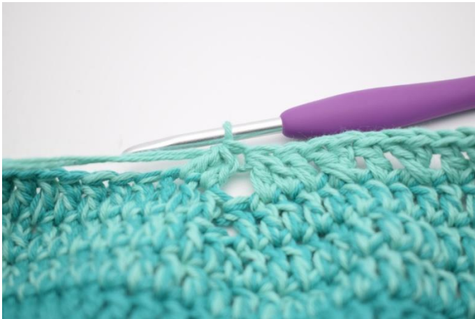
11. Hækl 2 stgm sm.