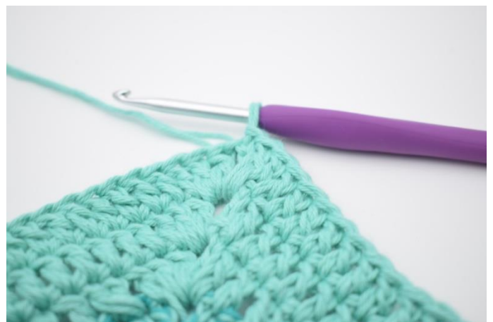
8. Gentag på alle 4 sider. Hækl 1 stgm i lm-buen fra omgangens start. Afslut med 1 km i 3. lm.