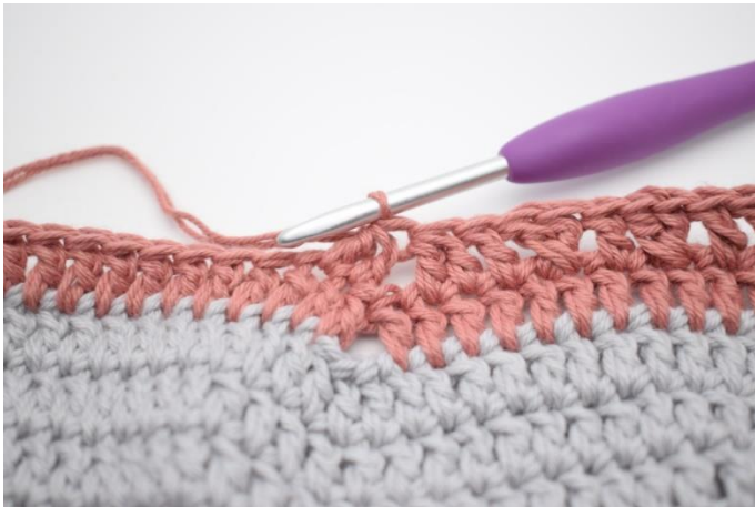
11. Hækl 2 stgm sm.