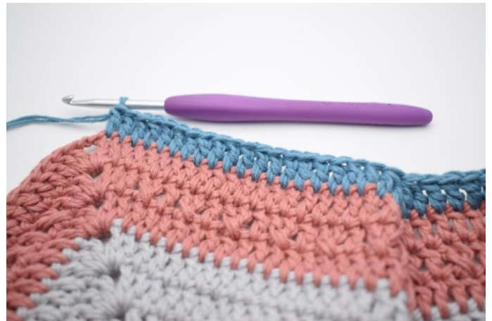
6. Hækl 1 stgm i de næste 19 m.