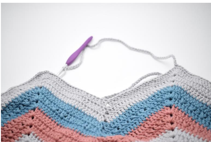
7. Lav 70 lm og spring over til næste "spids".