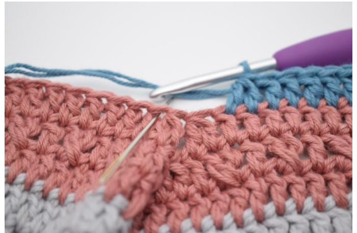
4. Spring 2 m over og hækl 2 stgm sm.