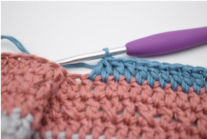
3. Hækl 2 stgm sm.