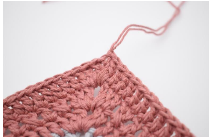
8. Gentag på alle 4 sider. Hækl 1 stgm i lm-buen fra omgangens start. Afslut med 1 km i 3. lm. Klip garnet.