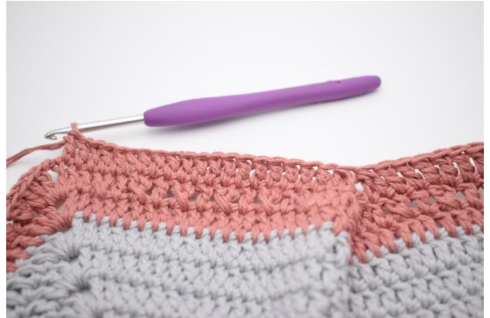
6. Hækl 1 stgm i de næste 19 m.