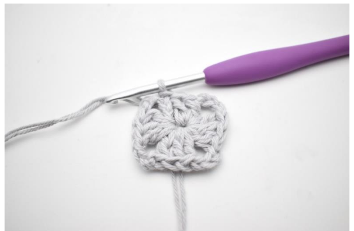
4. Hækl 2 stgm. Afslut med 1 km i 3. lm fra omgangens start.