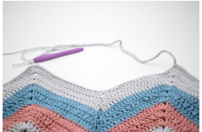
4. Lav 70 lm og spring over til næste "spids". I den 4. stgm af de 6 stgm i lm-buen hækles 1 fm.