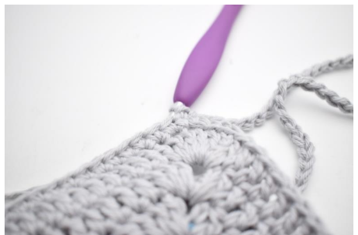
8. Afslut med 1 km i lm fra omgangens start.