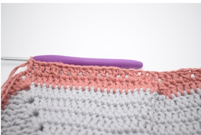
15."Spring 1 m over og hækl 1 stgm. Hækl 1 stgm i m der er blevet sprunget over. Hækl 1 stgm i næste m". Gentag "til" 6 gange.