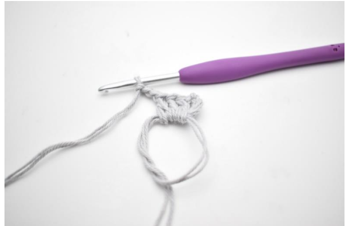
2. Hækl "3 stgm og 3 lm".