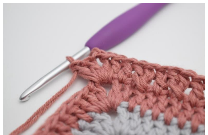
16. Hækl 2 stgm, 2 lm og 2 stgm i næste lm-bue)