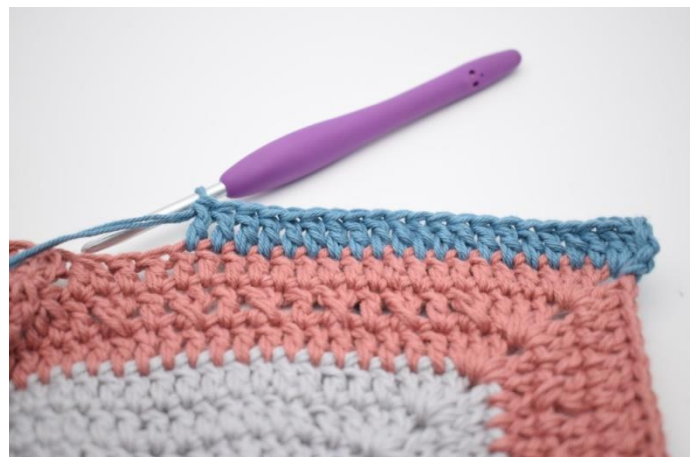
2. Hækl 1 stgm i de næste 19 m.