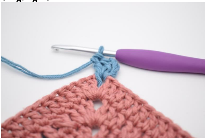
1. Indsæt farve C i en lm-bue. Lav 4 lm. Hækl 2 stgm i lm-buen.