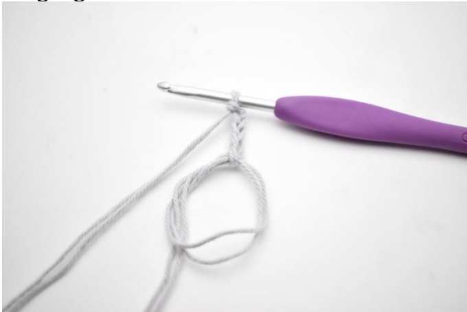
1. Med farve A. Lav en mr. Lav 5 lm.