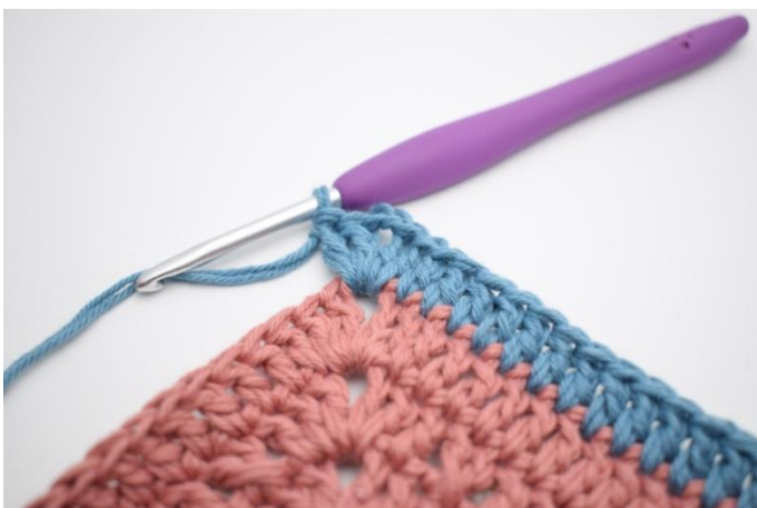
7. Hækl 2 stgm, 2 lm og 2 stgm i næste lm-bue.