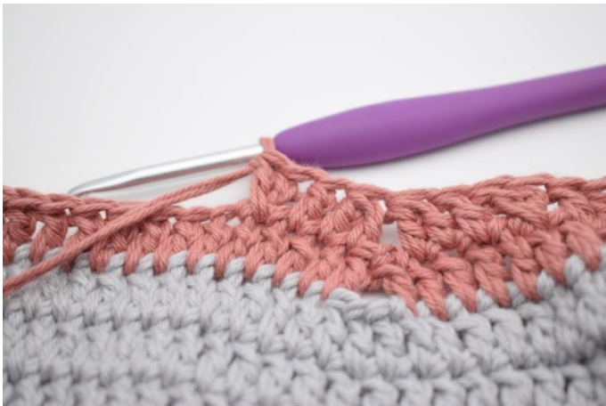
13. Spring 1 m over og hækl 1 stgm. Hækl 1 stgm i m der er blevet sprunget over.