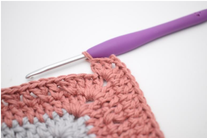
7. Hækl 2 stgm, 2 lm og 2 stgm i næste lm-bue.