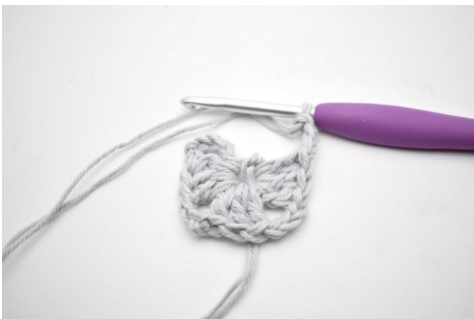
3. Gentag "til" i alt 3 gange.