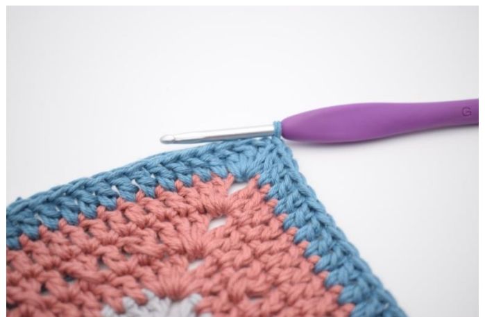
8. Gentag på alle 4 sider. Hækl 1 stgm i lm-buen fra omgangens start. Afslut med 1 km i 3. lm.