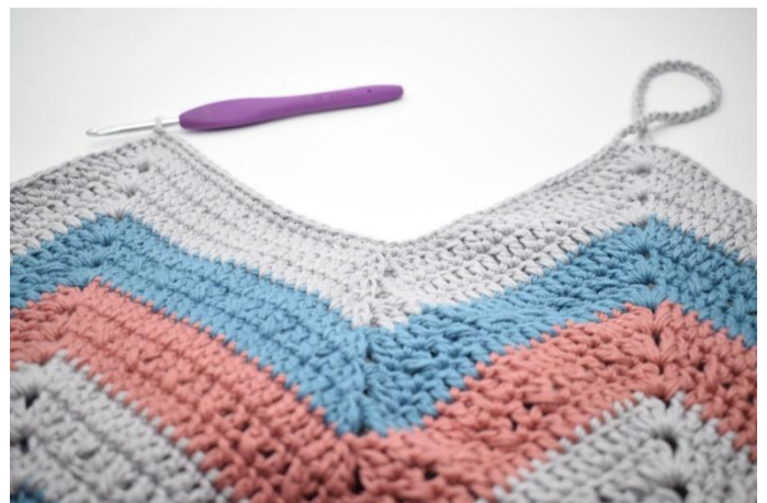
6. Hækl fm i de næste 46 m.