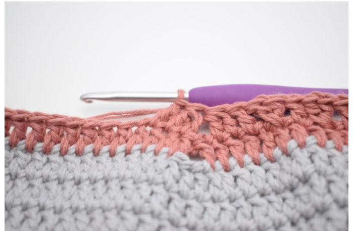
12. Hækl 1 stgm i næste m.