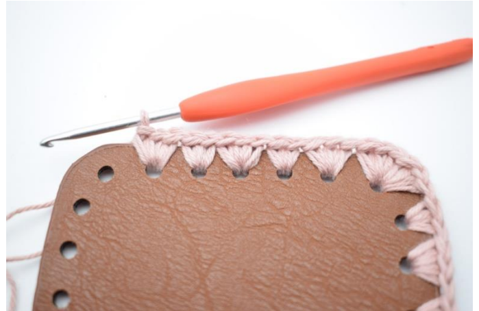
8. Hækl 3 fm i første hul. Hækl "2 fm i næste hul. Hækl 3 fm i det efterfølgende hul." Gentag "til" i alt 2 gange.