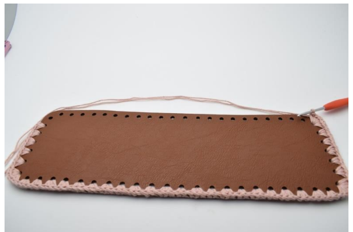
10. Nu hækles på den modsatte lange side.