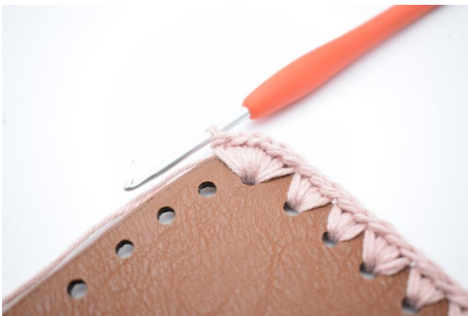
9. I hjørnehullet hækles 6 fm