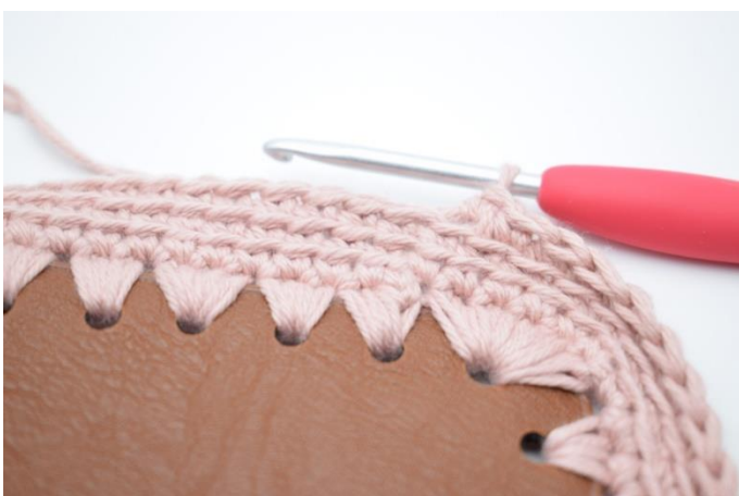
3. Gentag omgangen rundt.