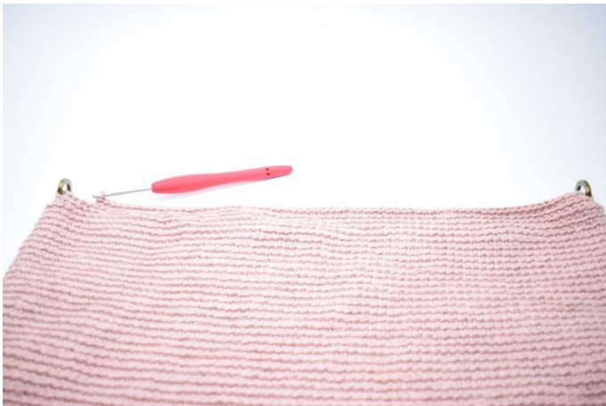
7. Hækl fm i bml frem til omgangens start.