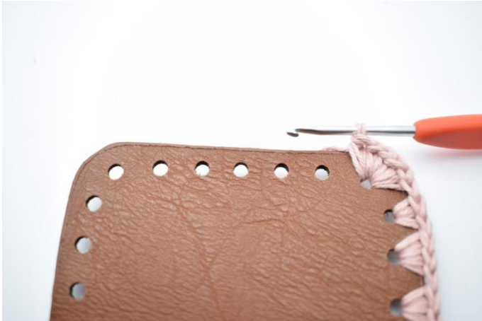
7. Nu hækles på den anden korte side.