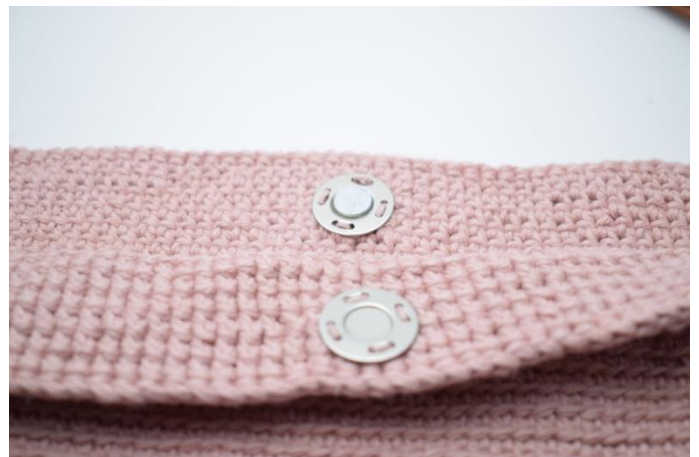
10. Sy magnetlåsen fast på indersiden i midten.