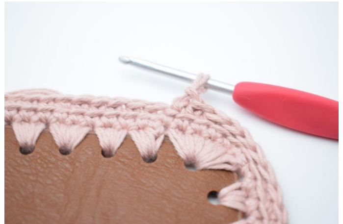
6. Gentag omgangen rundt.