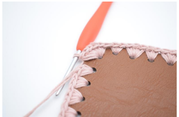
12. I hjørnehullet hækles 6 fm. (160)