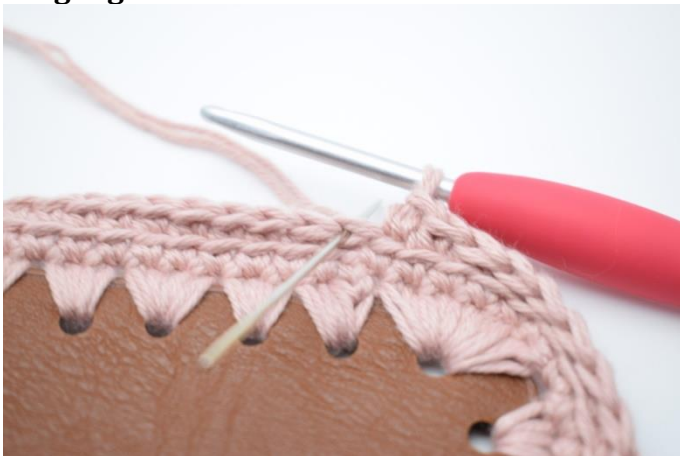
1. Gentag fremgangsmåden som omgang 3. Hækl 1 fm i bml.