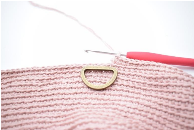
5. Hækl d-ringene fast med fm igennem begge lænker hen over 5 masker.