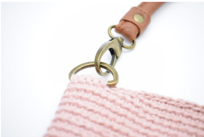
9. Hasp hankene på d-ringene.