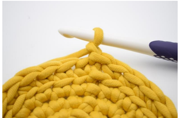
8. Lav 1 lm.