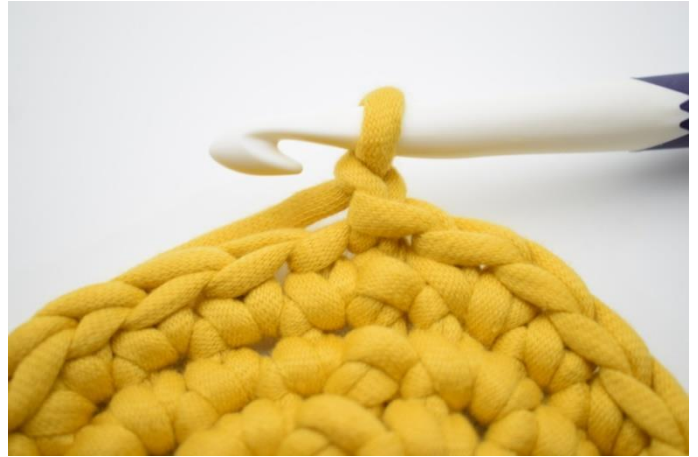
2. Lav 1 lm.