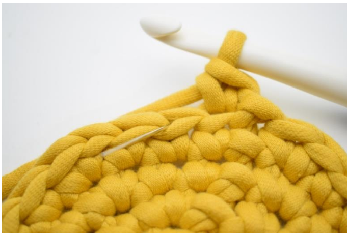
5. Hækl 1 fm i bml i næste m. Nålen her markerer den lænke din fm skal hækles i.