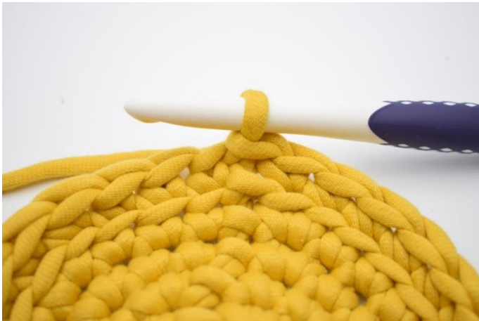
7. Gentag omgangen rundt og afslut med 1 km.