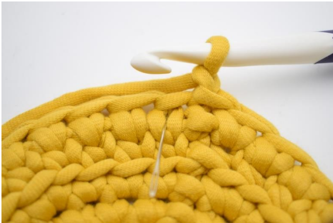
15. Hækl 1 ks i første "v".