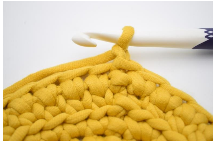
14. Sådan gentages omgangene. Lav 1 lm.