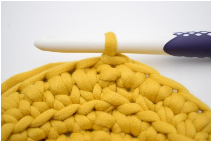
13. Gentag omgangen rundt og afslut med 1 km.