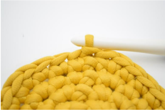
1. Her din bund netop afsluttet.