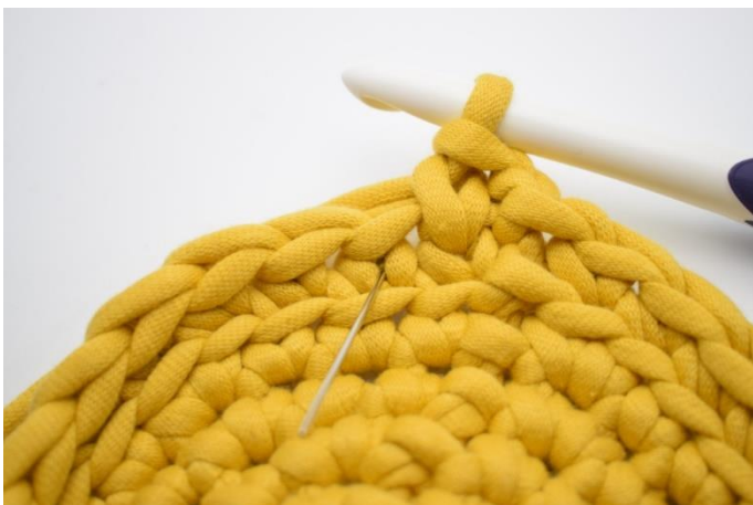
11. Hækl 1 ks i næste "v". Nålen her markerer hvor din ks skal hækles.