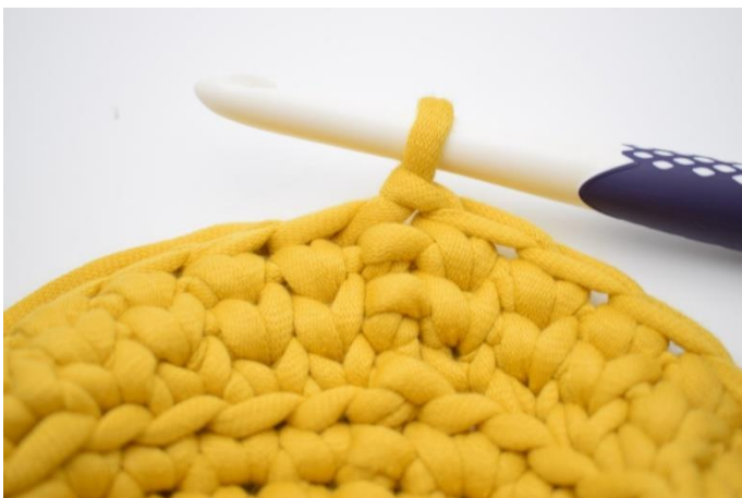
17. Gentag omgangen rundt og afslut med 1 km.