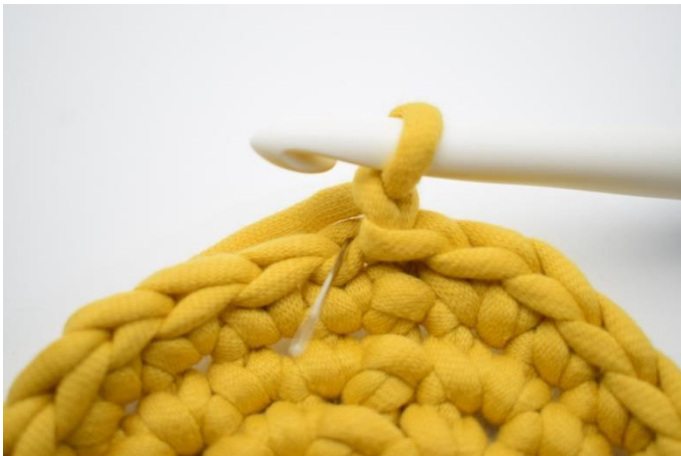
3. Denne omgang hækles der fm i bml. Nålen her markerer den lænke din første fm skal hækles i.