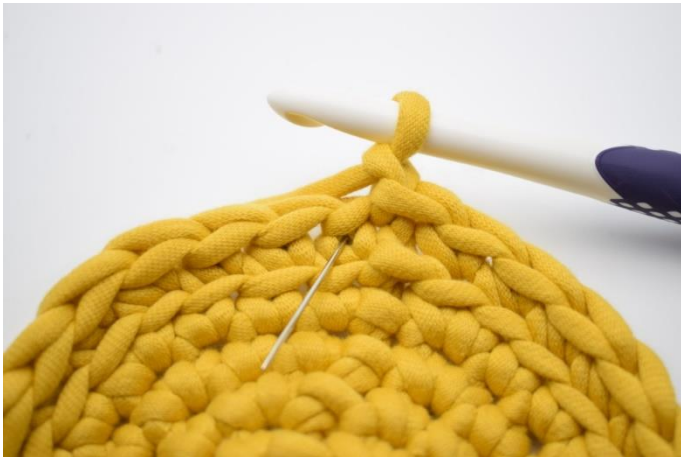
9. Denne omgang hækles med ks. Ks er en alm. Fm men som hækles i "v" et i stedet for som normalt i masken. Nålen her markerer det "V" din ks skal hækles i.