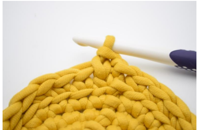
10. Sådan. Der er nu hækles en ks.