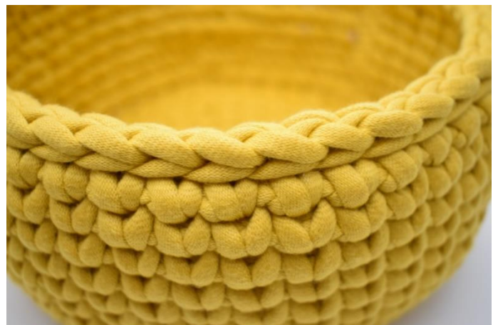
18. Gentag denne fremgangsmåde som beskrevet i opskriften. Afslut med 1 omgang km. Klip garnet og hæft ender.