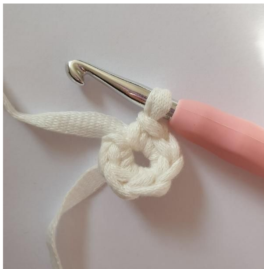
2. Hækl 6 fm i 2.lm fra nålen.