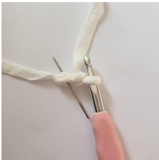
1. Lav 2 lm, start i 2. lm fra nålen.

Afslut med 2 km. Klip garnet og hæft enderne.