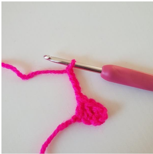
1. Lav 5 luftmasker