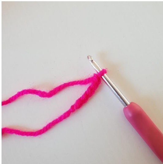
1. Start med at lave 5 luftmasker