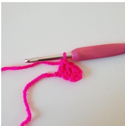
3. Hækl stgm i de næste 2 luftmasker. Du har nu hæklet din første pixel