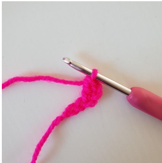
2. I 3. luftmaske hækles 1 stgm