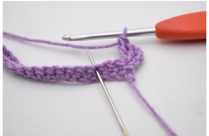
4. Spring 2 m over.