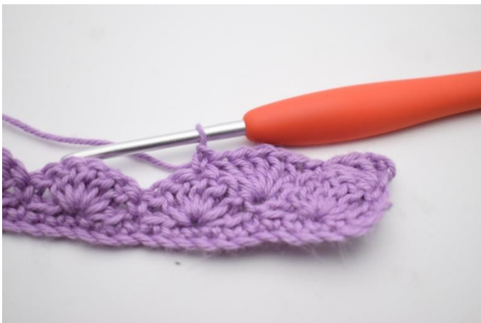
9. Hækl 1 fm i næste m.