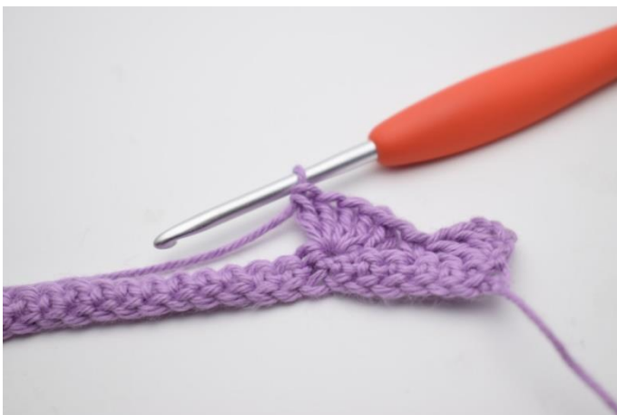
7. Hækl 5 stgm i næste m.