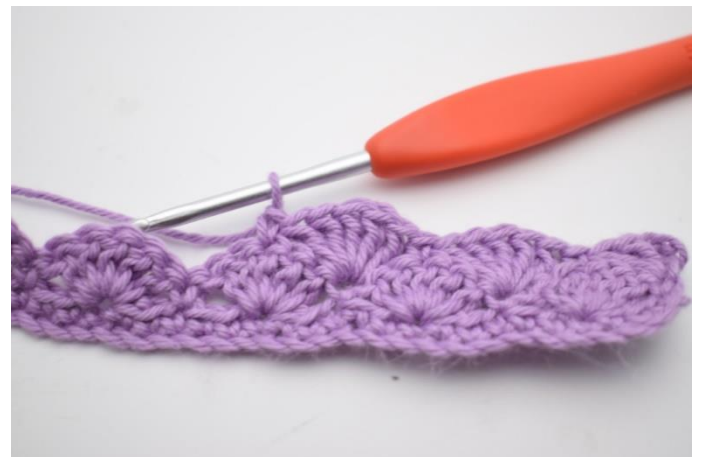
10. Spring 2 m over, hækl 5 stgm i næste m, spring 2 m over og hækl 1 fm i næste m.