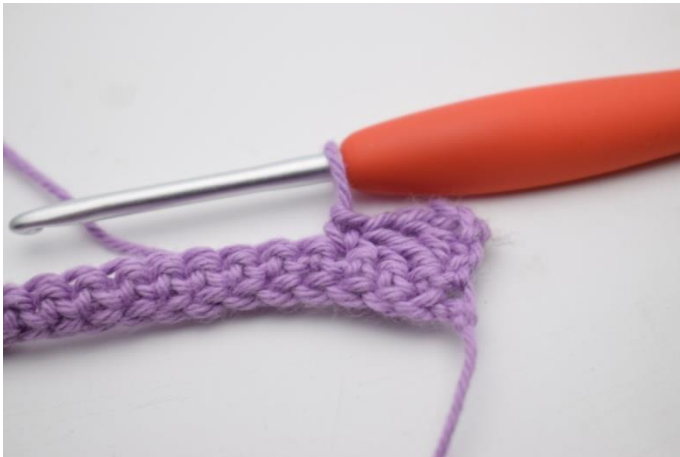
5. Hækl 1 fm i næste m.