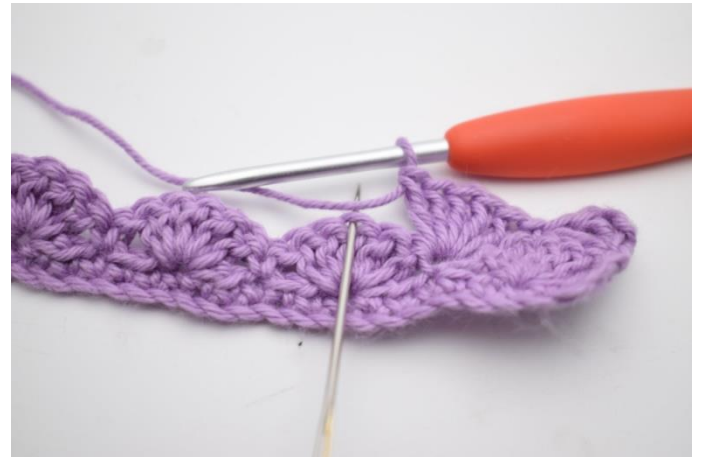
8. Spring 2 m over.