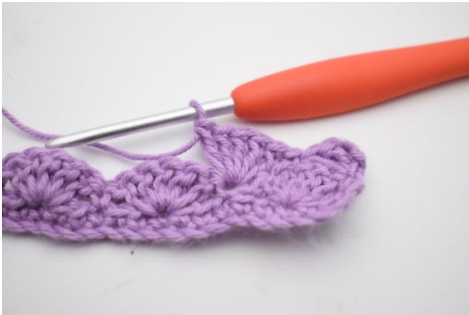
7. Hækl 5 stgm i næste m.