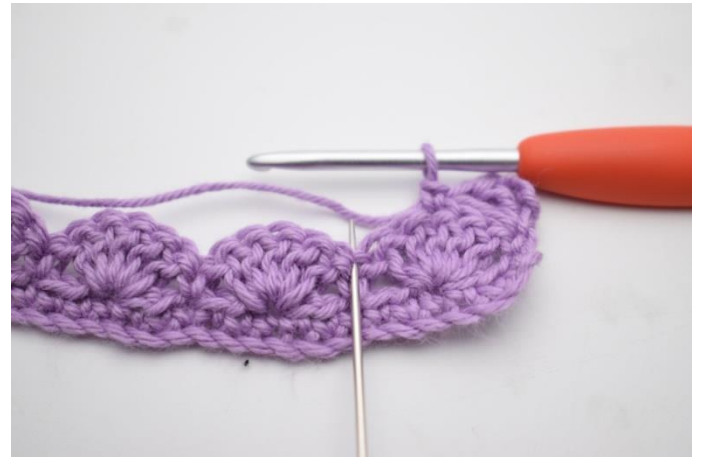
6. Spring 2 m over.