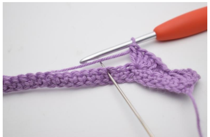
8. Spring 2 m over.