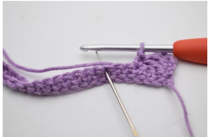
6. Spring 2 m over.