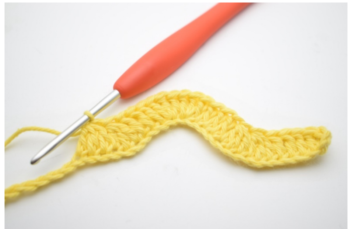
10. Hækl 1 stgm i de næste 3 lm. "Hækl 3 stgm sm over de næste 3 lm". Gentag "til" i alt 2 gange.