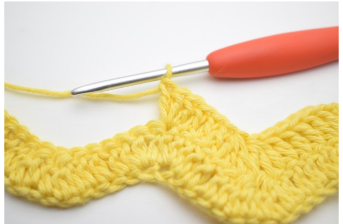
8. Hækl 3 stgm i næste m.