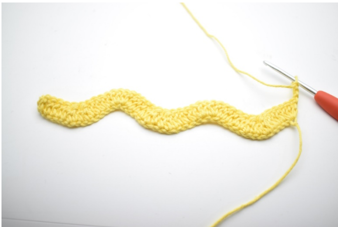
1. Vend med 3 lm.