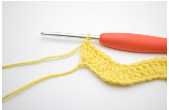
14. I sidste lm hækles 3 stgm.