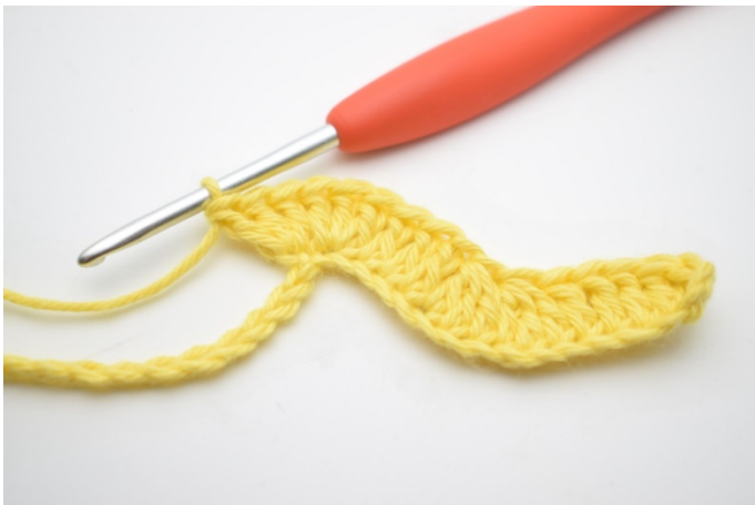
9. Gentag og hækl 3 stgm i næste lm.