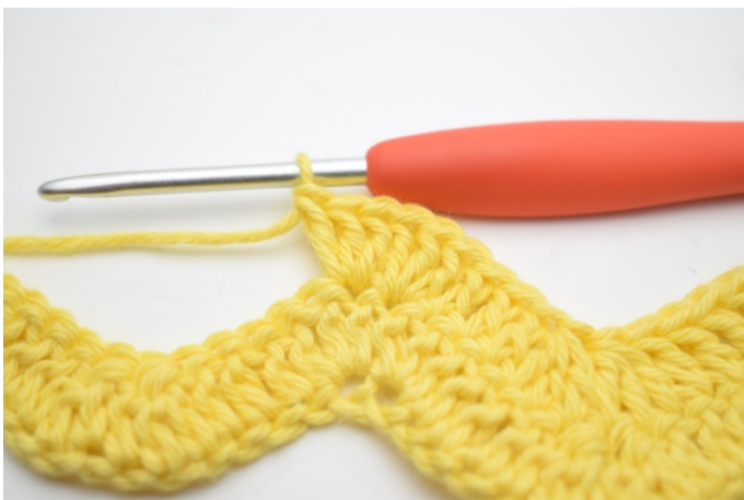
9. Gentag og hækl 3 stgm i næste m.