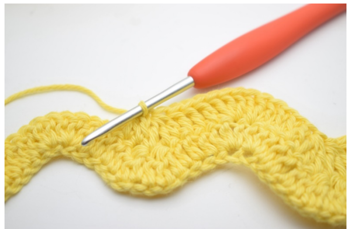
10. Hækl 1 stgm i de næste 3 m. "Hækl 3 stgm sm over de næste 3 m". Gentag "til" i alt 2 gange.