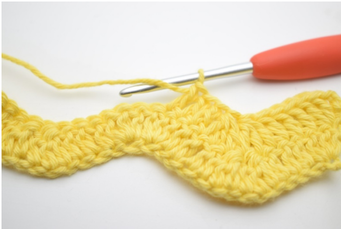
7. Hækl 1 stgm i de næste 3 m.