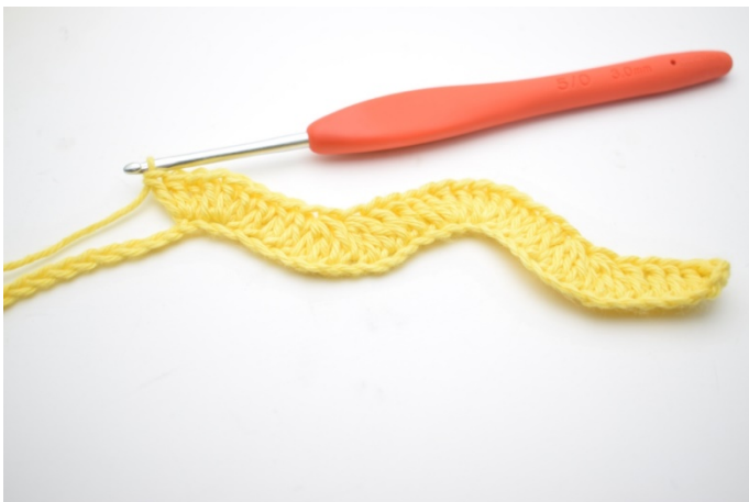
11. Hækl 1 stgm i de næste 3 lm. Hækl 3 stgm i de efterfølgende 2 lm.