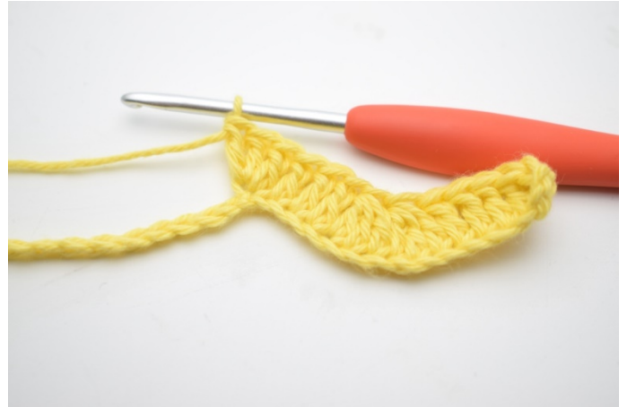
8. Hækl 3 stgm i næste lm.