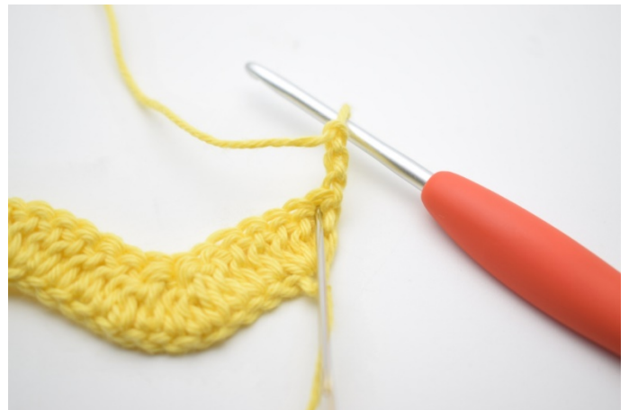
2. Hækl 2 stgm i første m.