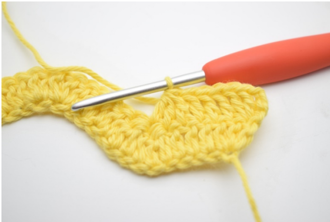
5. Hækl 3 stgm sm over de næste 3 m.