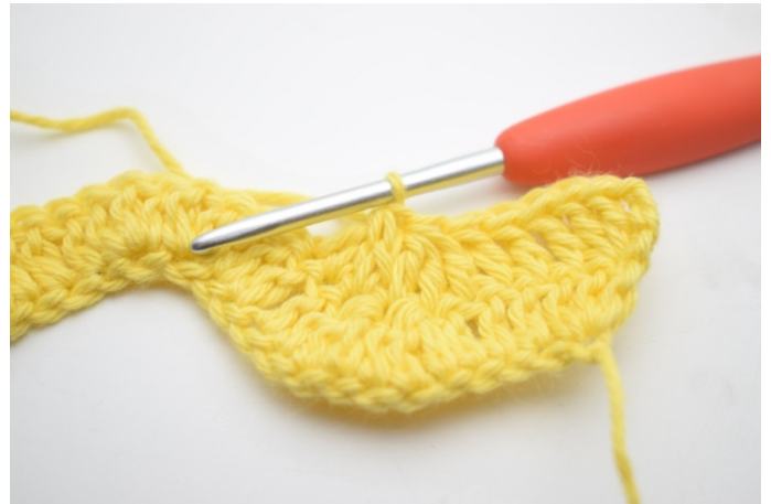
6. Gentag og hækl 3 stgm sm over de næste 3 m.