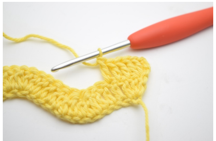
4. Hækl 1 stgm i de næste 3 m.