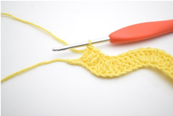
13. Hækl 1 stgm i de næste 3 lm.