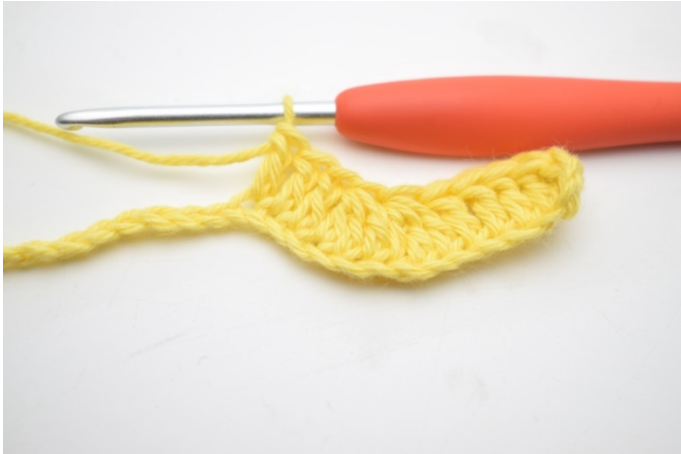
7. Hækl 1 stgm i de næste 3 lm.