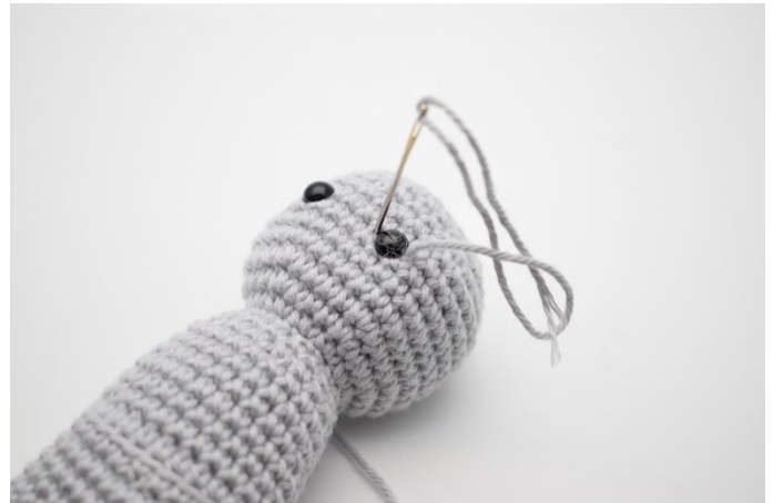
2. Stik nålen ned på venstre side af øjet, og stram lidt til.