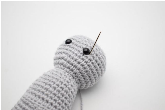
1. Med samme farve som hovedet trækkes nu en snor op og ud på højre side af det ene øje.