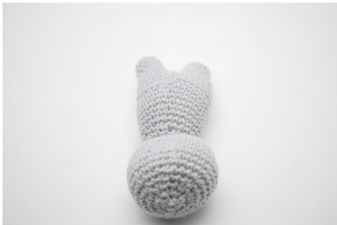
1. Vend kaninen så den har hovedet mod dig.