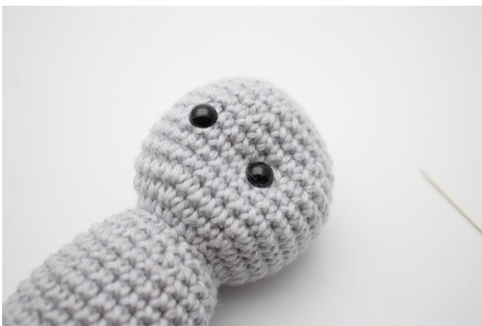
3. Træk let til så der kommer en fordybning under øjet.