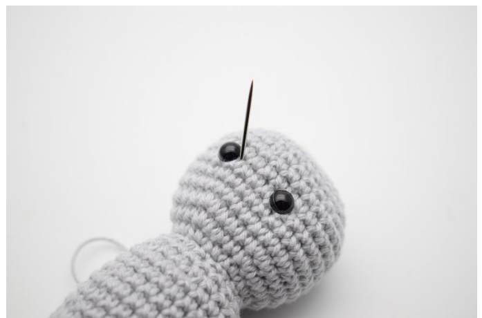
4. Træk nu snoren op på højre side af det andet øje.