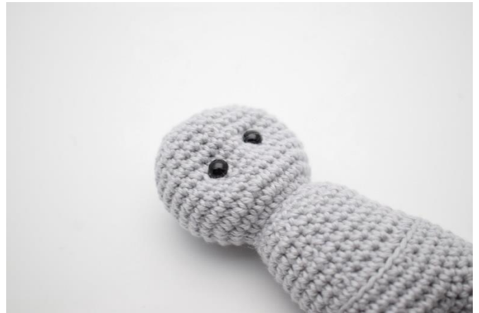
6. Stram lidt til så øjnene bliver trukket lidt tilbage og giver kaninen et sødt udtryk.