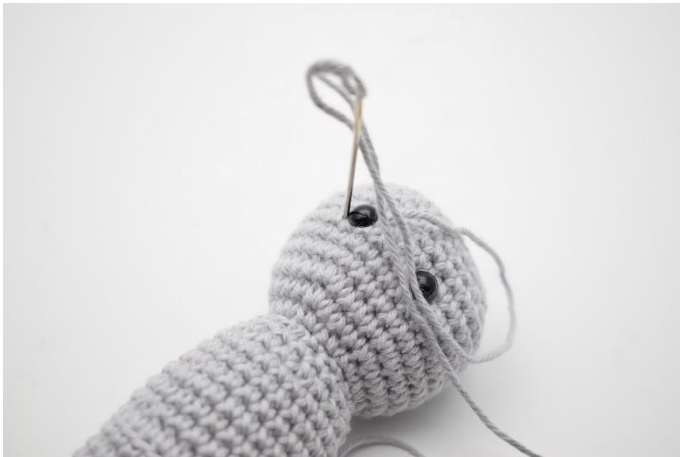
5. Og ned igen på venstre side af øjet.