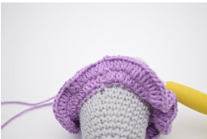
5. Lav 1 lm, og hækl 2 hstm i alle masker omgangen rundt. Afslut med 1 km i først hstm.