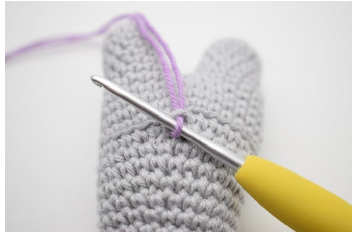
2. Indsæt garnet i en lænke på kroppen hvor der er hæklet i bml.