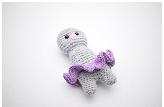
6. Sådan. Klip garnet og hæft ender.