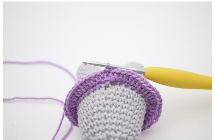
4. Lav 1 lm, og hækl 2 hstm i alle masker omgangen rundt. Afslut med 1 km i først hstm.