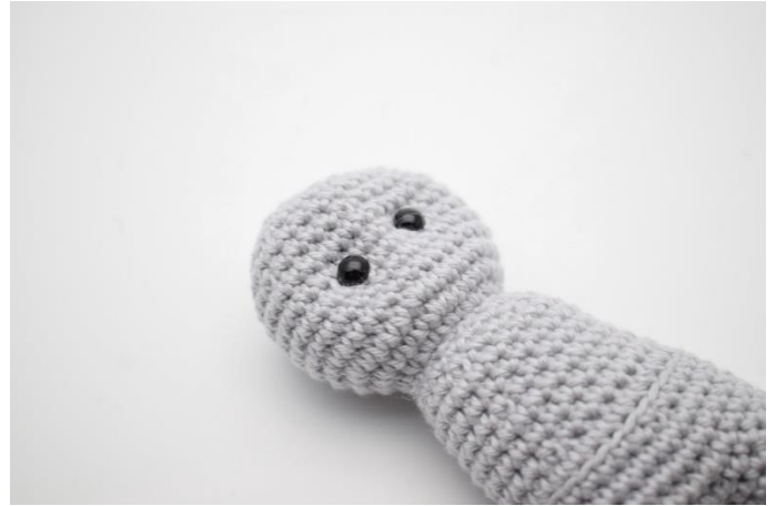
6. Stram lidt til så øjnene bliver trukket lidt tilbage og giver kaninen et sødt udtryk.