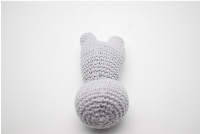
1. Vend kaninen så den har hovedet mod dig.