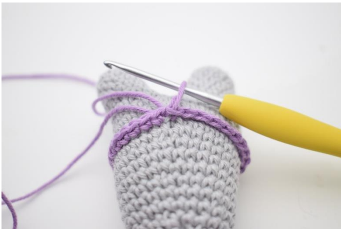
3. Hækl fm omgangen rundt og afslut med 1 km.