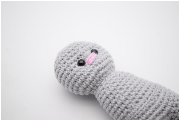
7. Sy snuden som på billedet herover. Der er syet hen over 2-3 masker.