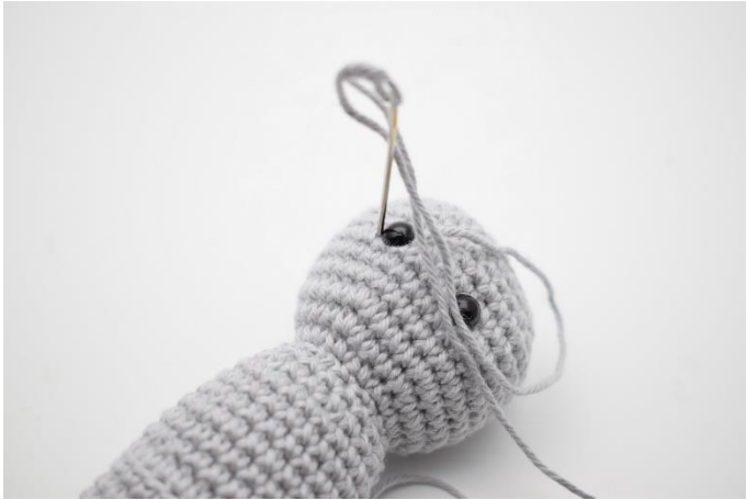
5. Og ned igen på venstre side af øjet.