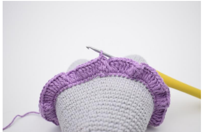
4. Lav 1 lm, og hækl 2 stgm i alle masker omgangen rundt. Afslut med 1 km i først stgm.