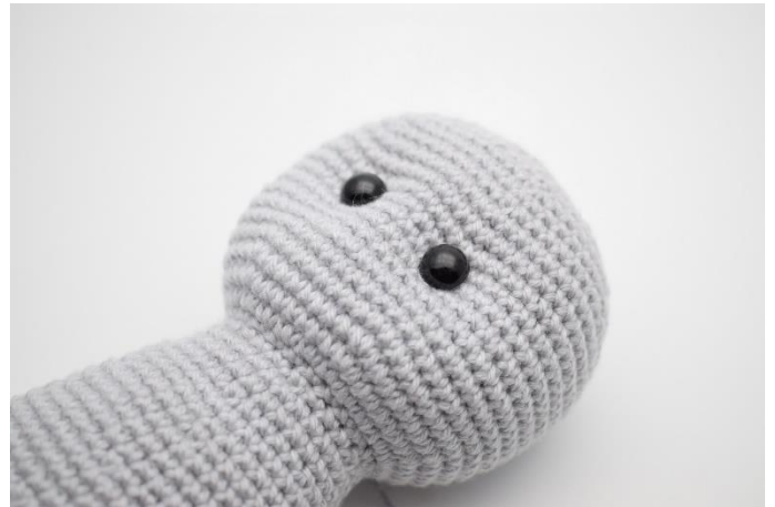
6. Stram lidt til så øjnene bliver trukket lidt tilbage og giver kaninen et sødt udtryk.