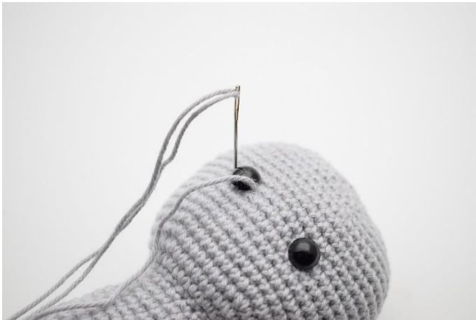
5. Og ned igen på venstre side af øjet.