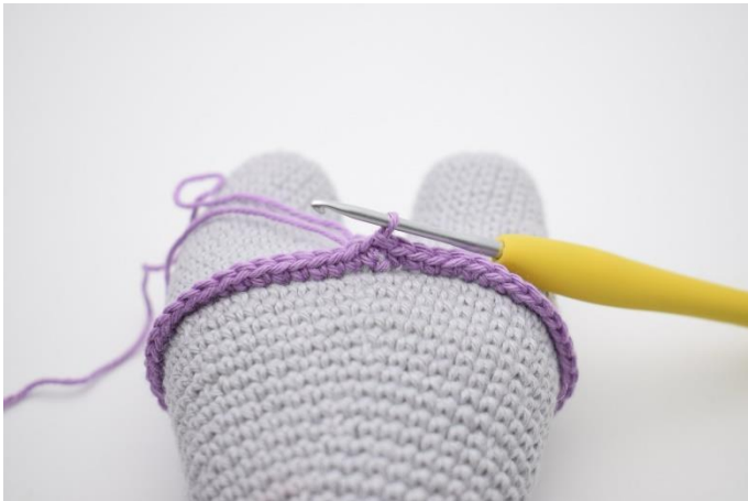
3. Hækl fm omgangen rundt og afslut med 1 km.