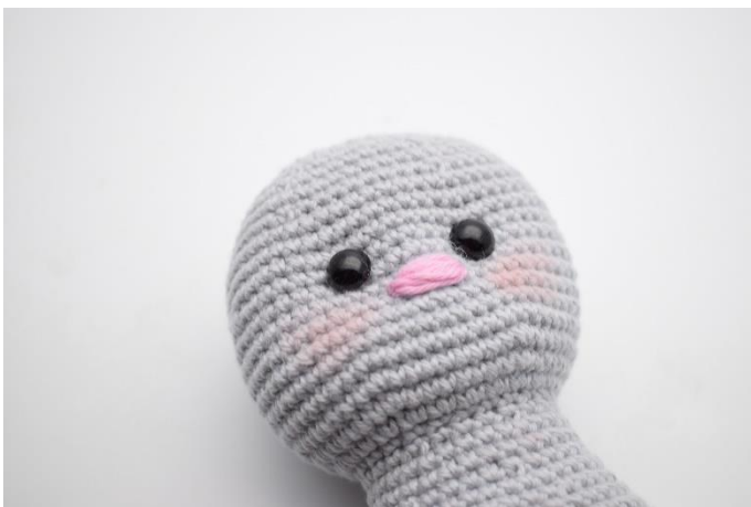
7. Sy snuden som på billedet herover. Der er syet hen over 4-5 masker.