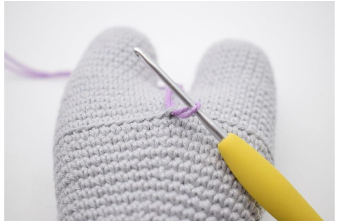
2. Indsæt garnet i en lænke på kroppen hvor der er hæklet i bml.