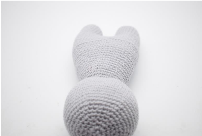
1. Vend kaninen så den har hovedet mod dig.