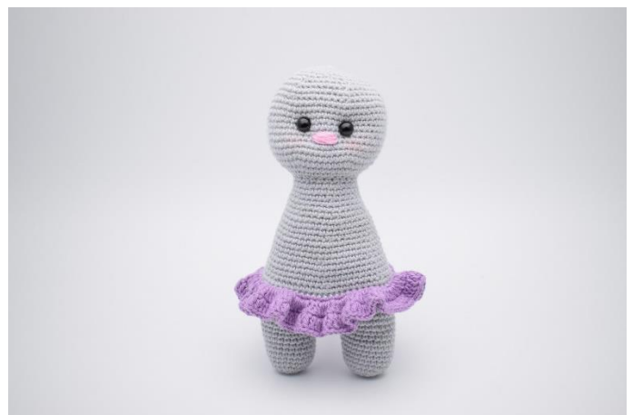
6. Sådan. Klip garnet og hæft ender.