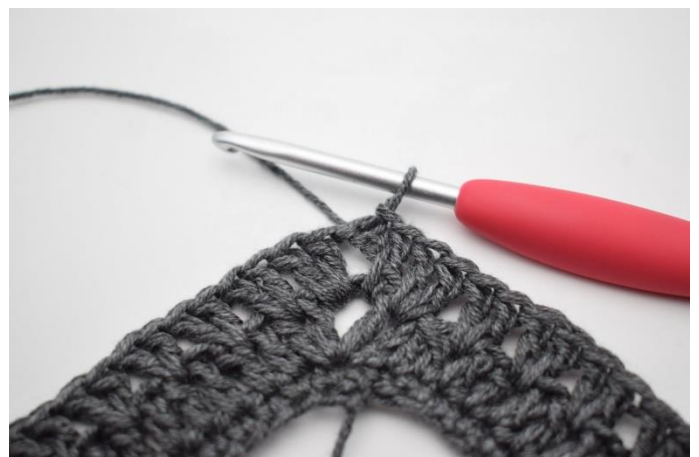
16. Afslut med 1 km.