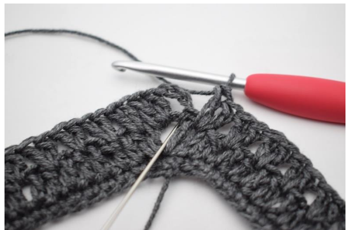
14. Hæk 1 stgm i lm-buen fra omgangens begyndelse.