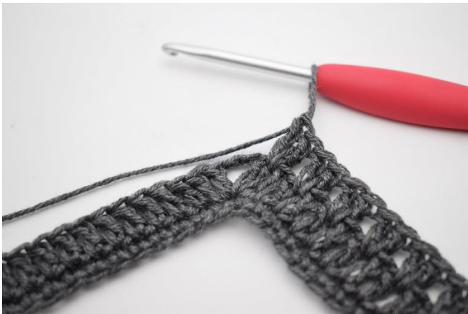
7. Hæk "2 stgm imellem de næste 2 stgm, spring 1 m over". Gentag "til" i alt 34 gange.