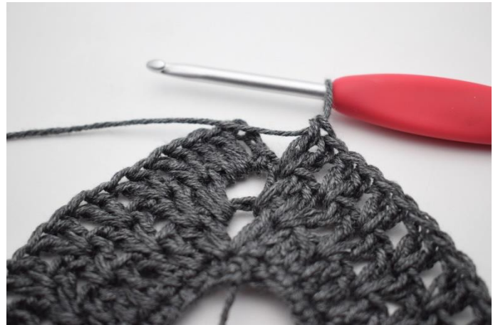
8. Hækl "2 stgm imellem de næste 2 stgm, spring 1 m over". Gentag "til" i alt 36 gange.