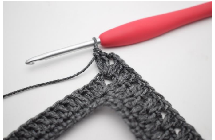
8. Hæk 2 stgm, 2 lm, 2 stgm i lm-buen.