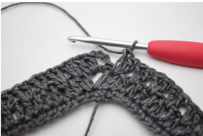
13. Hæk "2 stgm imellem de næste 2 stgm, spring 1 m over". Gentag "til" i alt 34 gange.