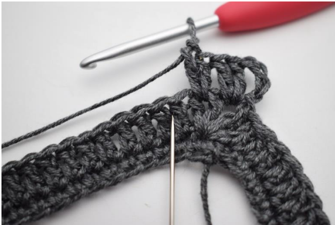
5. Spring 1 m over og hæk 2 stgm imellem de næste 2 stgm.