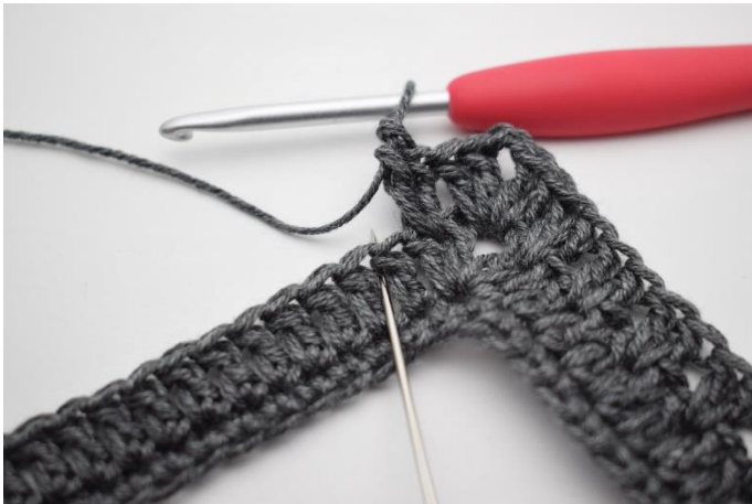
11. Spring 1 m over og hæk 2 stgm imellem de næste 2 stgm.