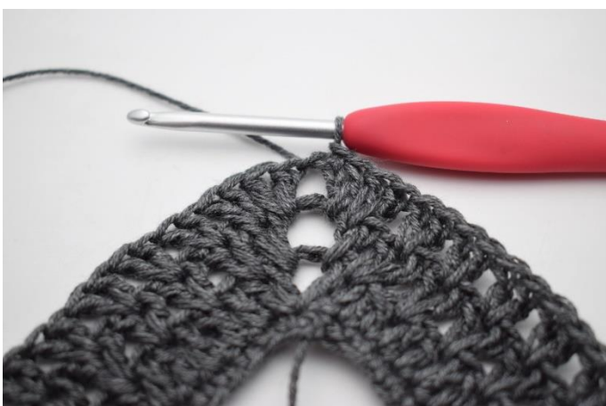
11. Afslut med 1 km.