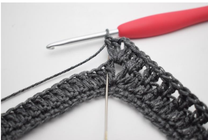
9. Hæk 2 stgm imellem de første 2 stgm. Nålen her markerer hvor dine stgm skal hækles.