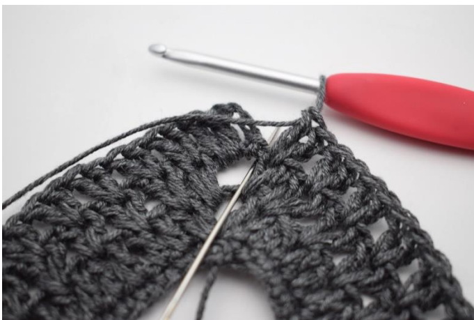
9. Hækl 1 stgm i lm-buen fra omgangens begyndelse.