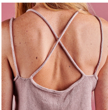
Billede 2: Icordstropper