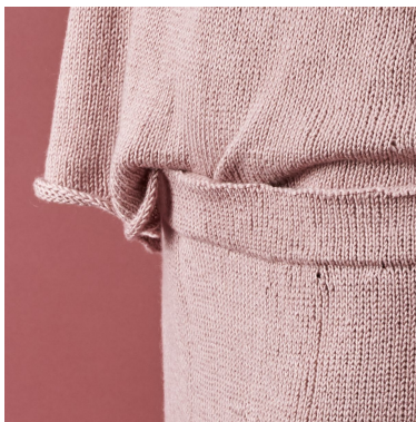
Billede 1: Linning