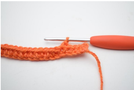
3. Hækl 1 fm i de første 4 (5) m.