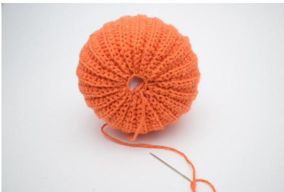
19. Klip garnet og sy hullet helt til.