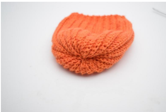
15. Vend nu vrangen ind.