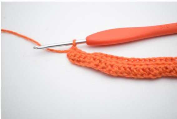
5. Hækl 1 fm i de sidste 4 (5) m.