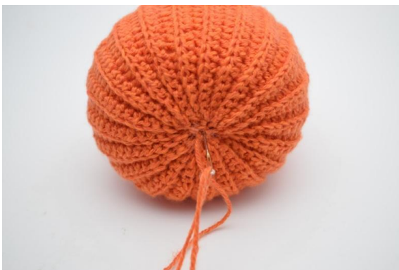
21. Træk nu garnet op igennem græskarret og tilbage igen.