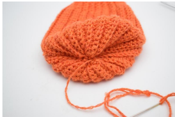
14. Klip garnet og sy nu hullet helt til.