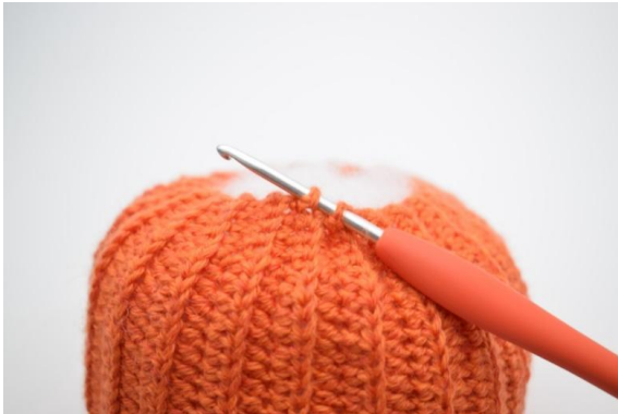
17. Gentag nu med km igennem 2 af de yderste rib omgangen rundt i bunden.