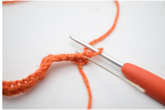
2. Fra nu af hækles der KUN i bml.