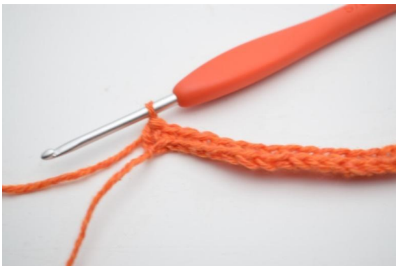
7. Hækl 1 fm i de sidste 4 (5) lm.