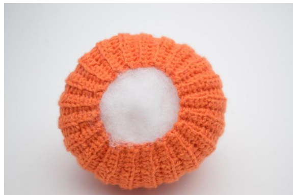
16. Kom fyld i.