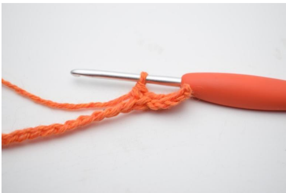
5. Hækl 1 fm i de næste 3 (4) lm.