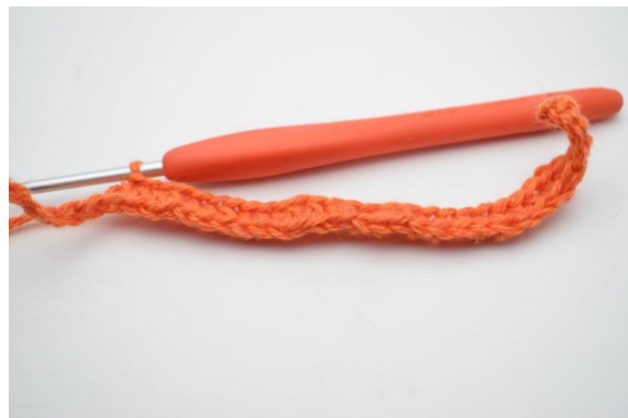
6. Hækl 1 hstm i de næste 20 (25) lm.