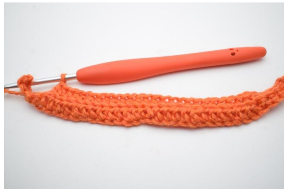
4. Hækl 1 hstm i de næste 20 (25) m.