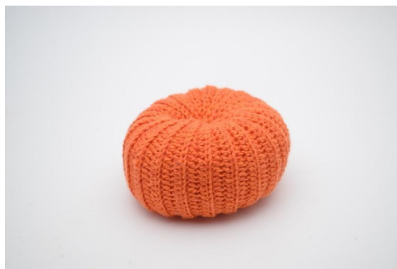
22. Stram let til og hæft enden.