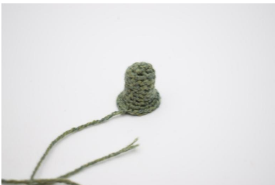
23. Sy nu stilken fast.