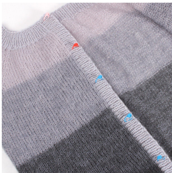
7- Marker hvor knapperne skal sidde.