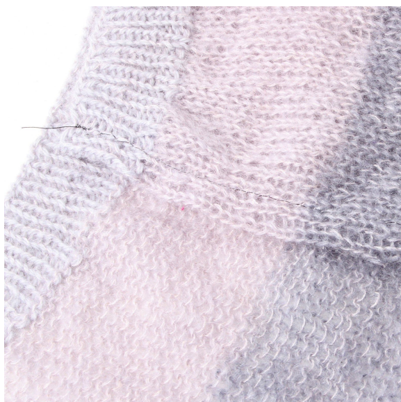
5- Kanten ser nu således ud.