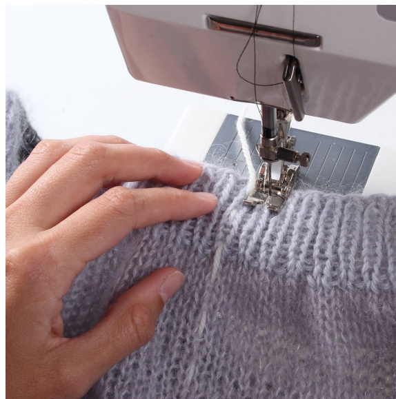
2- Sy zig-zag på maskine på hver side af kontrasttråden.