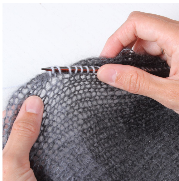
6- Strik fra retten masker op langs kanten.