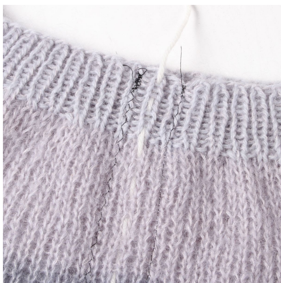
3- Zig-zag-tråden holder på maskerne. Pas på den ikke strammer.