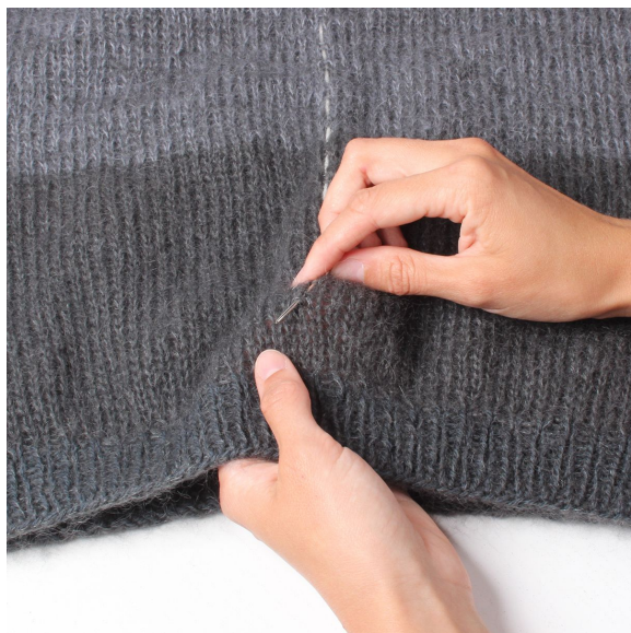
1- Marker hvor der skal klippes op. Ri en kontrast tråd langs hele kanten.