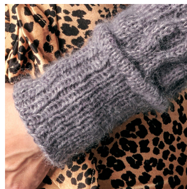
Biese og ribkant