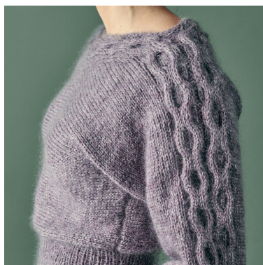
Snoning langs ærme