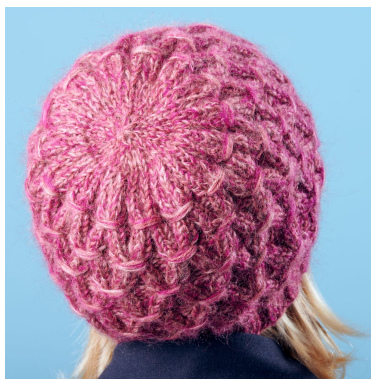
Indtagninger i toppen