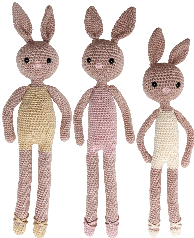
Bunny girl "Belly"