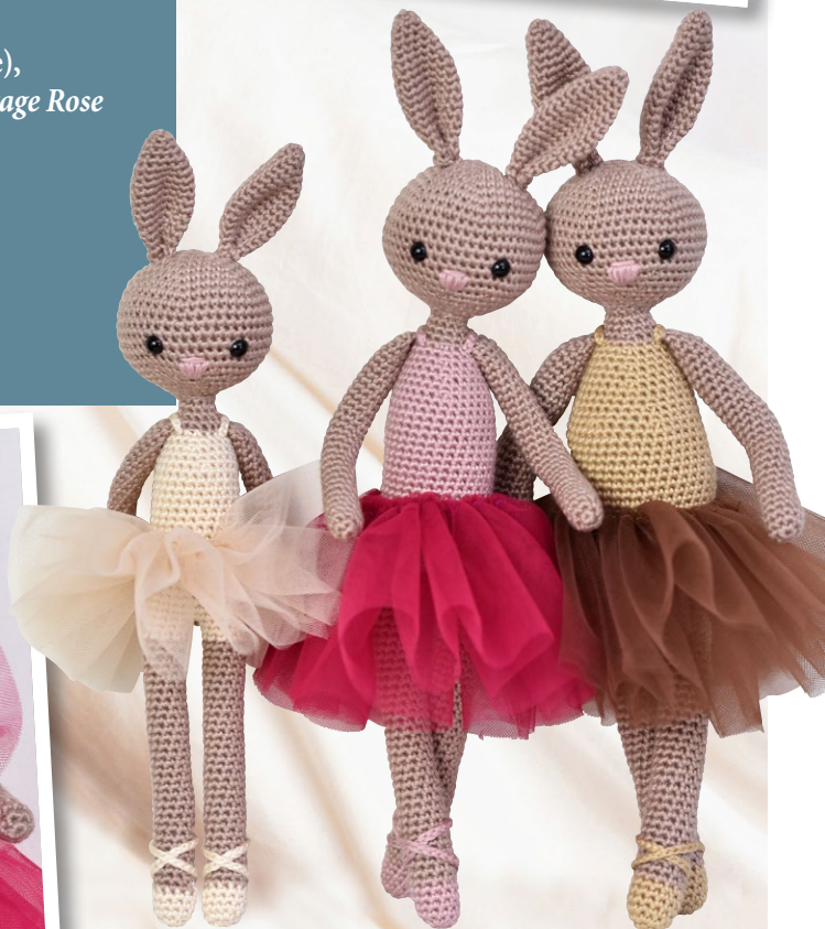
Little Bunny H: 31 cm