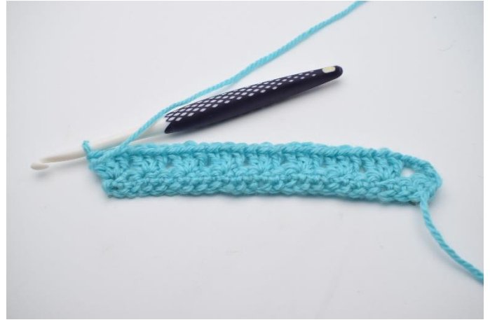
8. Gentag rækken ud. Rækken afsluttes med 1 stgm gruppe.