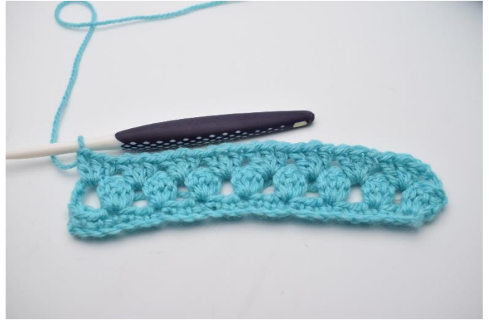
14. Sådan gentages rækken ud. Afslut rækken med 1 stgm gruppe i mellem sidste stgm gruppe og de 3 lm på forrige række.