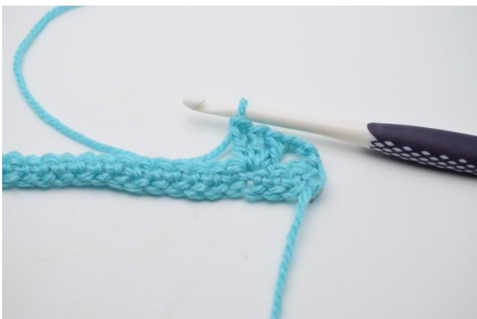
5. I næste maske hækles 1 stgm gruppe.