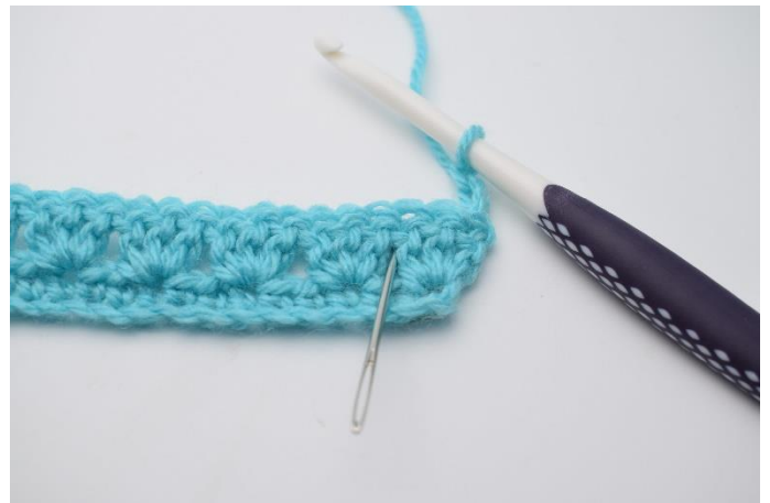
10. Nu hækles der i mellemrum mellem stgm grupperne på forrige række.