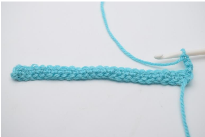
3. Vend arbejdet og lav 3 lm.