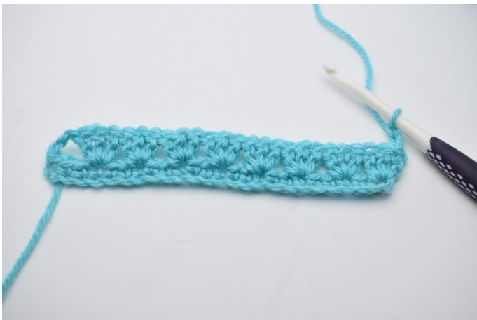
9. Vend dit arbejde, og lav 3 lm.