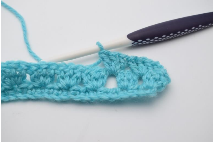
13. Hækl 1 stgm gruppe.