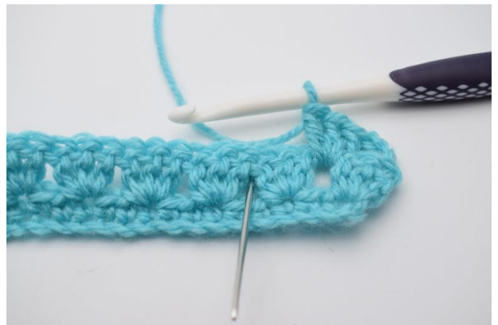
12. Næste stgm gruppe hækles i næste mellemrum mellem stgm grupperne på forrige række.