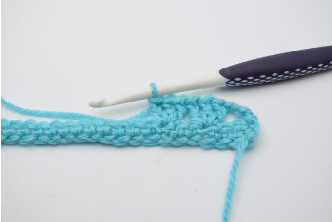
7. I næste maske hækles 1 stgm gruppe.