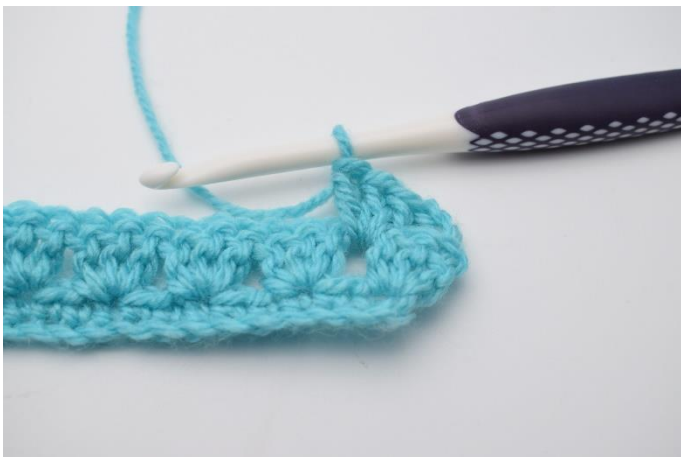
11. Hækl 1 stgm gruppe i første mellemrum.