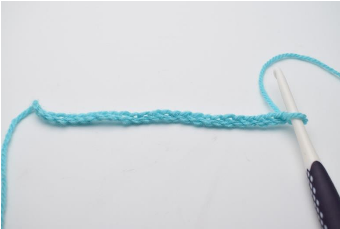
1. Start med at slå dine luftmasker op.

Guiden er lavet med mindre masker, men fremgangsmåden er den samme.