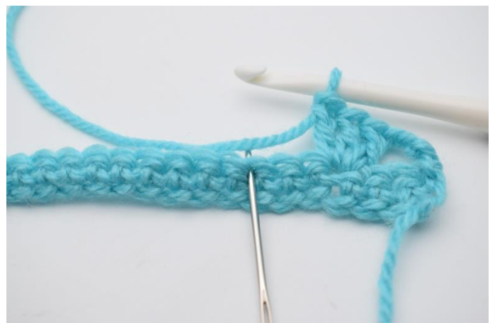
6. Spring 2 masker over.