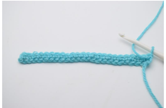
2. I 2. lm fra nålen hækles 1 fm. Hækl nu fm rækken ud.