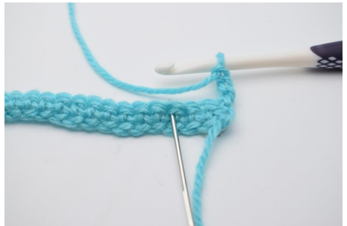
4. Spring 2 masker over.