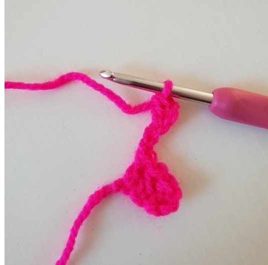
2. Hækl 1 stgm i tredje lm fra nålen