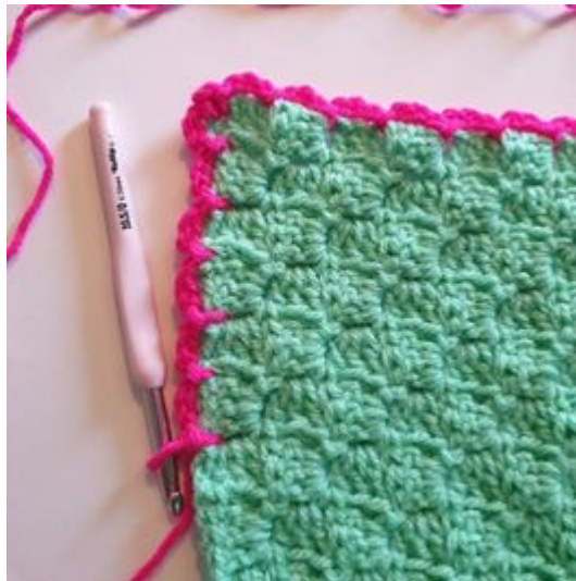
10. Fortsæt med at hækle ifølge tidligere mønster rundt om tæppet .