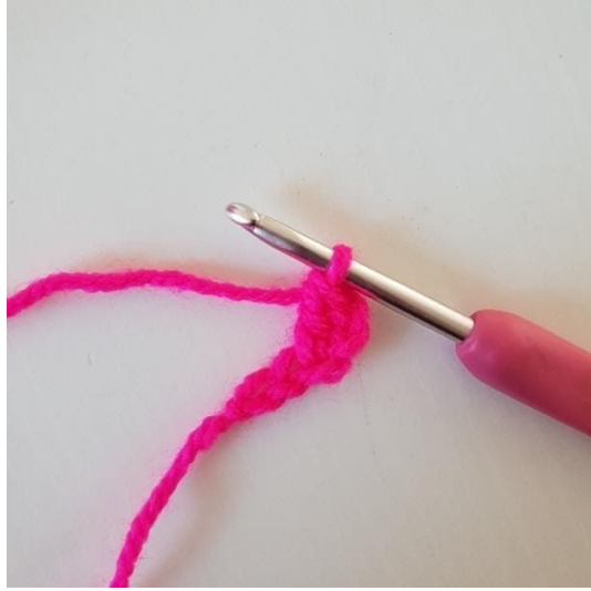
2. I tredje luftmaske hækles 1 stgm