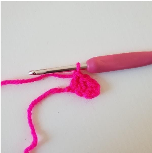
3. Hækl stgm i de næste 2 lm. Du har nu hæklet din første pixel.