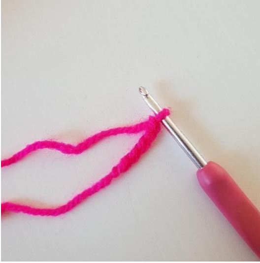
1. Start med at lave 5 luftmasker