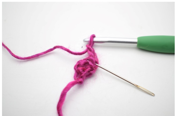
2. Udtagningen laves ved at der hækles 1 stgm i første m. Den maske nålen her markerer.