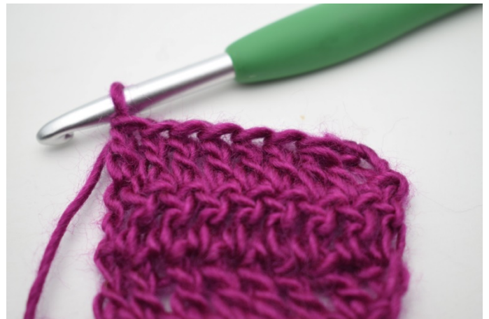
4. Hækl stgm rækken ud.

85. Vend med 3 lm. Hækl de 2 næste m sm. Hækl stgm rækken ud. (82)