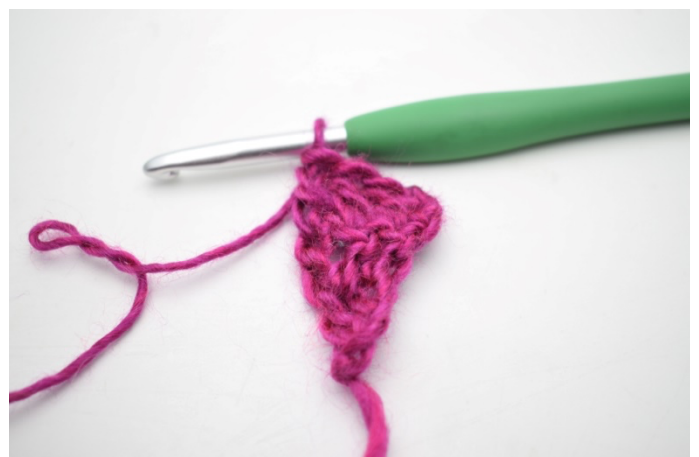
4. Hækl 1 stgm i de sidste 2 m.