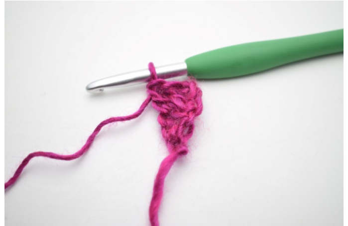
4. Hækl 1 stgm i sidste m. Rækken er nu vokset med 1 m.

3. Vend med 3 lm. Hækl 1 stgm i første m. Hækl 1 stgm i de sidste 2 m. (4)