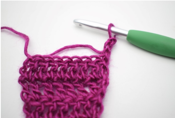
1. Vend med 3 lm.

84. Vend med 3 lm. Hækl de 2 næste m sm. Hækl stgm rækken ud. (83)