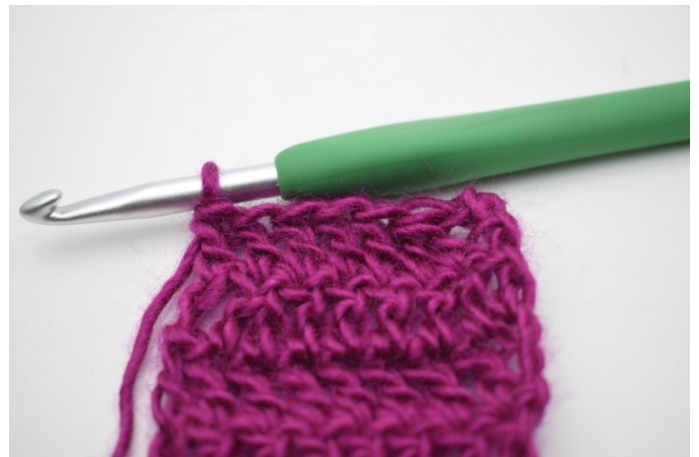
4. Hækl stgm rækken ud.

86. - 165. Gentag fremgangsmåden " Vend med 3 lm. Hækl de 2 næste stgm sm. Hækl 1 stgm rækken ud." til du har 165 rækker. (2) Klip garnet og hæft ender.