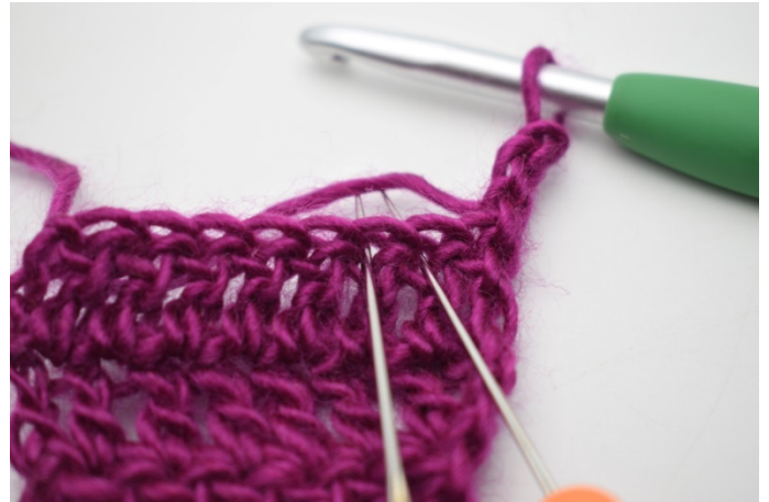
2. Nu laves en indtagning. Den laves ved at maske 2 og 3 hækles sammen.