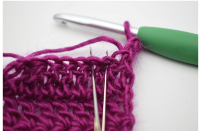
2. Nu laves en indtagning. Den laves ved at maske 2 og 3 hækles sammen.