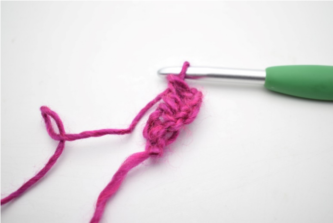
3. Sådan. Der er nu 2 stgm i første m, da de 3 lm udgør 1 stgm.