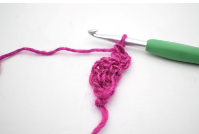
3. Sådan. Der er nu hæklet 1 udtagning.