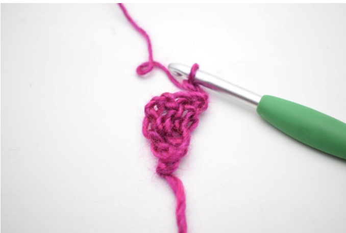
1. Vend med 3 lm.

3. Vend med 3 lm. Hækl 1 stgm i første m. Hækl 1 stgm i de sidste 2 m. (4)