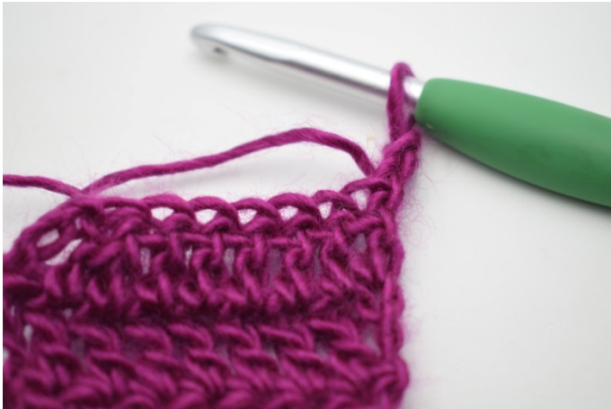
1. Vend med 3 lm.