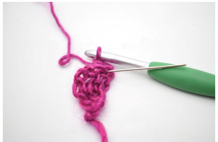
2. Hækl 1 stgm i første m. (Nålen markerer her den første m.)