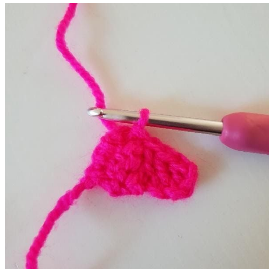
4. Nu skal pixlen hækles sammen med den første pixel ved at vende pixlen og hække 1 km i venstre side af den første pixel. På billedet kan du se hvordan de er hæklet sammen.