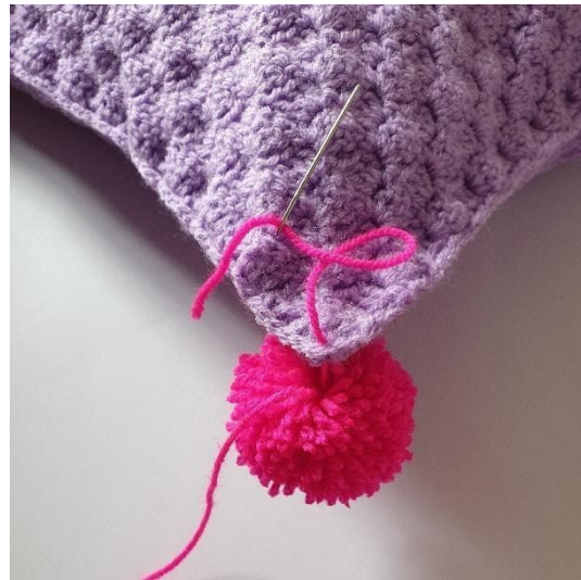
Sy en pompon fast i hvert hjørne af puden.