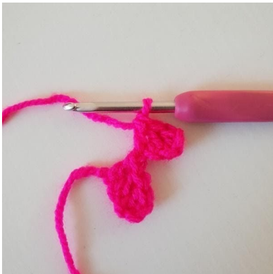
3. Hækle stangmasker i de 2 næste lm. Nu har du en pixel mere.