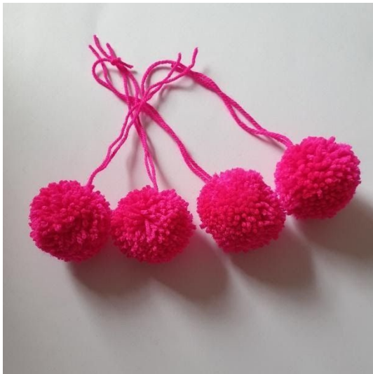
Lav 4 pomponer.