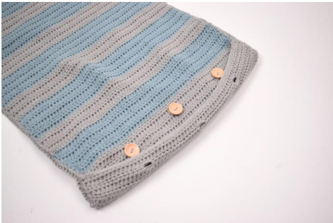
7. Sy de 3 knapper fast så det passer med knaphullerne.