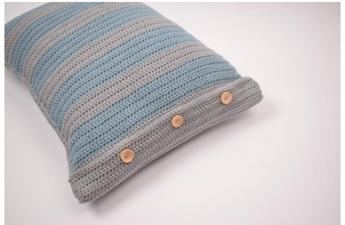
8. Kom puden i og luk puden.