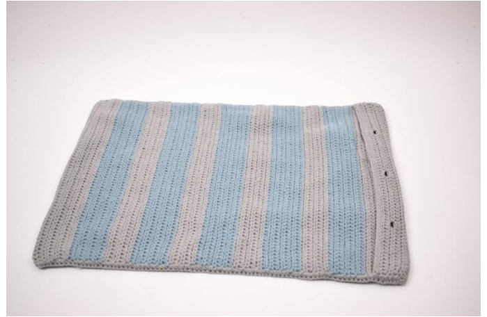
6. Gentag på begge sider. Klip garnet og hæft ender.