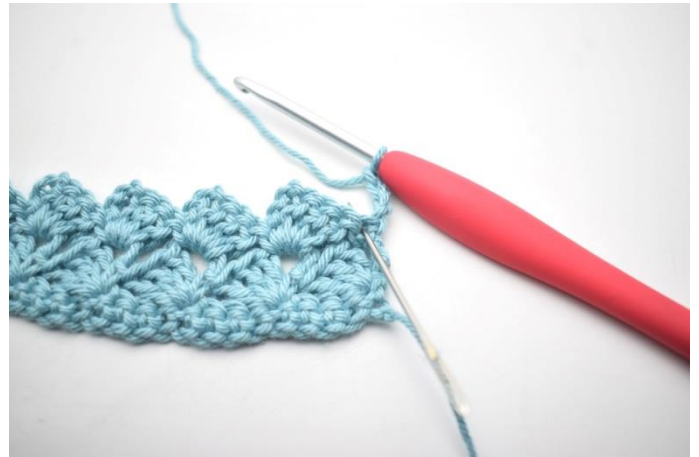
26. Hækl 3 stgm i første m.