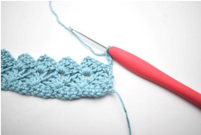
25. Hækles som række 3. Vend med 4 lm.