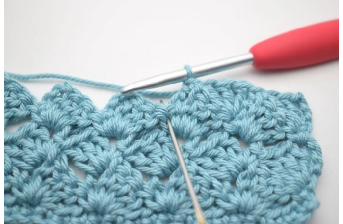
43. Hækl 3 stgm i fm fra forrige række”.