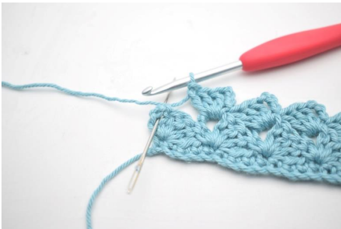
23. Hækl 1 fm i sidste lm-bue.