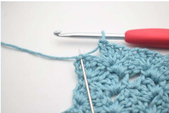
46. Hækl 1 fm i sidste lm-bue.