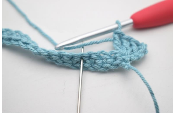
8. "Spring 3 m over, hækl 1 fm, 3 lm og 3 stgm i næste m".