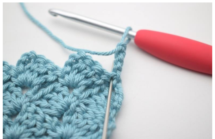
35. Hækl 2 stgm i første m.