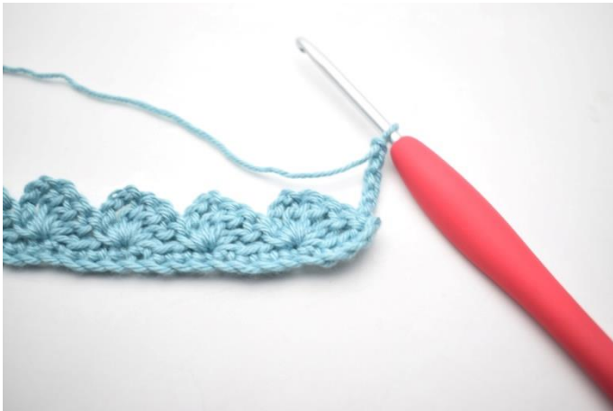
15. Vend med 4 lm.