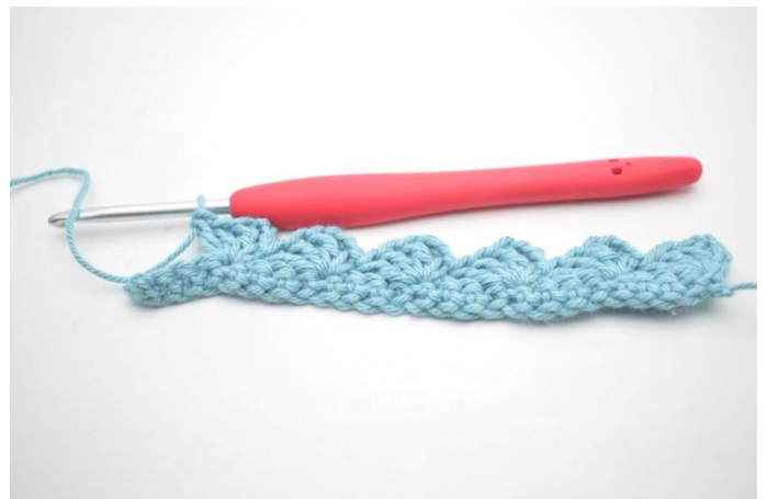
12. Gentag "til" til du har 4 m tilbage.