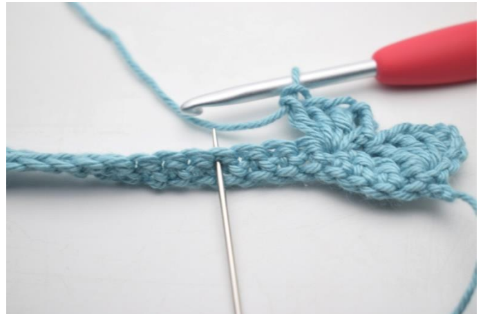
10. "Spring 3 m over, hækl 1 fm, 3 lm og 3 stgm i næste m".