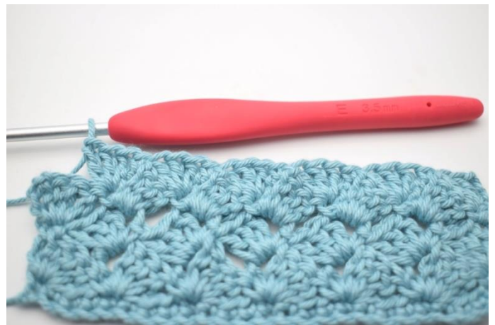
45. Gentag ”til” i alt 13 gange.