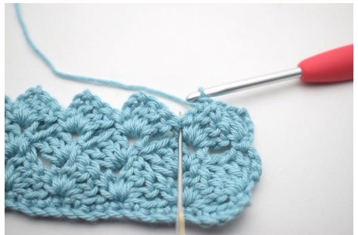
39. Hækl 3 stgm i fm fra forrige række".