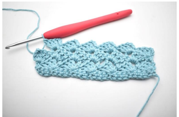
30. "Hækl 1 fm, 3 lm og 3 stgm i næste lm-bue". Gentag "til" i alt 13 gange.