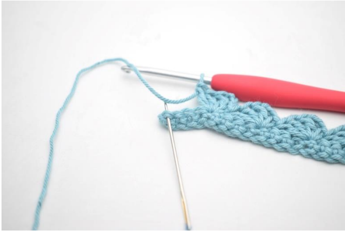
13. Spring 3 m over og hækl 1 fm i sidste m.