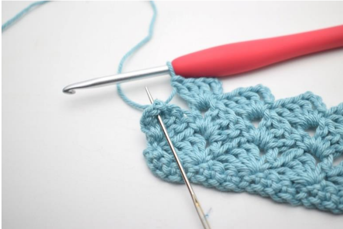
31. Hækl 1 fm i sidste lm-bue.