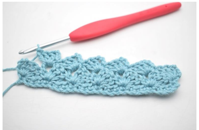
22. Gentag "til" i alt 13 gange.