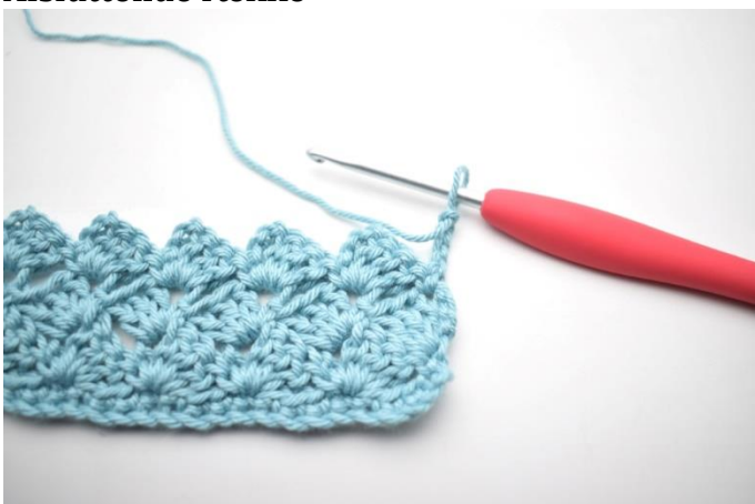
34. Vend med 4 lm.