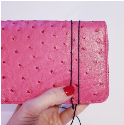
Lind garnet rundt om etuiet