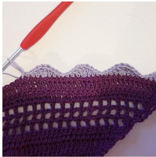
[1 fm, 1 hstgm, 1 stgm, 3 dstgm i samme m, 1 stgm, 1 hstgm, 1 fm, 1 km] gentag