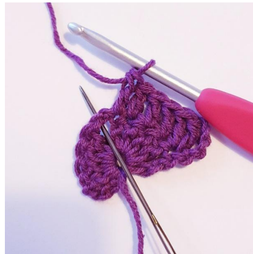
1 stgm i de næste 4 m