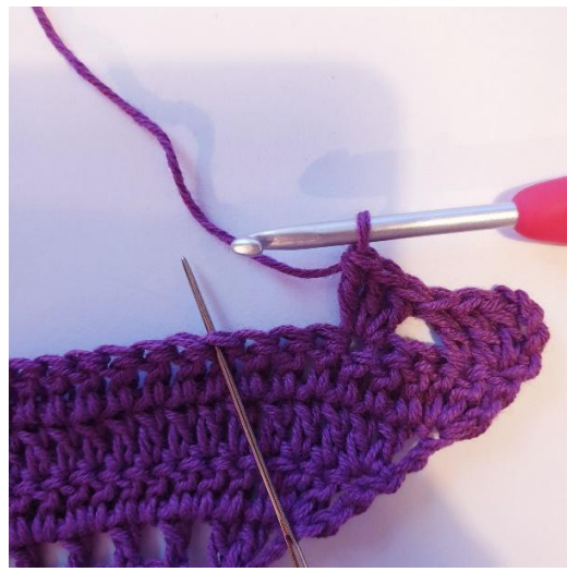
3 stgm i samme m, spring over 3 stgm[ gentag