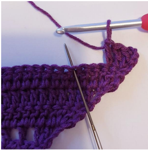
1 stgm, [Spring over 3 m