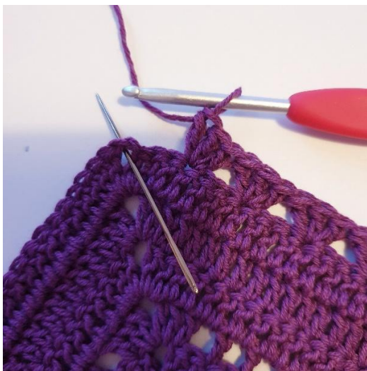
[2 stgm, 2 lm, 2 stgm]