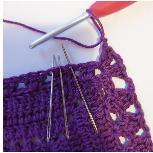
[2 lm, 3 stgm sm, 2 lm] gentag