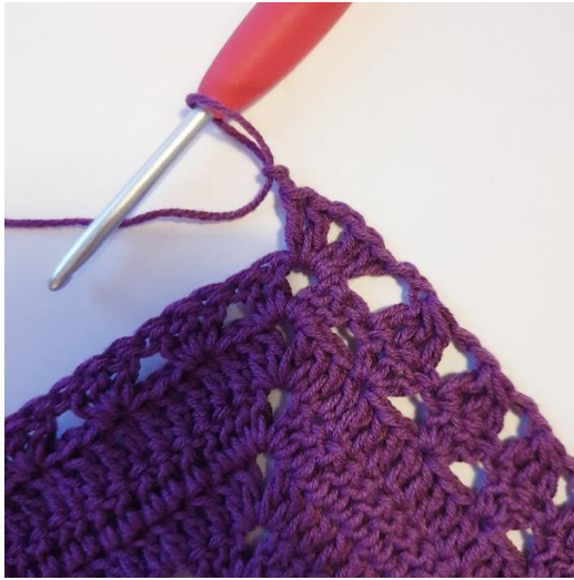
[2 stgm, 2 lm, 2 stgm] i spidsen