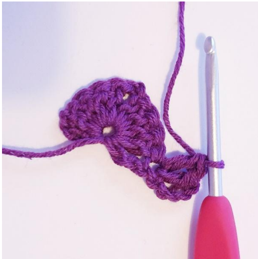
Omgang 2: 2 stgm i første m,