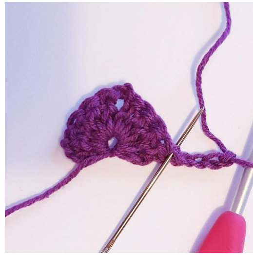
4 lm og vend