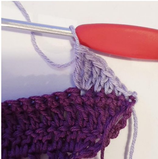
3 dstgm i samme m,