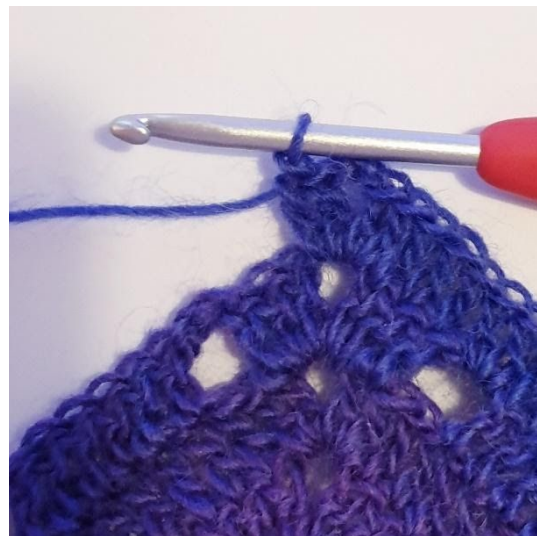
[2 stgm, 2 lm, 2 stgm] i spidsen