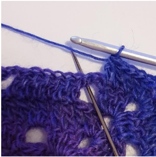
1 stgm i de næste 3 m