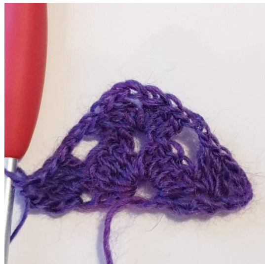
[2 stgm, 1 dstgm] i vendemasken