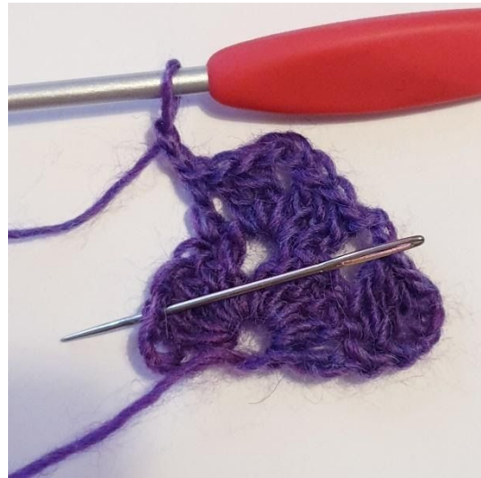
2 lm, spring over 2 m.