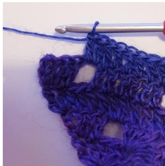
2 stgm i 1m-buen