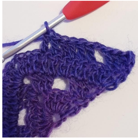
1 stgm i de næste 6 m