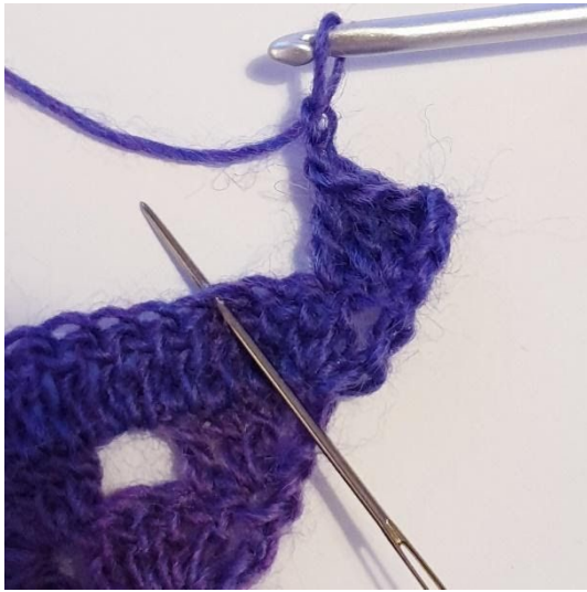
1 stgm, 2 lm, spring over 2 m