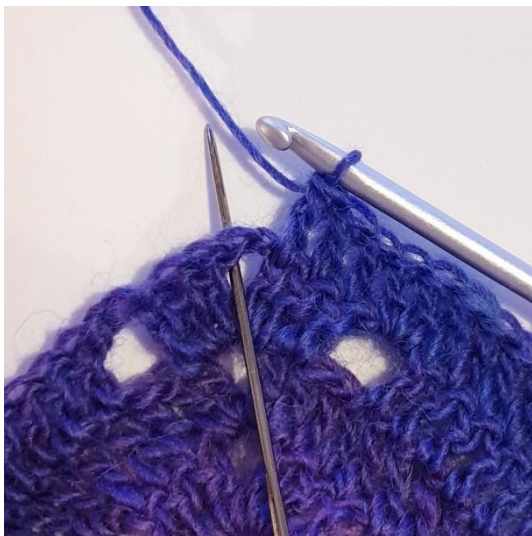
1 stgm i de næste 3 stgm