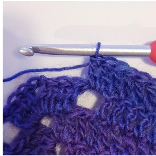
2 stgm i 1m-buen