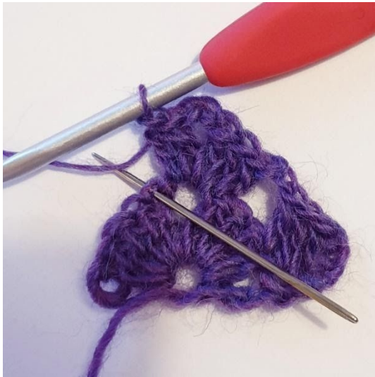
1 stgm i næste m