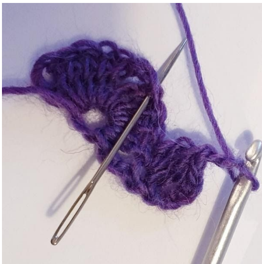
2 lm, spring over 2 m