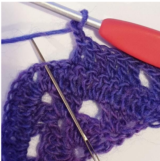
2 lm, spring over 2 m