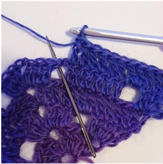
1 stgm i de næste 6 m