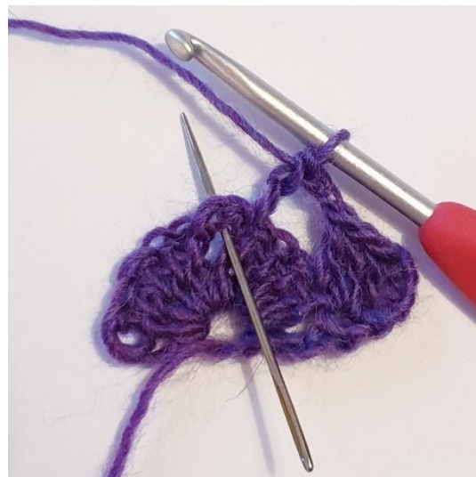
1 stgm, [2 stgm, 2 lm, 2 stgm] i spidsen