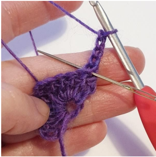
Omgang 2: 2 stgm i første m,