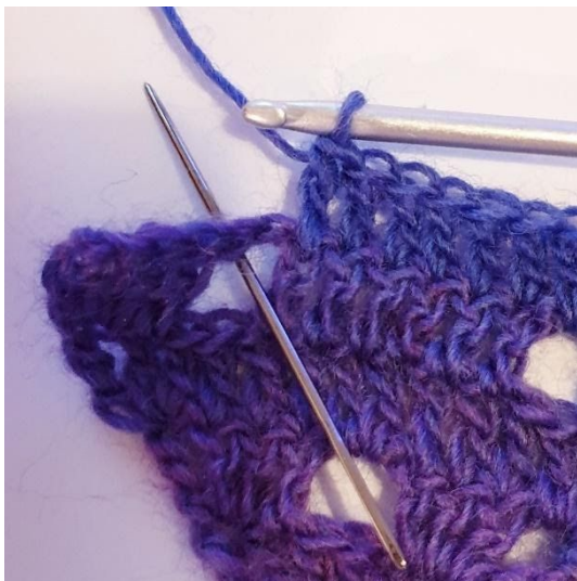
1 stgm i de næste 6 m