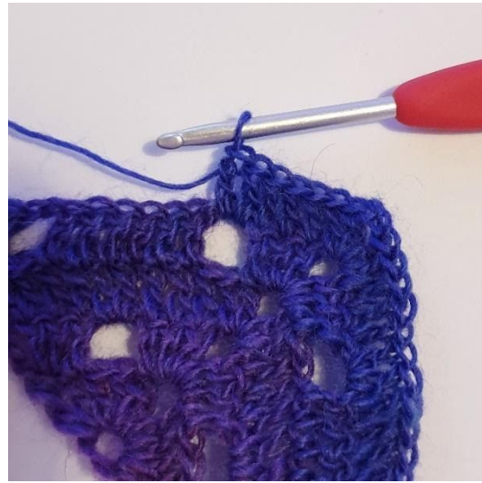
2 stgm i 1m-buen