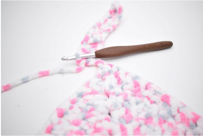
31. Hækl stgm i alle lm.