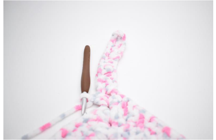
32. Hækl 2 stgm i lm-buen."