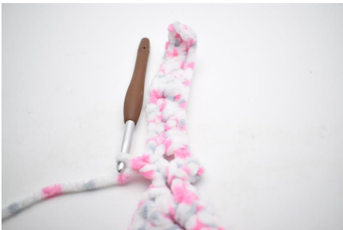
27.Hækl 2 stgm i lm-buen.