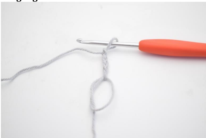
1. Lav en mr. Lav 5 lm.