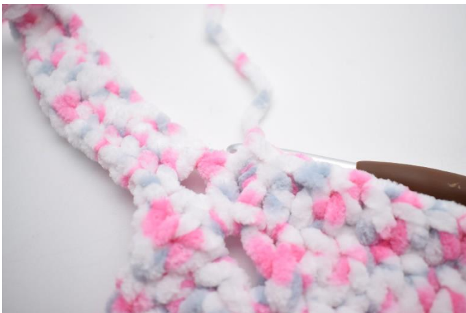
33. Gentag "til" i alt 3 gange. Hækl 1 stgm i de sidste 79 m. Afslut med 1 km i 3. lm.