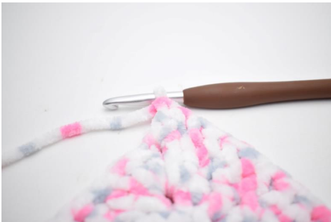
29.I lm-buen hækles 2 stgm.