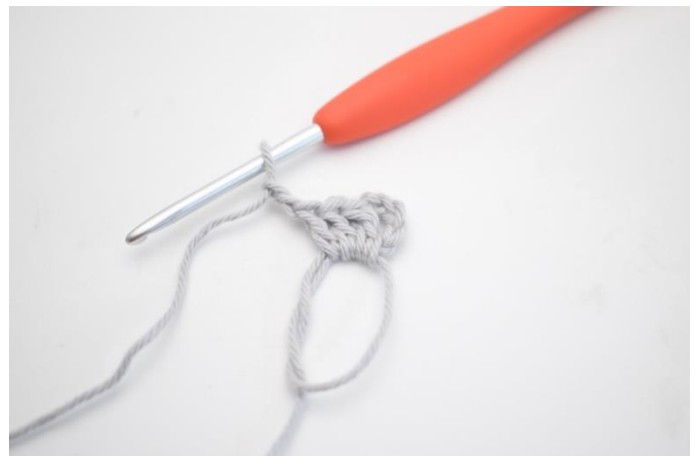
2. Hækl "3 stgm og 3 lm".