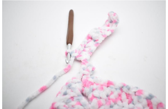
26.Hækl stgm i alle lm.