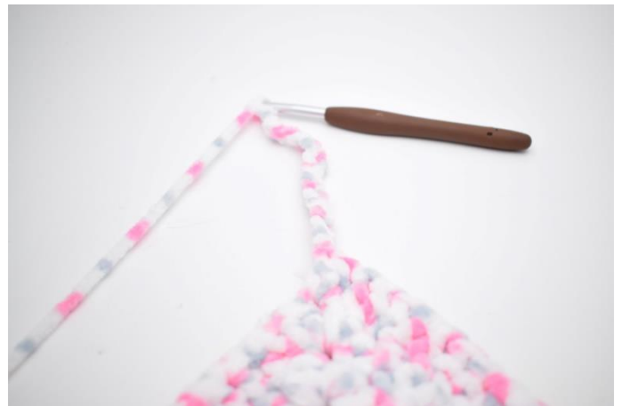
30.Lav 17 lm. Hækl 1stgm i 3. lm fra nålen.