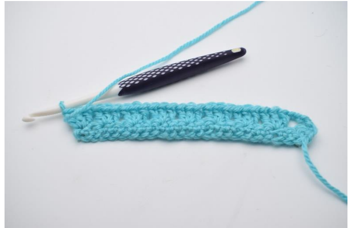
8. Gentag rækken ud. Rækken afsluttes med 1 stgm gruppe.