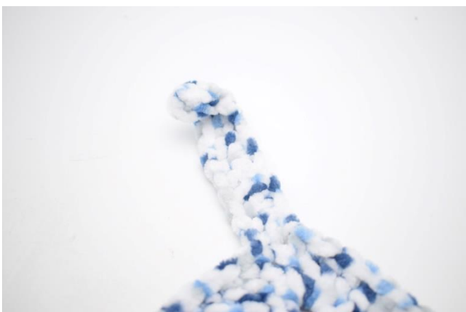
3. I næste hjørne bindes en knude.