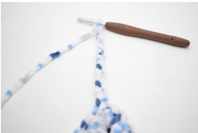
36. Lav 15 lm. Hækl 3 fm i 2. lm fra nålen. Hækl 3 fm i hver af de sidste 12 lm.