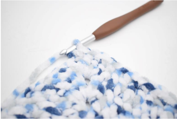
32. Hækl 1 fm i de næste 32 m.