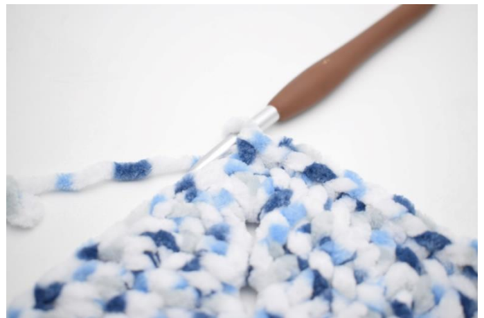
35. Hækl 1 fm i de næste 32 m.