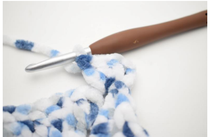
22. Hækl 3 stgm i lm-buen.