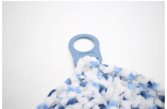
2. Fold "snippen" omkring åbningen i adapteren og sy den fast.