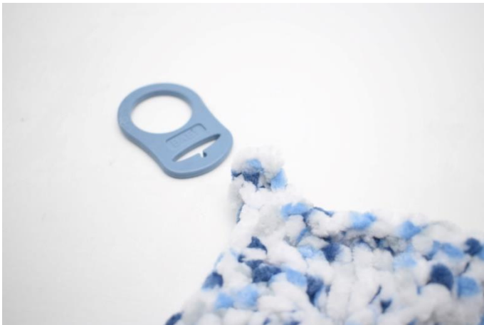
1. I første hjørne monteres sutteadapter.