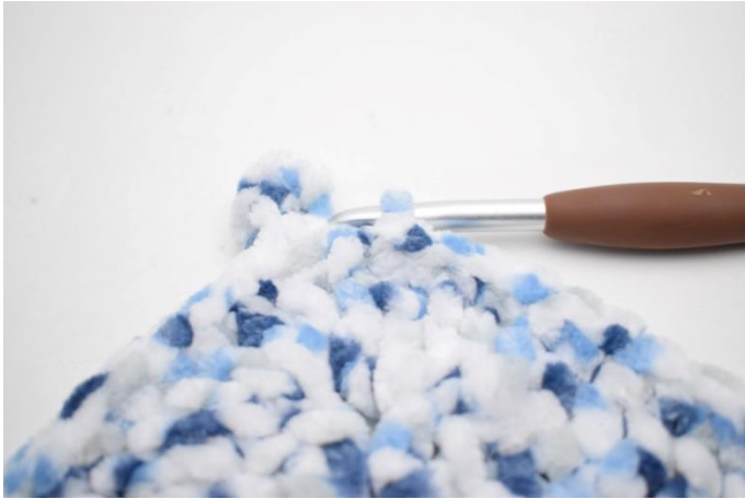
38. Hækl 1 fm i de sidste 30 m. Afslut med 1 km.