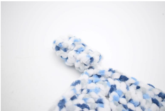
7. Det sidste hjørne er som det skal være.