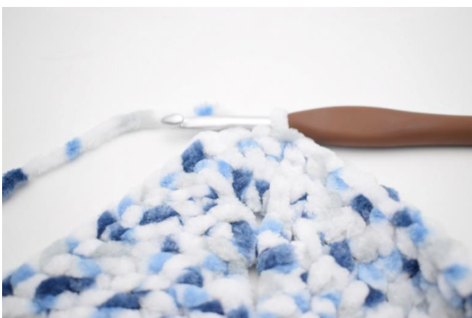
25. Gentag "til" i alt 3 gange. Hækl 1 stgm i de næste 27 m og 1 stgm i lm-buen fra omgangens start. Afslut med 1 km i 3. lm.