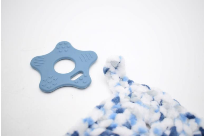
5. I hjørne 3 monteres bideringen.