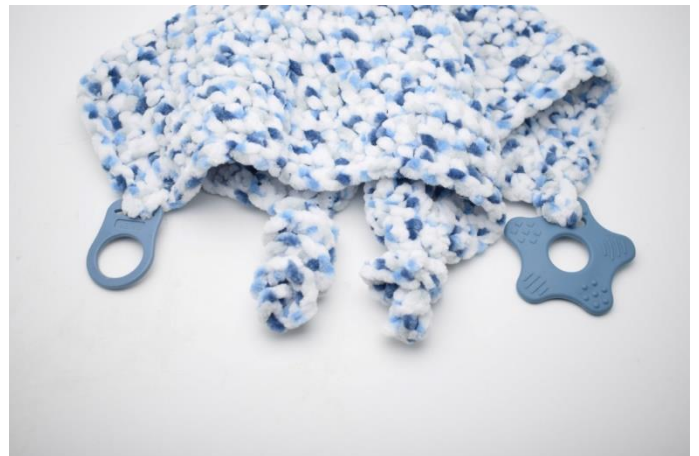
8. Din Nuzzle-klud er nu klar til at blive nusset, nulret og puttet med 😊