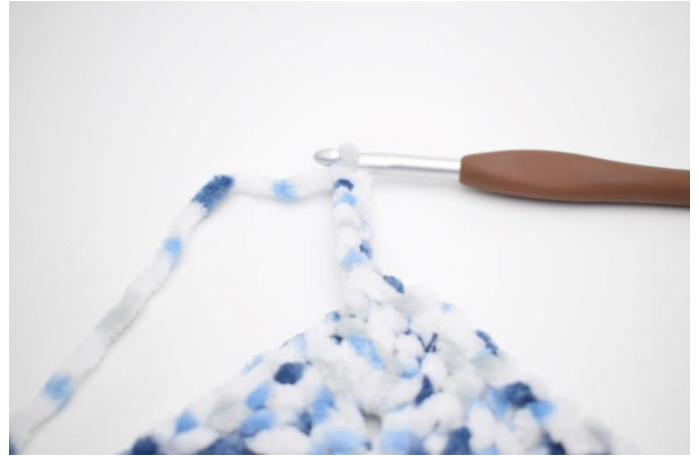
33. Lav 6 lm og hækl 1 fm i 2. lm fra nålen. Hækl 1 fm i de sidste 4 lm.