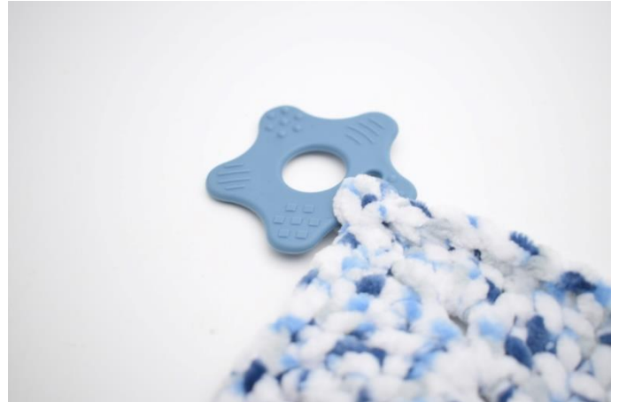
6. Fold "snippen" omkring åbningen og sy den fast.