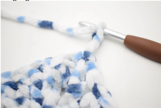
21. Lav 1 km i lm-buen. Lav 3 lm.