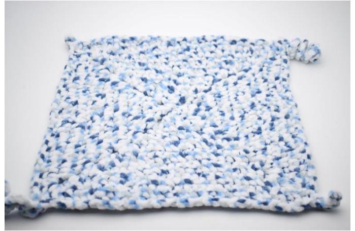
39. Klip garnet og hæft ender.