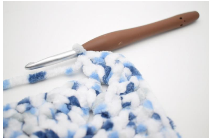
24. Hækl 5 stgm i næste lm-bue".