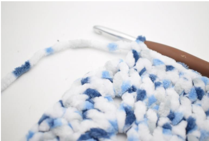
23. Hækl "1 stgm i de næste 27 m.