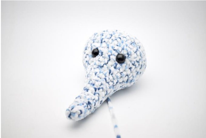
1. Kom fyld i snablen og hovedet.