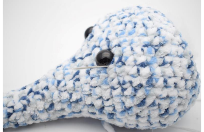
2. Lav fordybninger med nål og hvidt bomuldsgarn. Træk nålen ud på den ene side af øjet.