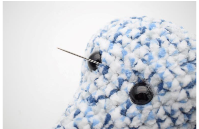
4. Stik nålen op på den ene side ved det andet øje.