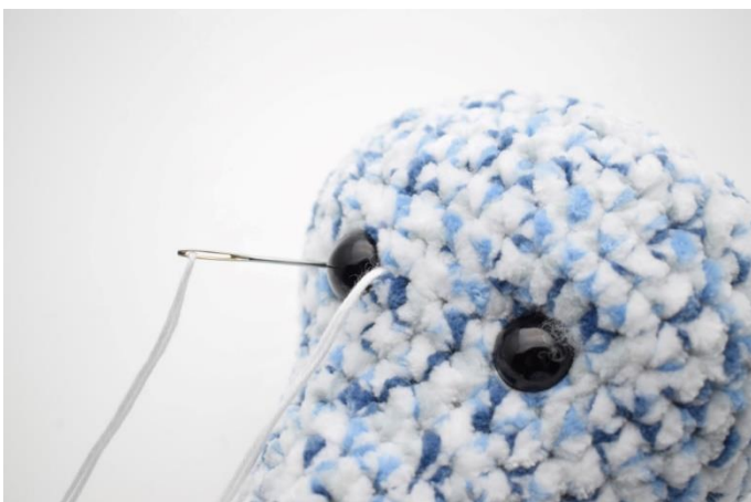
5. Stik nålen ned på den anden side af øjet.