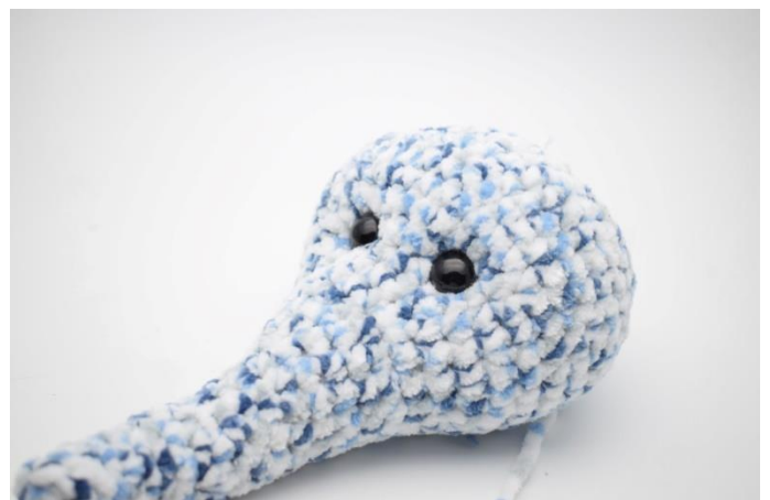
6. Stram lidt til så øjnene trækkes lidt tilbage, og der er lavet fordybninger under øjnene. Hæft garnet.