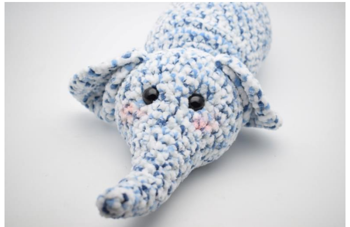
4. Giv ham evt. lidt kinderødt på kinderne.