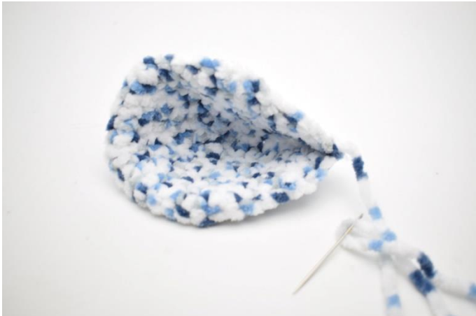
1. Fold ørene som på billedet her, så det får et lille "knæk".