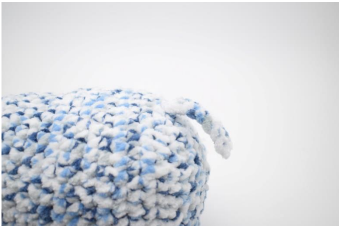
3. Sy halen fast øverst på elefantens bagdel.