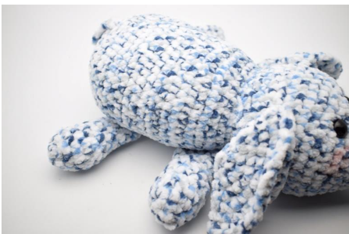
5. Sy benene fast under maven på elefanten.