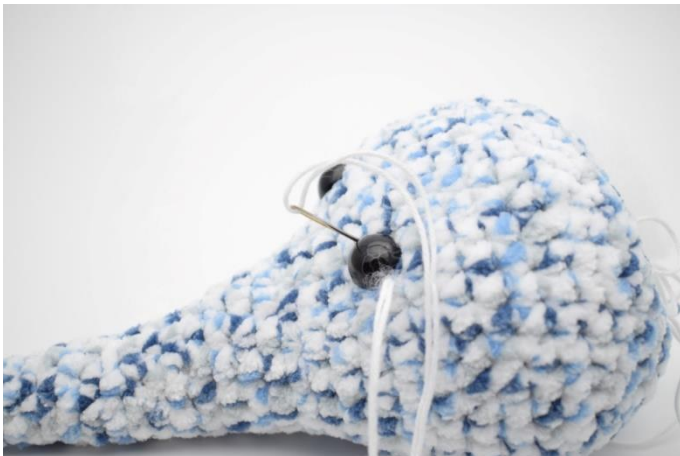
3. Stik nålen ned på den anden side af øjet, og stram lidt til.