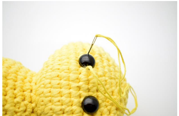
4. og ned igen i den anden side af øjet.