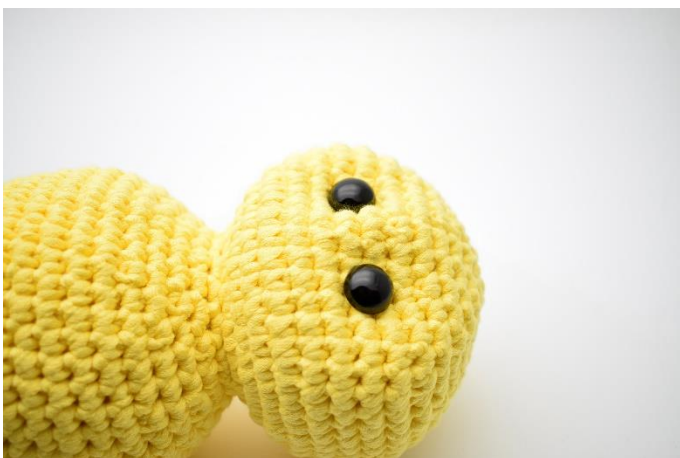
5. Træk lidt til så øjnene trækkes lidt ind og der dannes fordybninger.