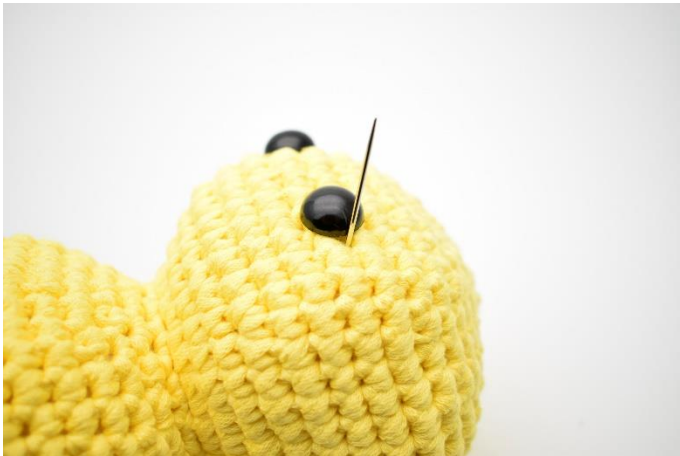
1. Med gult garn trækkes nålen ud i siden på det ene øje,

Lav evt. fordybninger ved øjnene med bomuldsgarn på følgende måde: