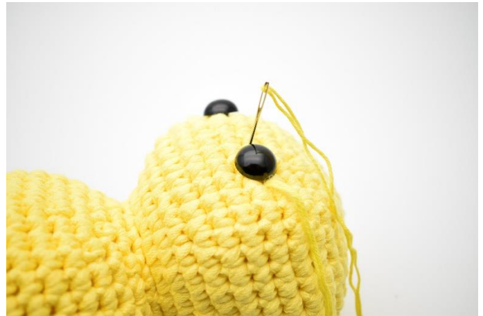
2. Stik nålen ned i den anden side af øjet og træk lidt til.