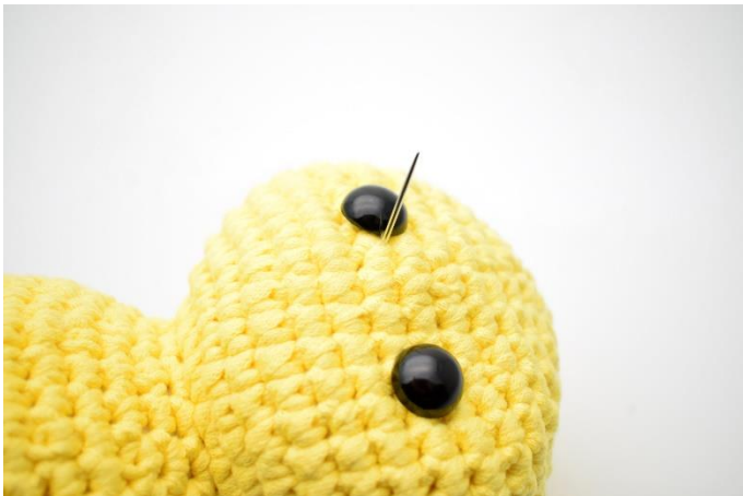
3. Stik nålen ud ved siden af det andet øje.