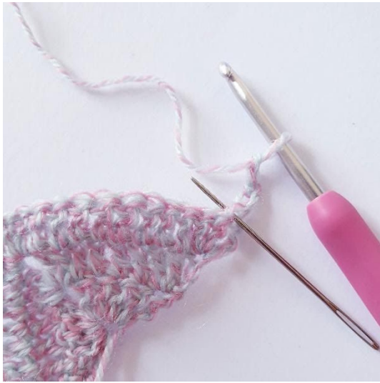
Omgang 4: 2 stgm i første m