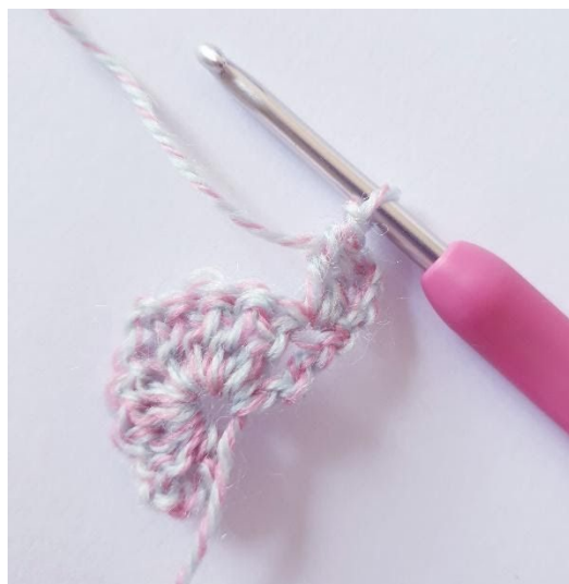
Omgang 2: 2 stgm i første m