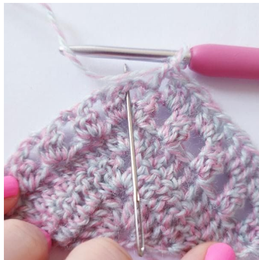
I spidsen: [2 stgm, 2 lm, 2 stgm]