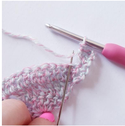
1 stgm i næste m