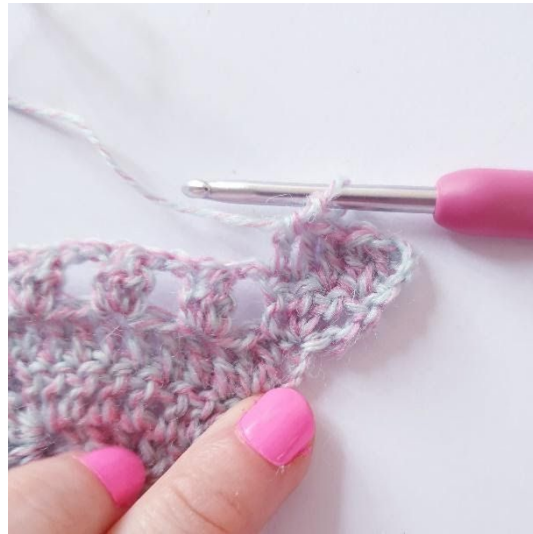
1 stgm i de næste 3 m