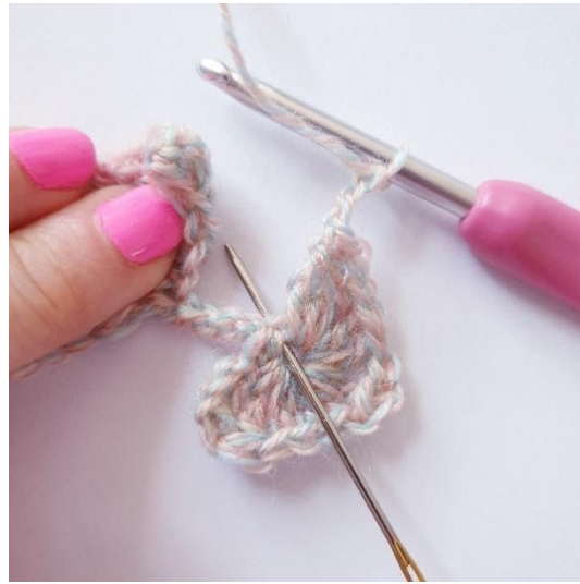
km] omkring ringen