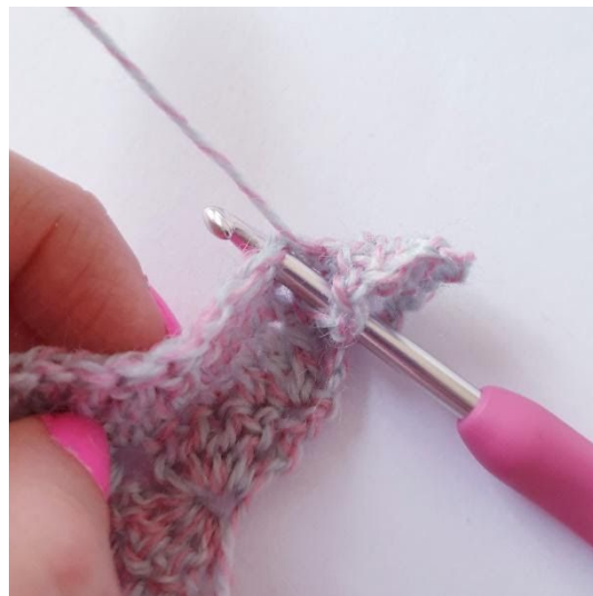
3-stgm-puffm [Slå garn om nålen og stik ned i masken,