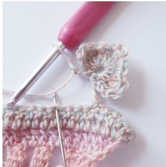
3 lm, spring over 3 m