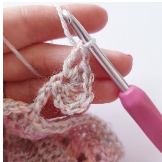
1 lm, 1 dstgm,