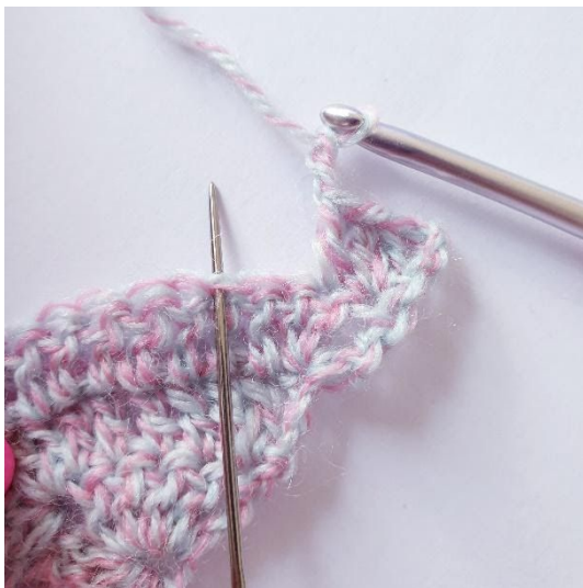
2 lm, spring over 2 m