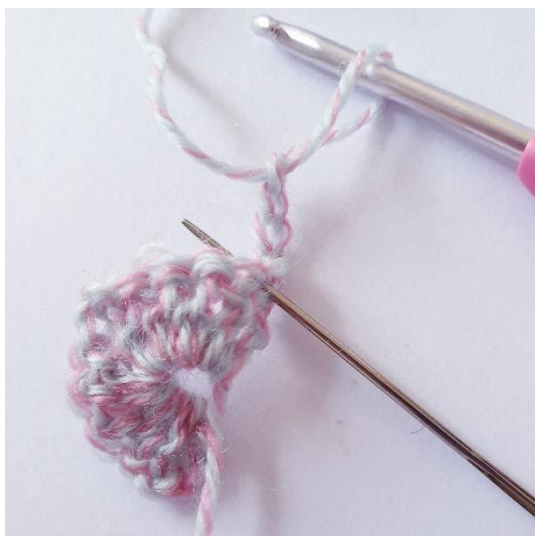
Lav 4 lm og vend