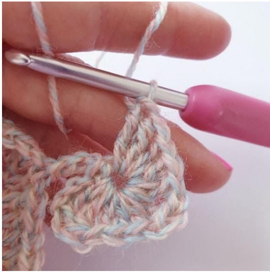
1 lm, 3 stgm, 2 dstgm, 3 lm,