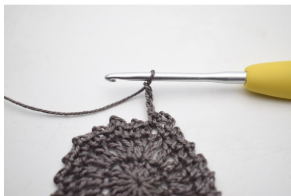
4. "Lav 3 lm, hækl 1 fm i næste lm-bue".