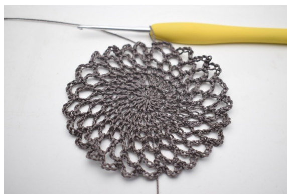
1. "Lav 5 lm, hækl 1 fm i næste lm-bue". Gentag "til" omgangen rundt. (24 lm-buer)