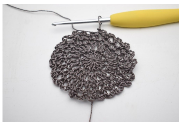
6. Gentag "til" omgangen rundt. (24 lm-buer)