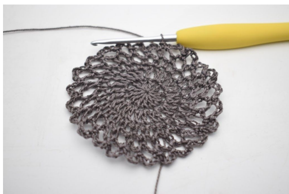
1. "Lav 4 lm, hækl 1 fm i næste lm-bue". Gentag "til" omgangen rundt. (24 lm-buer)