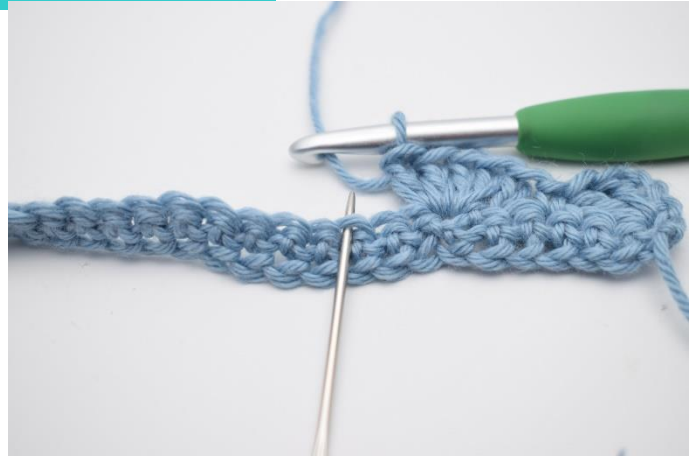
8. Spring 2 m over og hækl 1 fm i næste m.