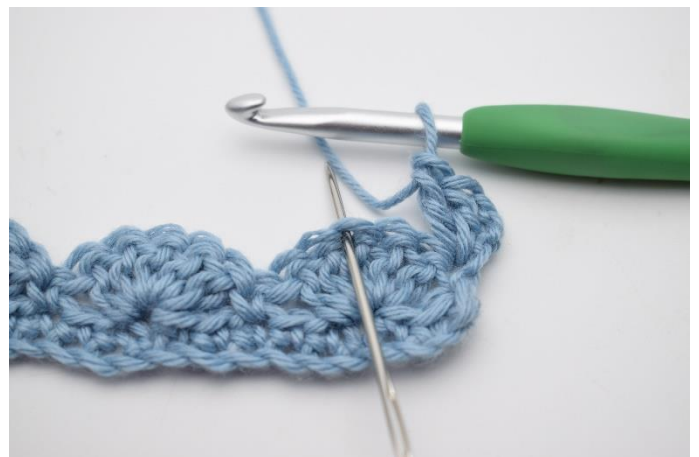
4. Spring 2 m over og hæk 1 fm i næste m.