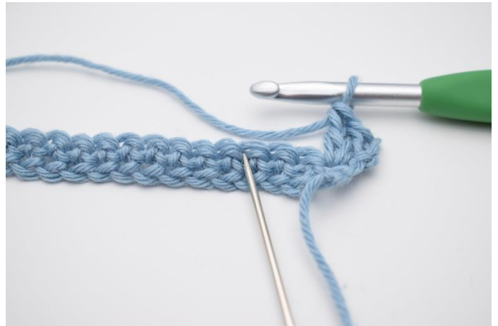
4. Spring 2 m over og hæk 1 fm i næste m.