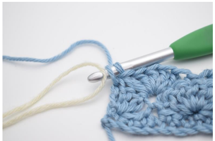
14. Der skiftes farve i sidste gennemtræk. Gentag række 3 og 4 som beskrevet i opskriften.