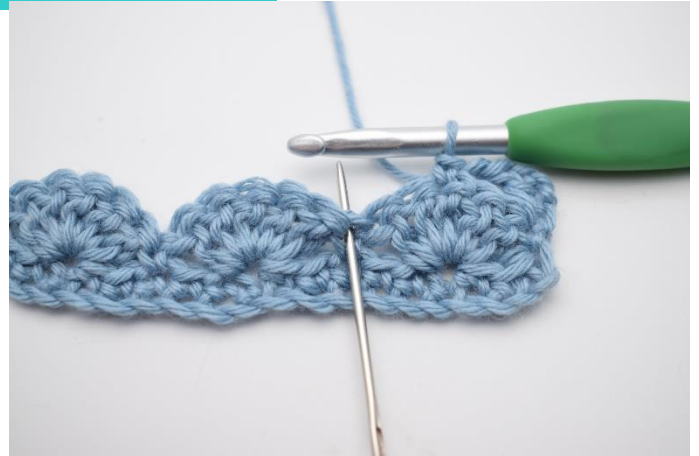
6. Spring 2 m over og hækl 5 stgm i næste m.