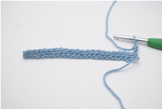
1. Vend dit arbejde med 3 lm.