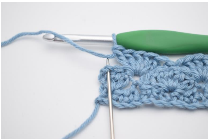
13. I sidste m hækles 1 fm.