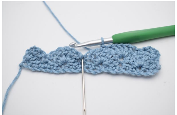
10. Spring 2 m over og hækl 5 stgm i næste m.