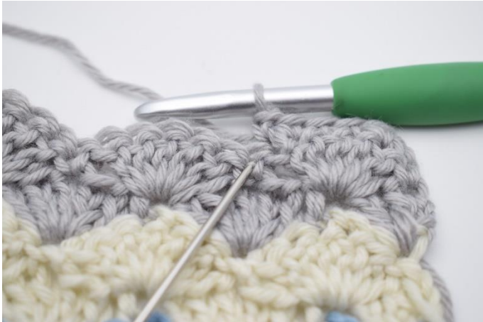
3. I næste m hækles 1 hstm.