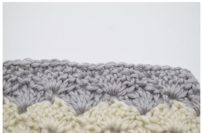
8. Gentag dette rækken ud. Klip garnet og hæft ender.