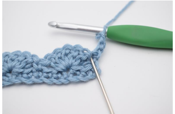
2. I første maske hækles 2 stgm.