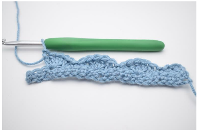
12. Gentag dette rækken ud til du har 3 m tilbage.