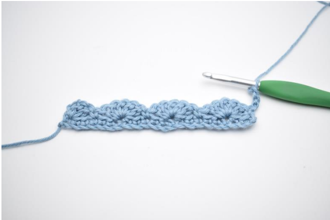
1. Vend dit arbejde med 3 lm.