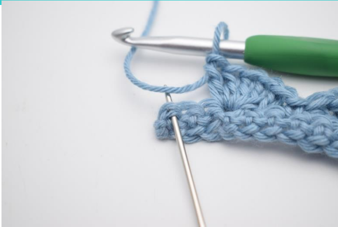
13. I sidste m hækles 1 fm.