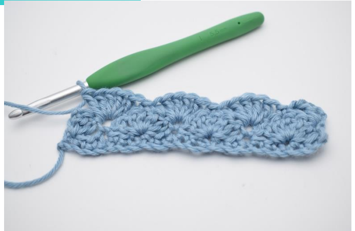
12. Gentag dette rækken ud til du har 3 m tilbage.