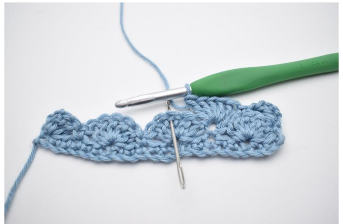
8. Spring 2 m over og hækl 1 fm i næste m.