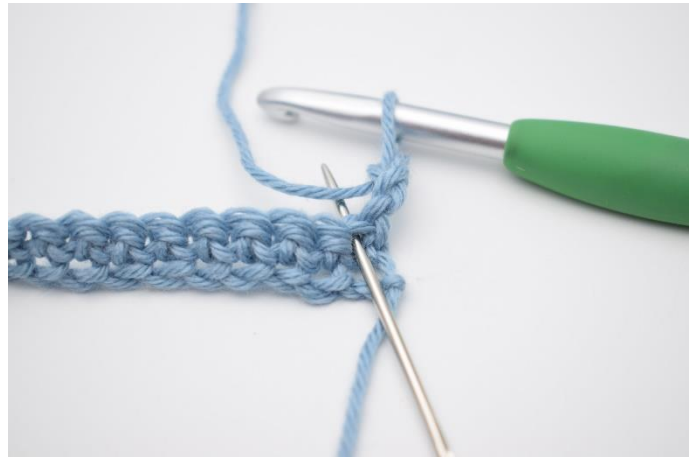
2. I første maske hækles 2 stgm.