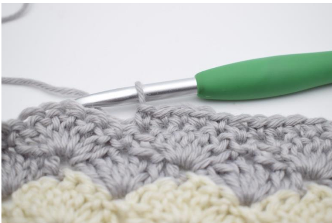
5. Hækl 1 fm i de næste 5 m.