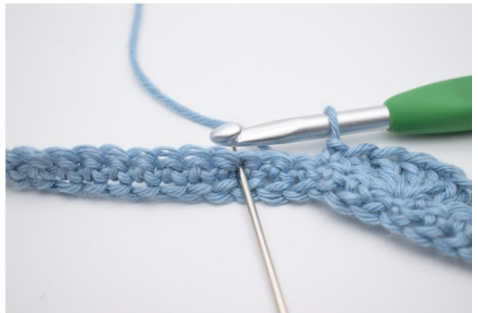
10. Spring 2 m over og hækl 5 stgm i næste m.