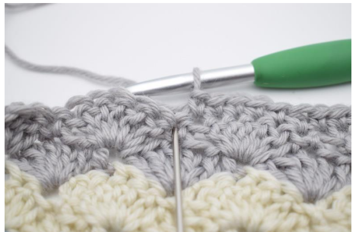
6. I næste m hækles 1 hstm.