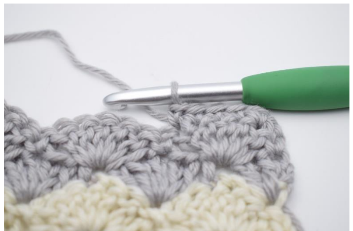
2. Hækl fm i de næste 5 m.