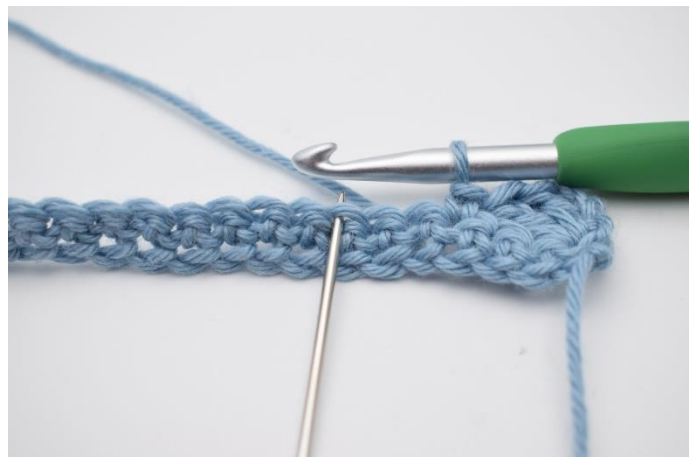
6. Spring 2 m over og hæk 5 stgm i næste m.