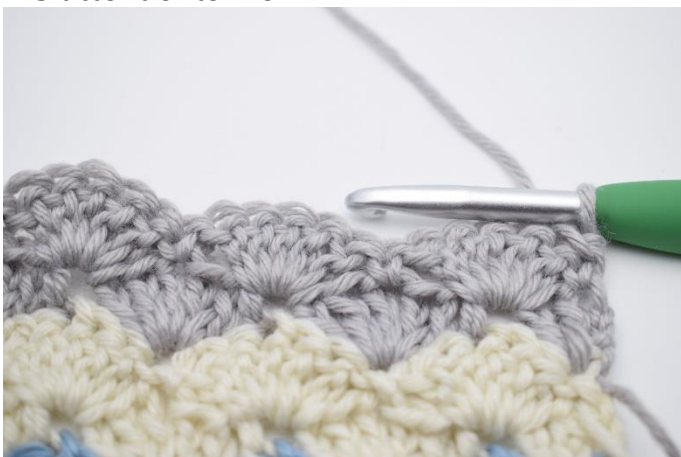
1. Vend dit arbejde med 1 lm.